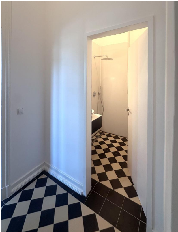
WC mit Regendusche