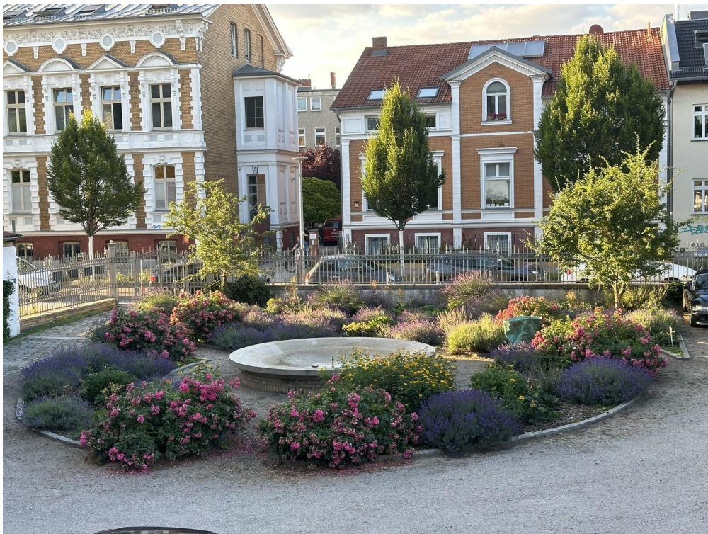
Hof der Villa