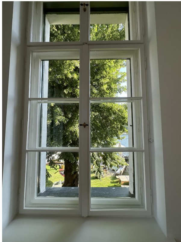
Blick aus Raum SO