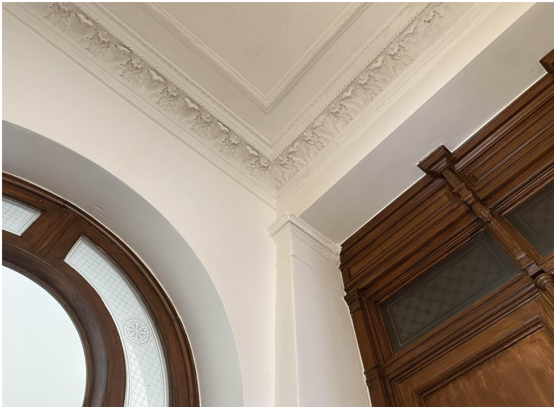
Stuckdecken im Empfangsbereich