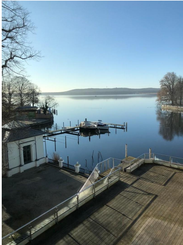
Der Blick auf den Müggelsee