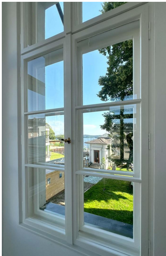
Blick auf das Bootshaus