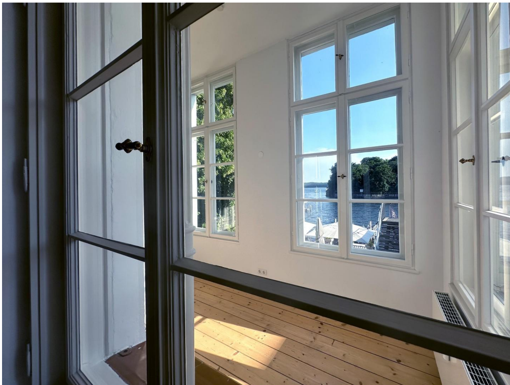
Blick aus dem Wintergarten