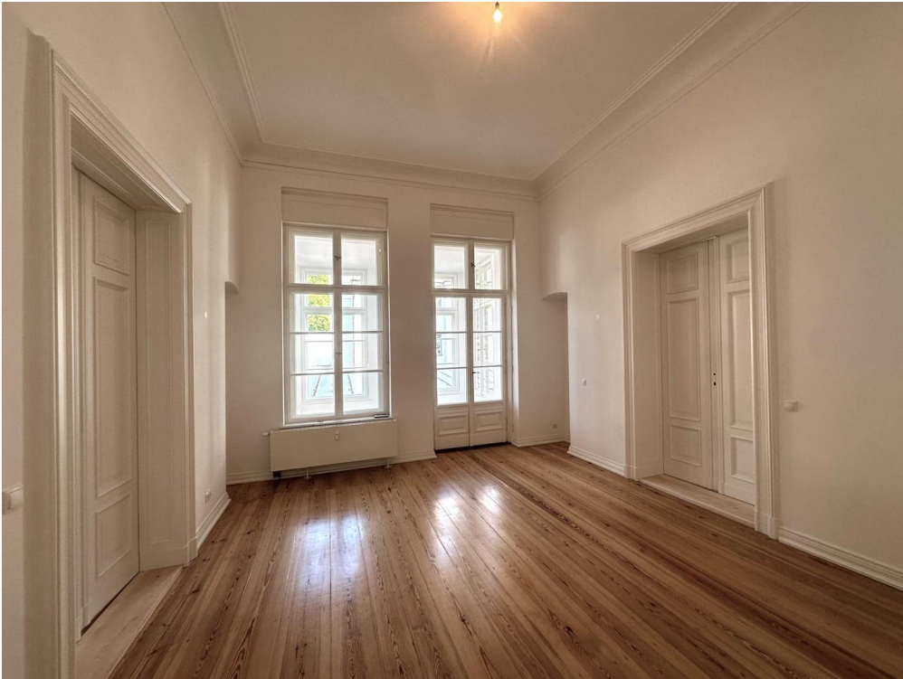
Raum Ost mit Wintergarten