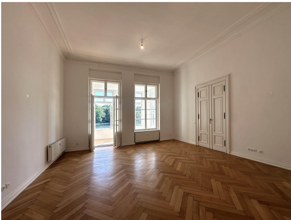
Süd, Wintergarten, Seeblick