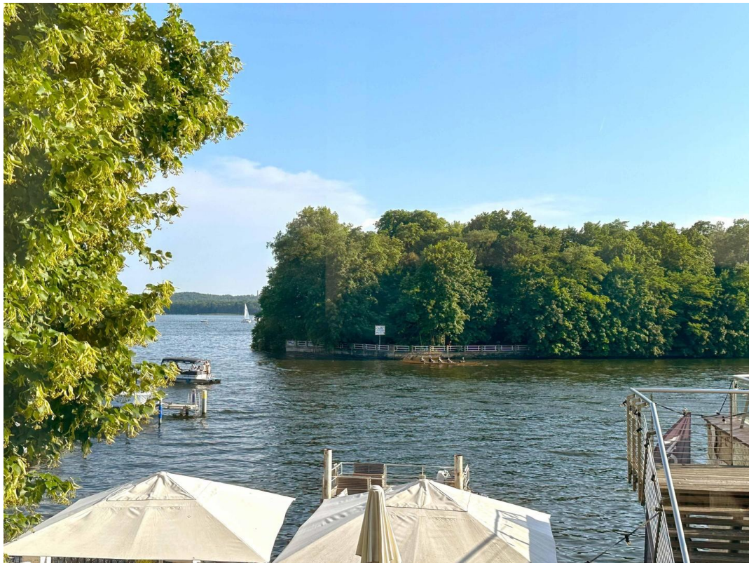
Blick auf den See