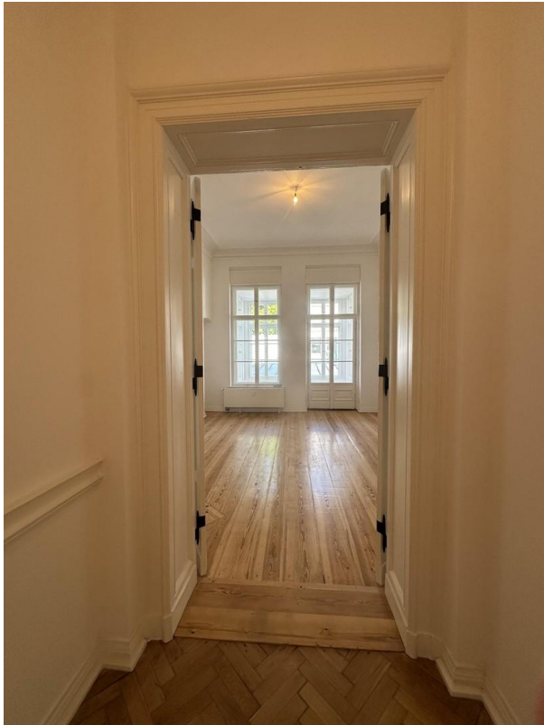
Blick in Raum O