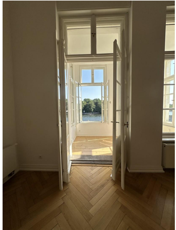
Aussicht vom Raum S auf See