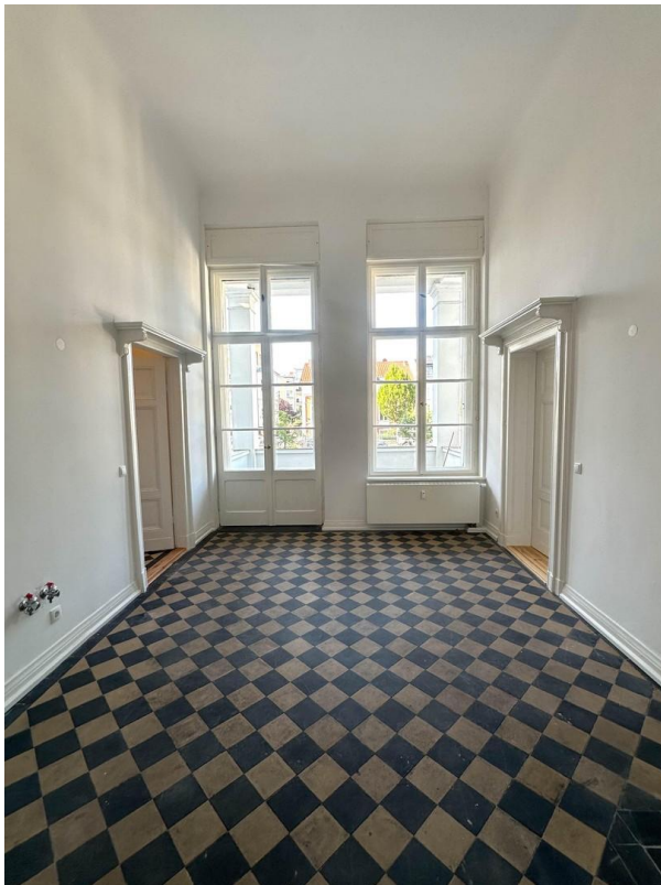
Raum Nord, Terrasse