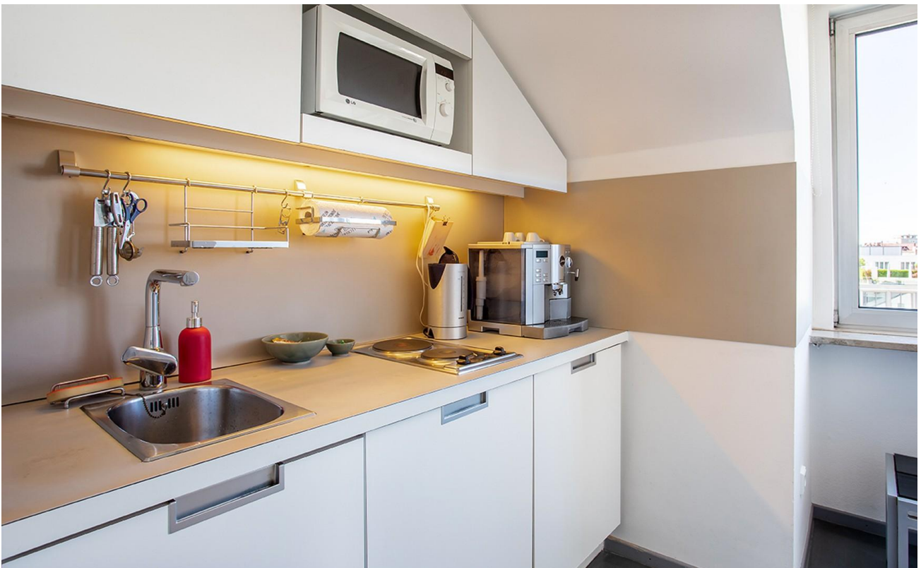
Küche mit Alpenblick