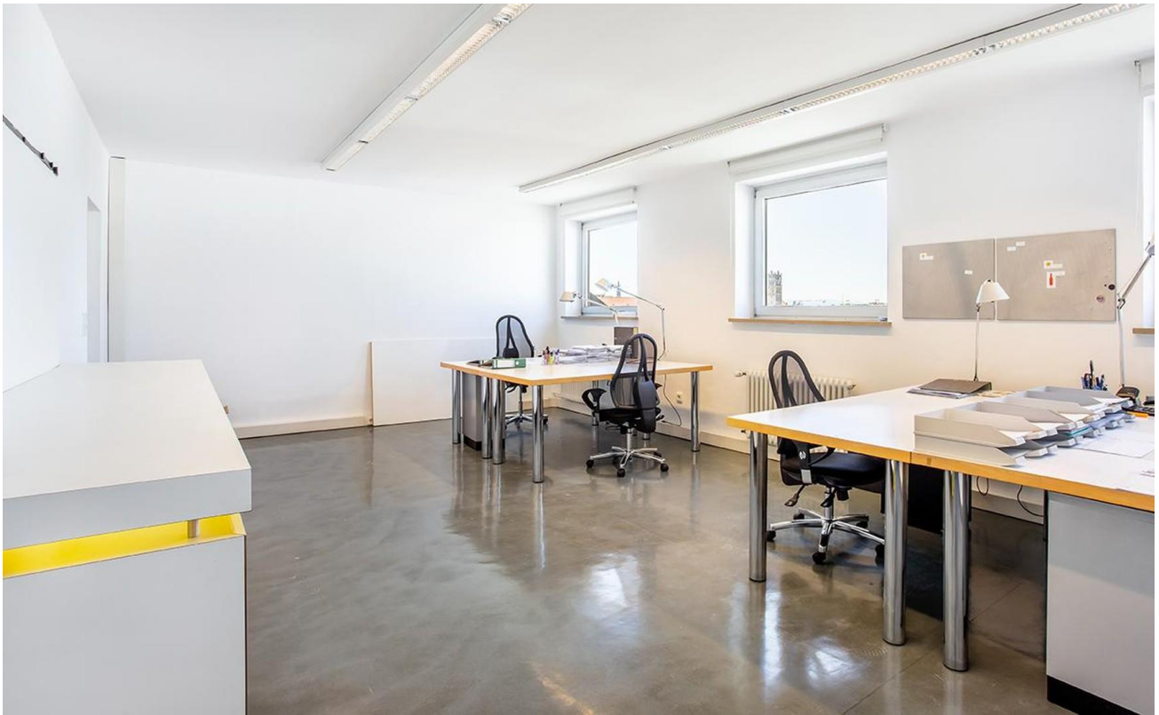
heller lichter Raum