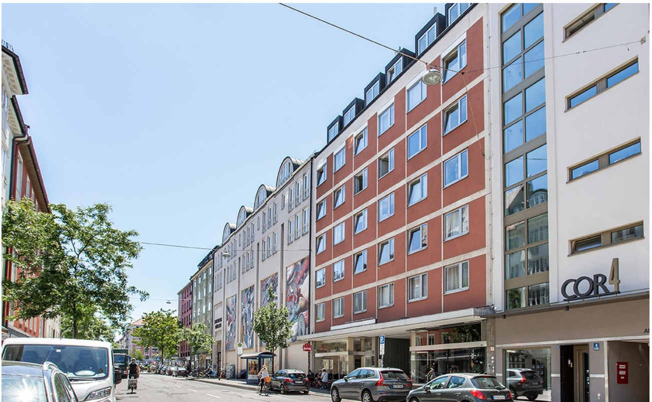
Gebäude Dachgesch Gärtnerplatz