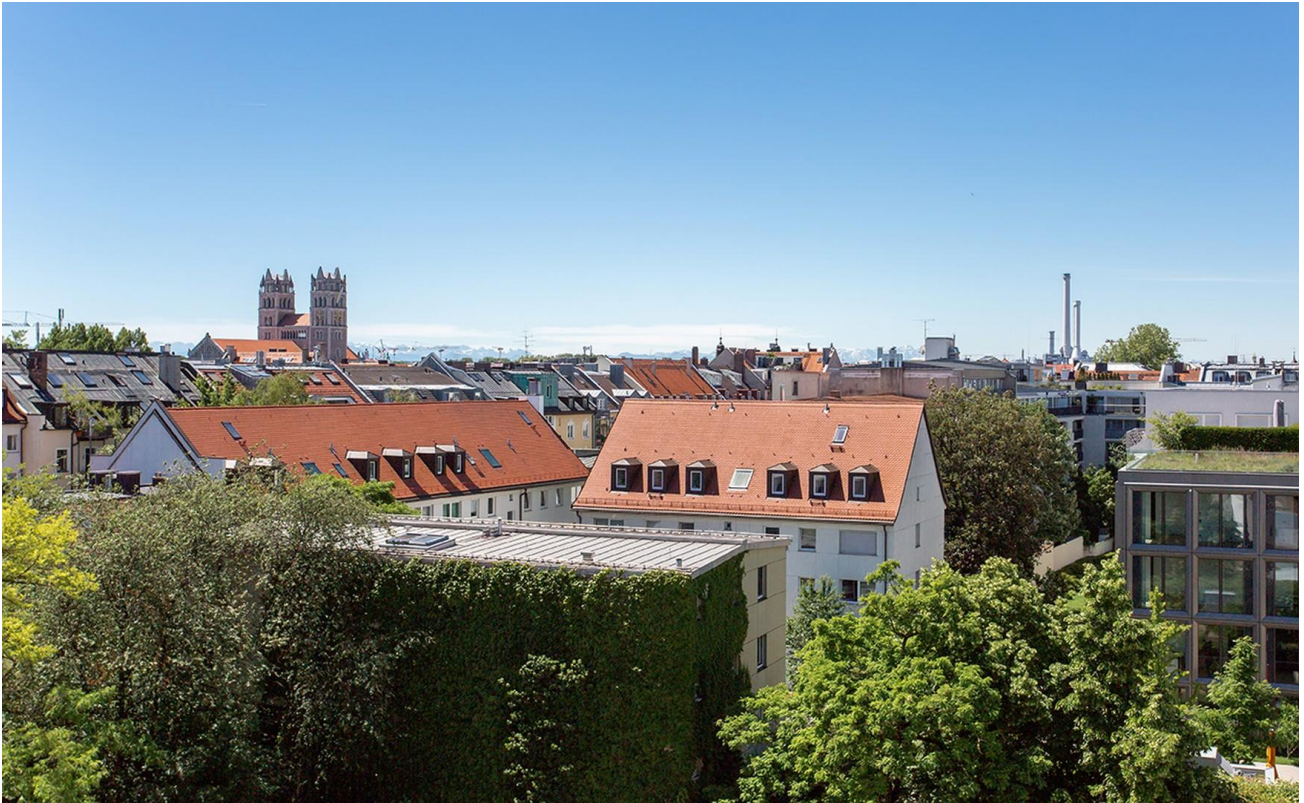
Traumblick Alpen Büroaussicht