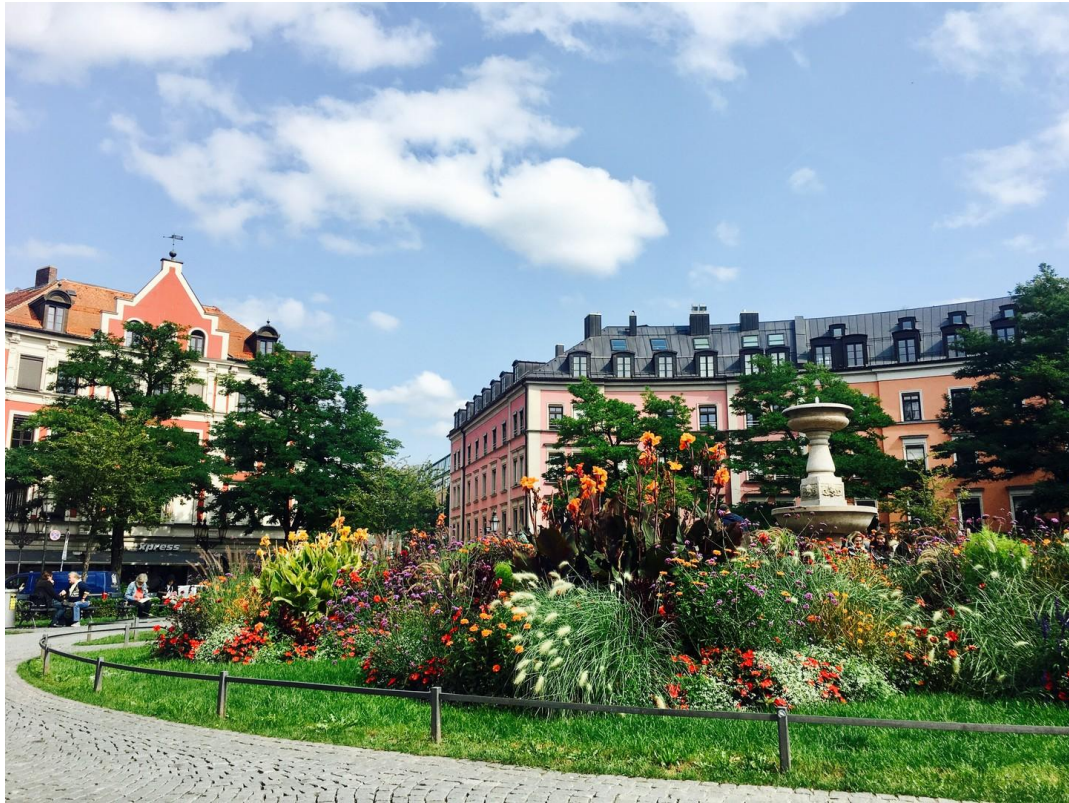
Gärtnerplatz vor der Türe