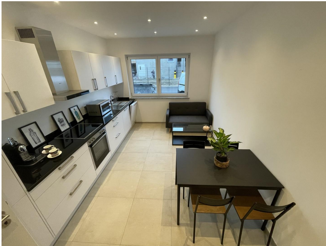
Küche mit Sitzmöglichkeiten