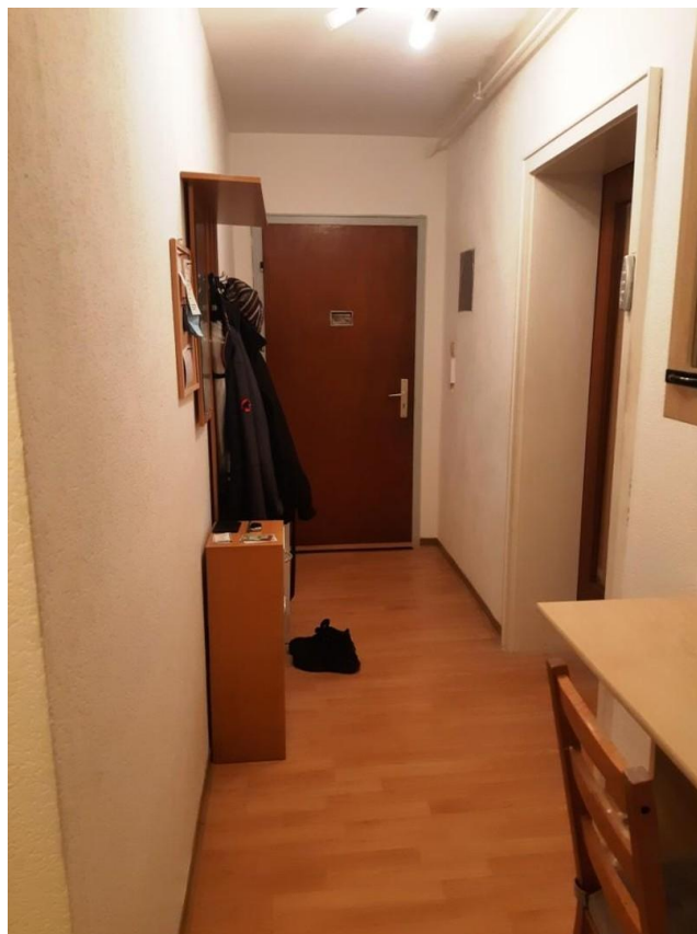
Flur und Eingangsbereich