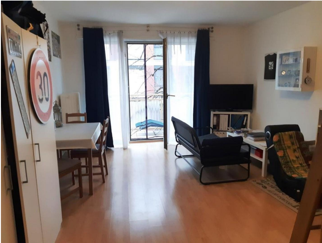
Schlaf- und Wohnzimmer 1