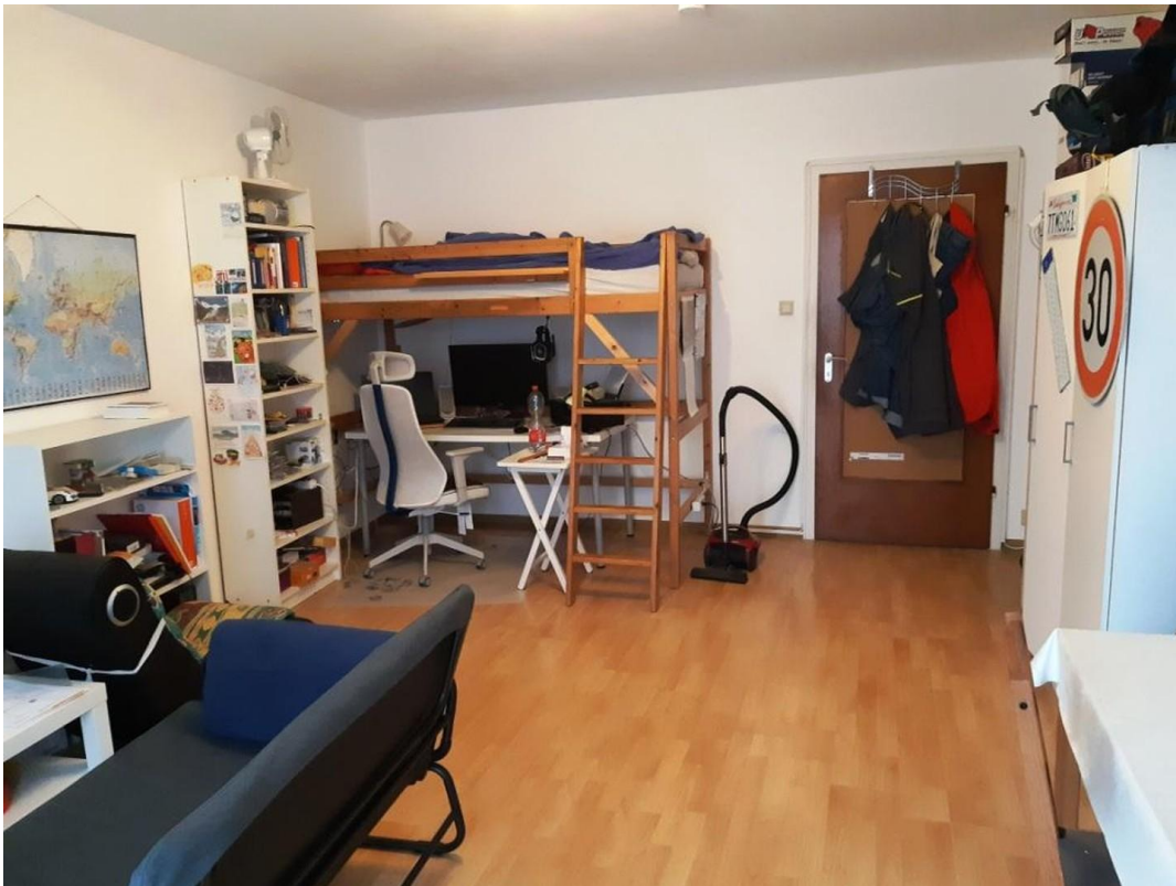
Schlaf- und Wohnzimmer 2