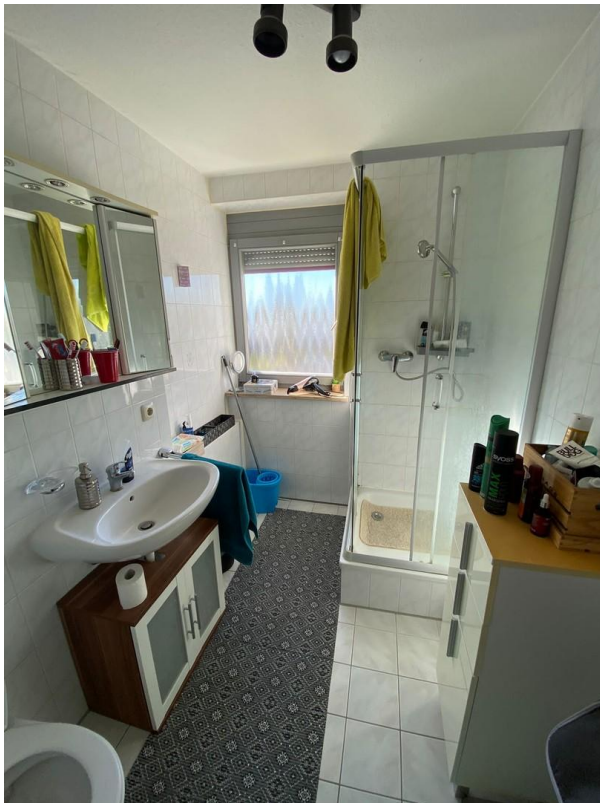
Bad mit Fenster