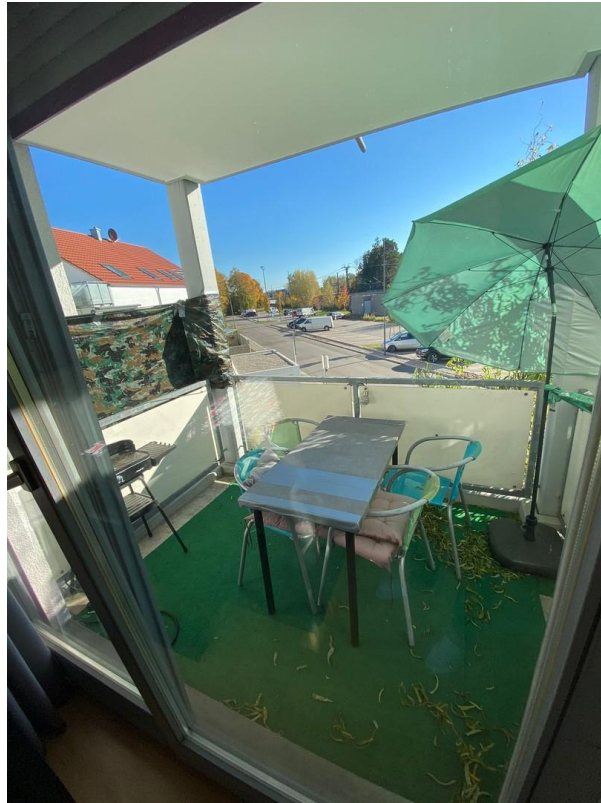
Balkon in Süd-West-Ausrichtung