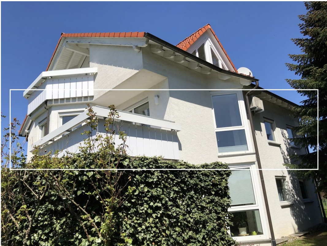
Ihre neue Wohnung