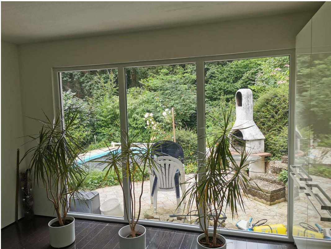
Blick auf aus der Küche