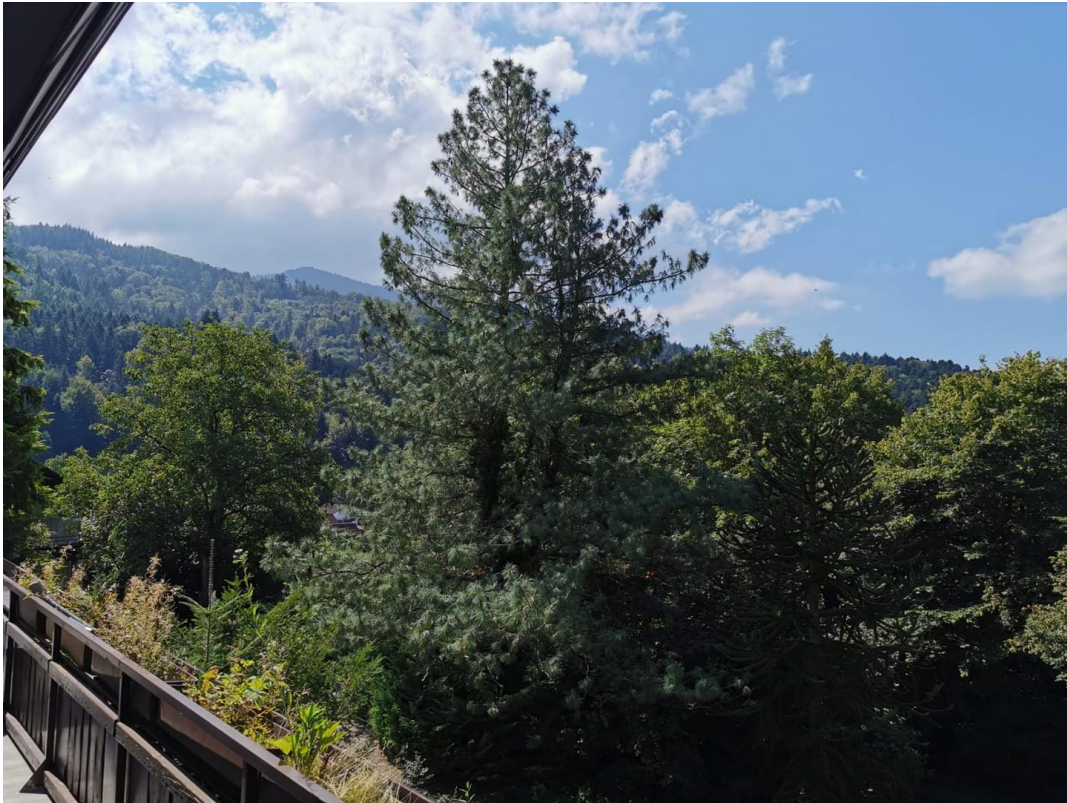
Blick aus dem Balkon