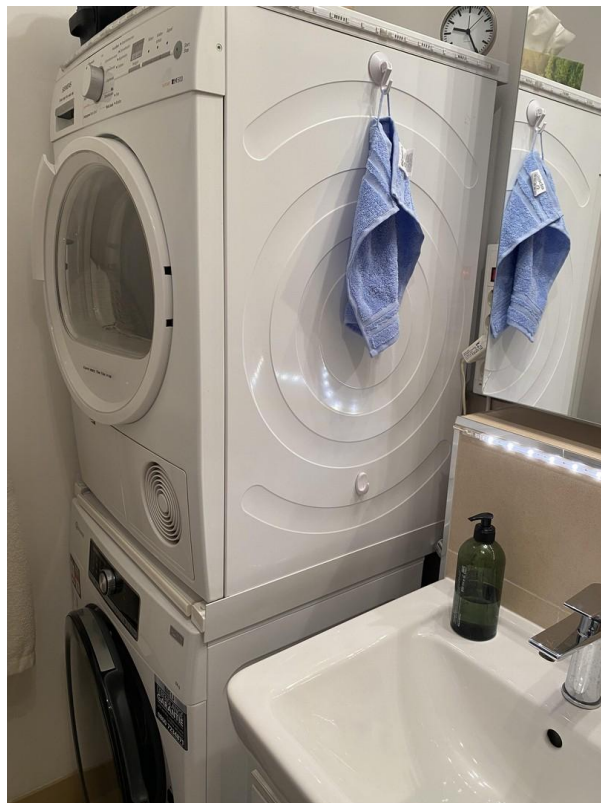
Washer & dryer in unit