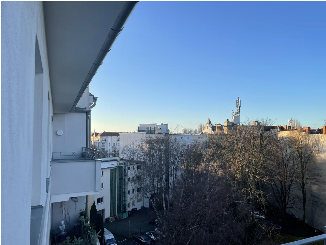
View from Balcony