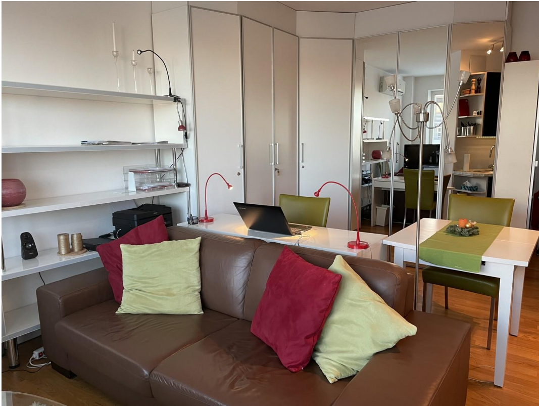
Home office area