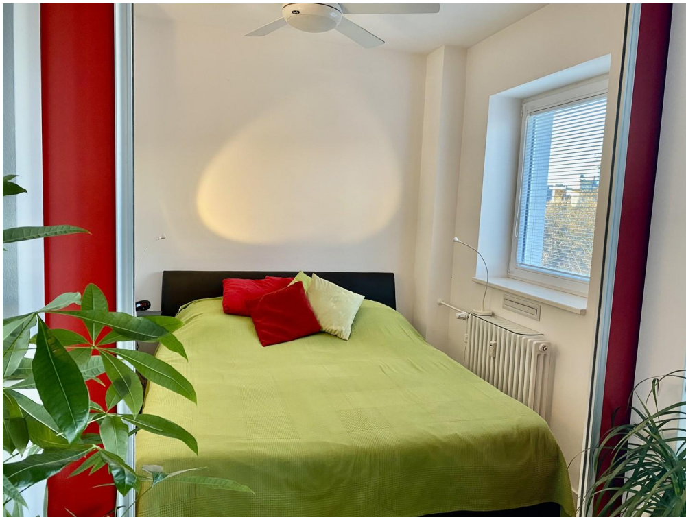
Bedroom from closer