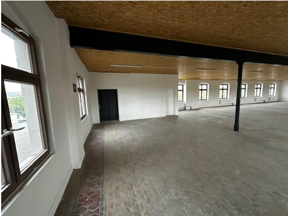
Lager- und Produktion 3.OG