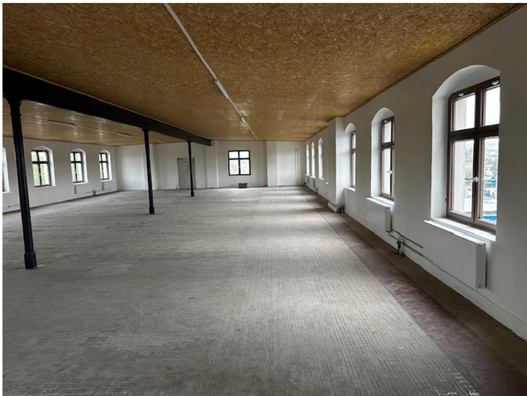
Lager- und Produktion 3.OG