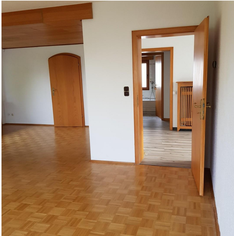
Wohnzimmer - Wohndiele - Bad