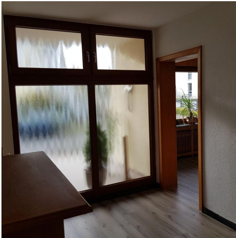
Wohndiele - Schlafzimmer