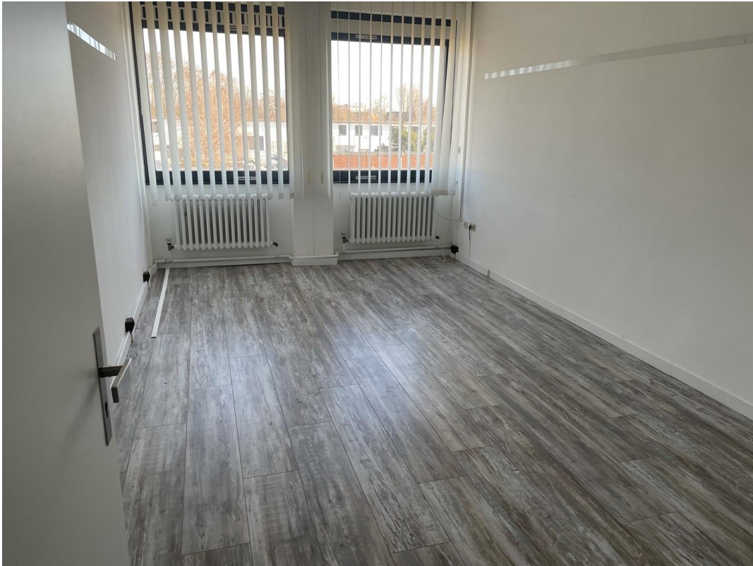
1. OG Büro 3