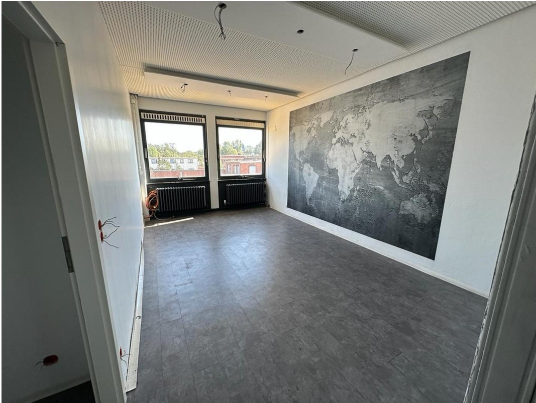
1. OG Büro