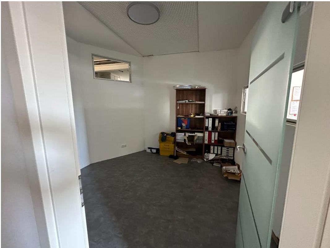
1. OG Büro