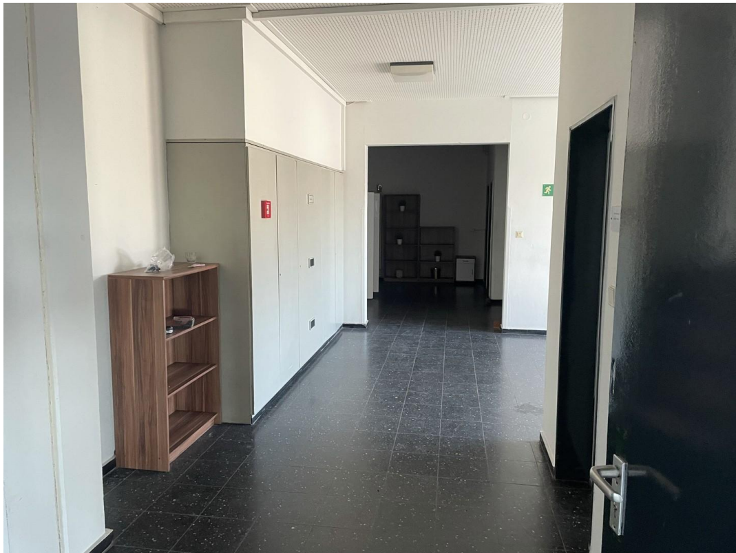
Flur 1. OG