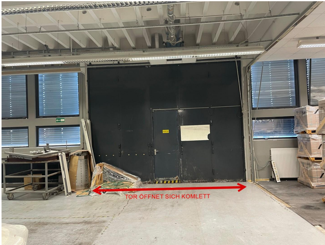
Lager EG Tor