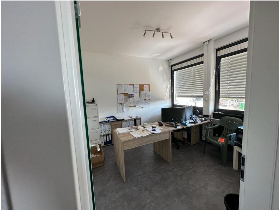
1. OG Büro