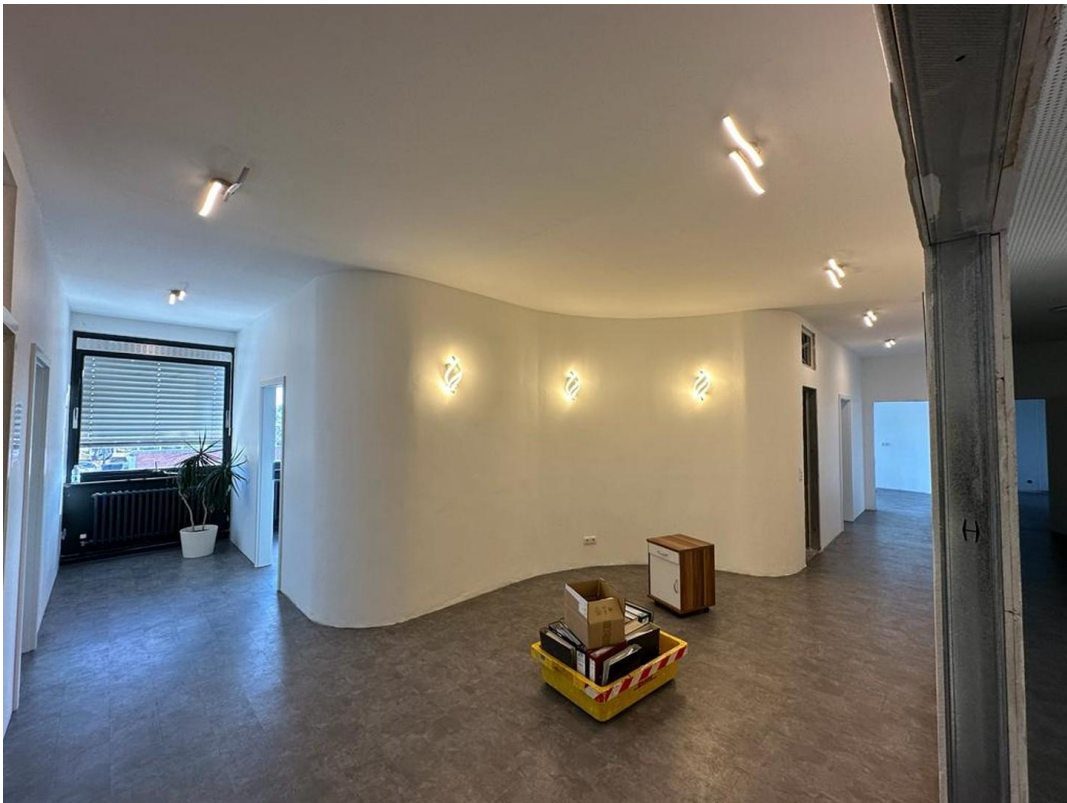
1. OG Büro