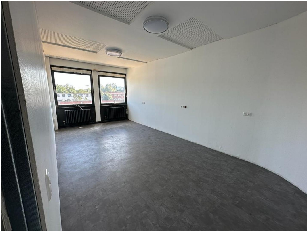
1. OG Büro