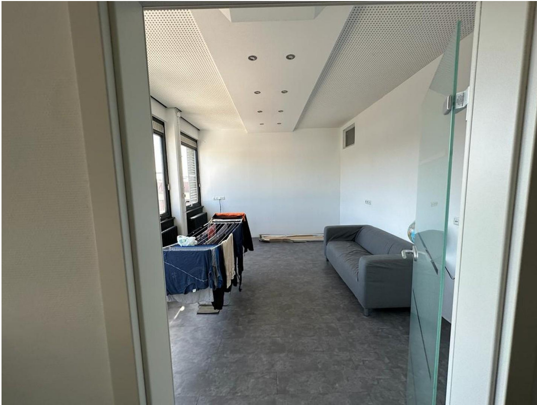
1. OG Büro