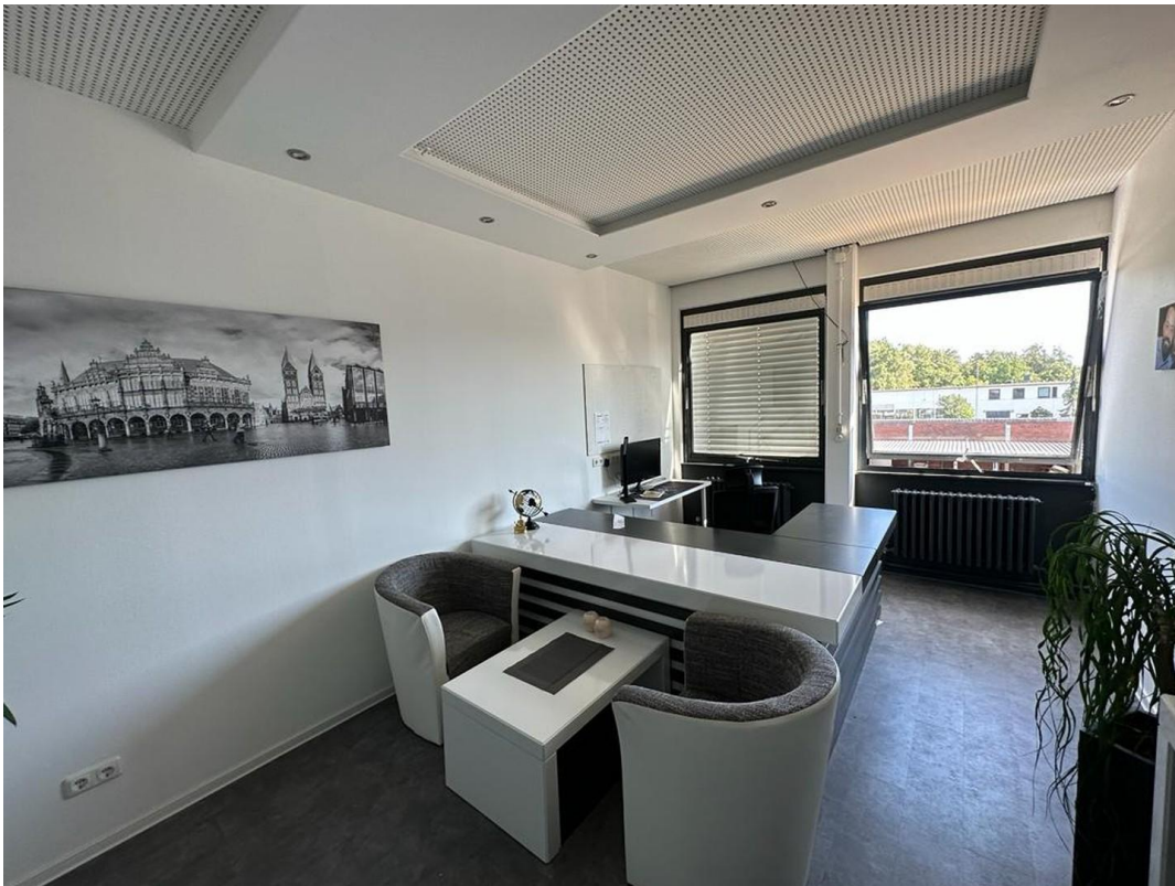
1. OG Büro