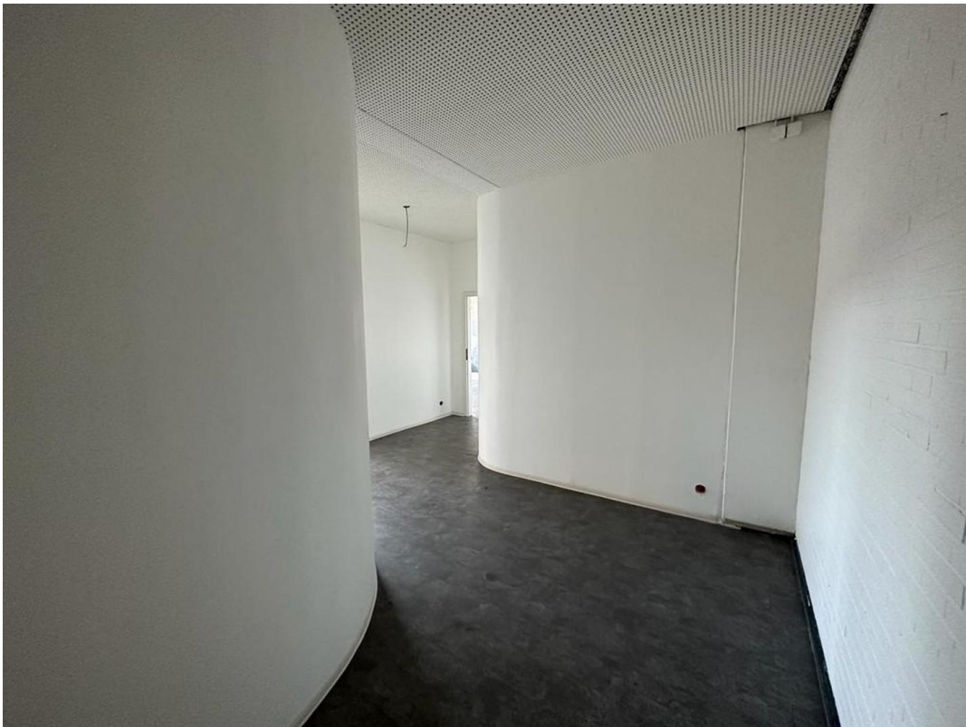
1. OG Büro