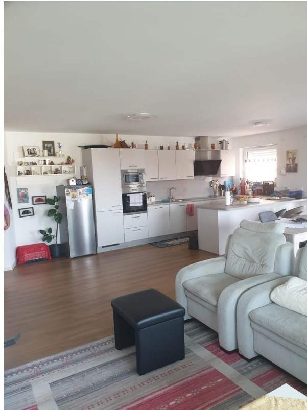
Küche (Sicht vom Wohnbereich)