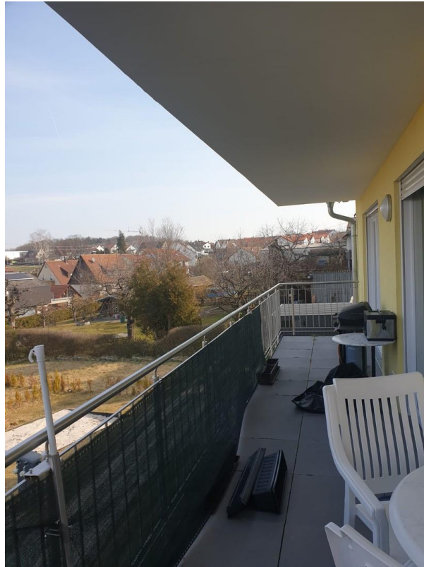
Balkon mit Zugang 3 Zugänge