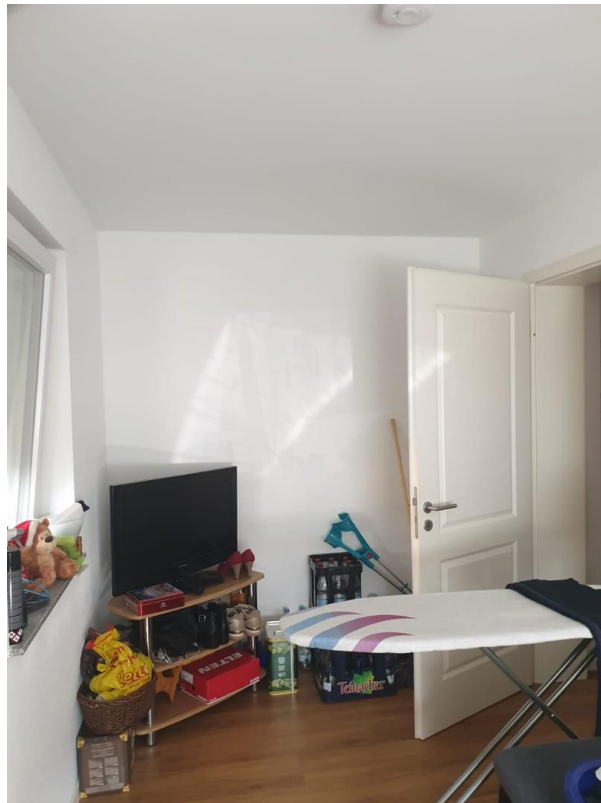
Arbeitszimmer oder Gästezimmer