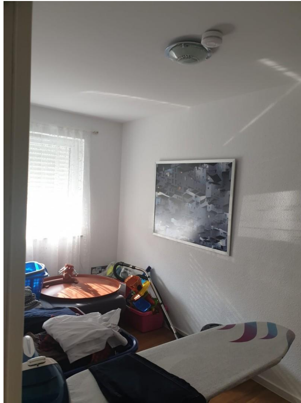
Arbeitszimmer oder Gästezimmer