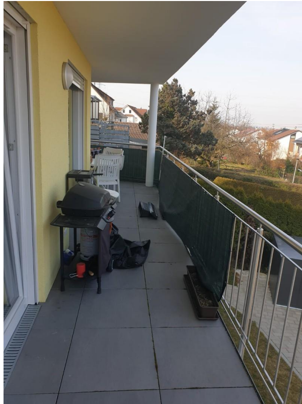
Balkon mit Zugang 3 Zugänge