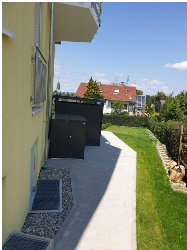
Zugang zum Garten