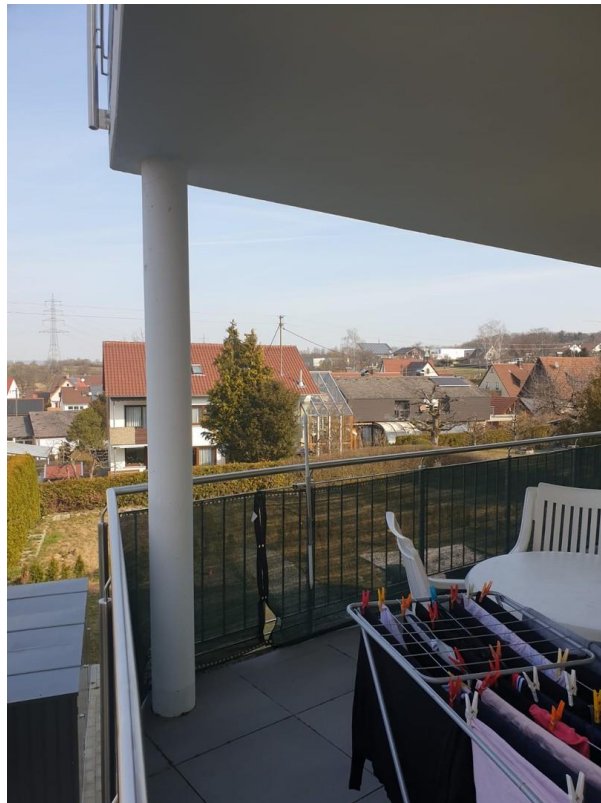
Balkon mit Zugang 3 Zugänge