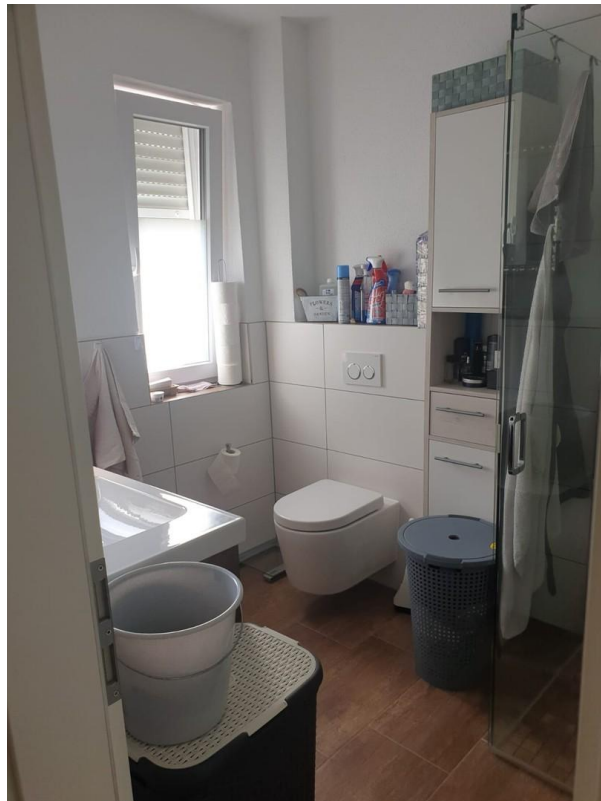
Duschbad mit WC