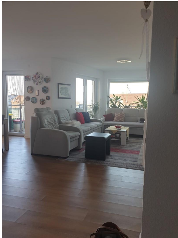
sehr heller Wohnbereich