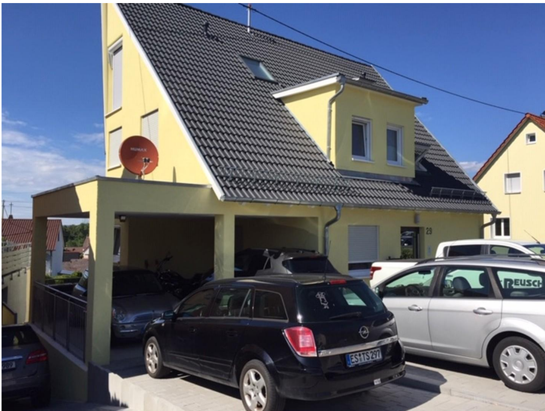
Carpot + Stellplatz