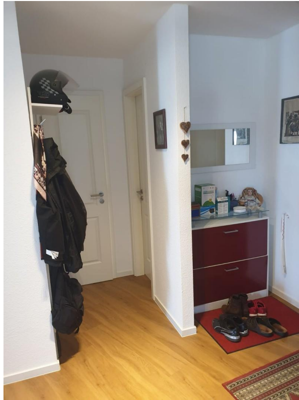
Diele und Garderobe