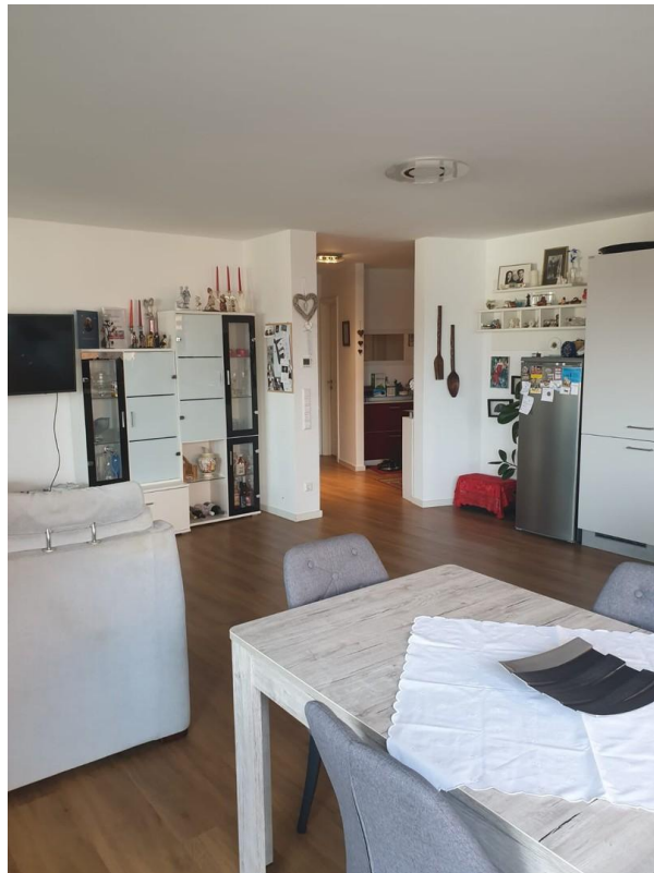
Sicht von der Essecke