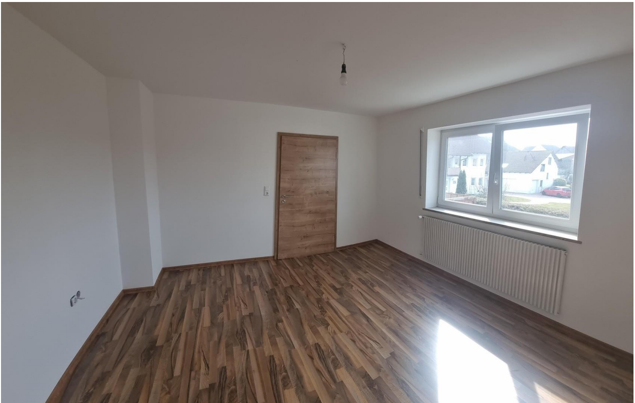
Schlafzimmer 1 16,48m 2