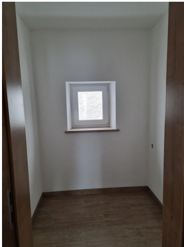
Speis 2,65m 2