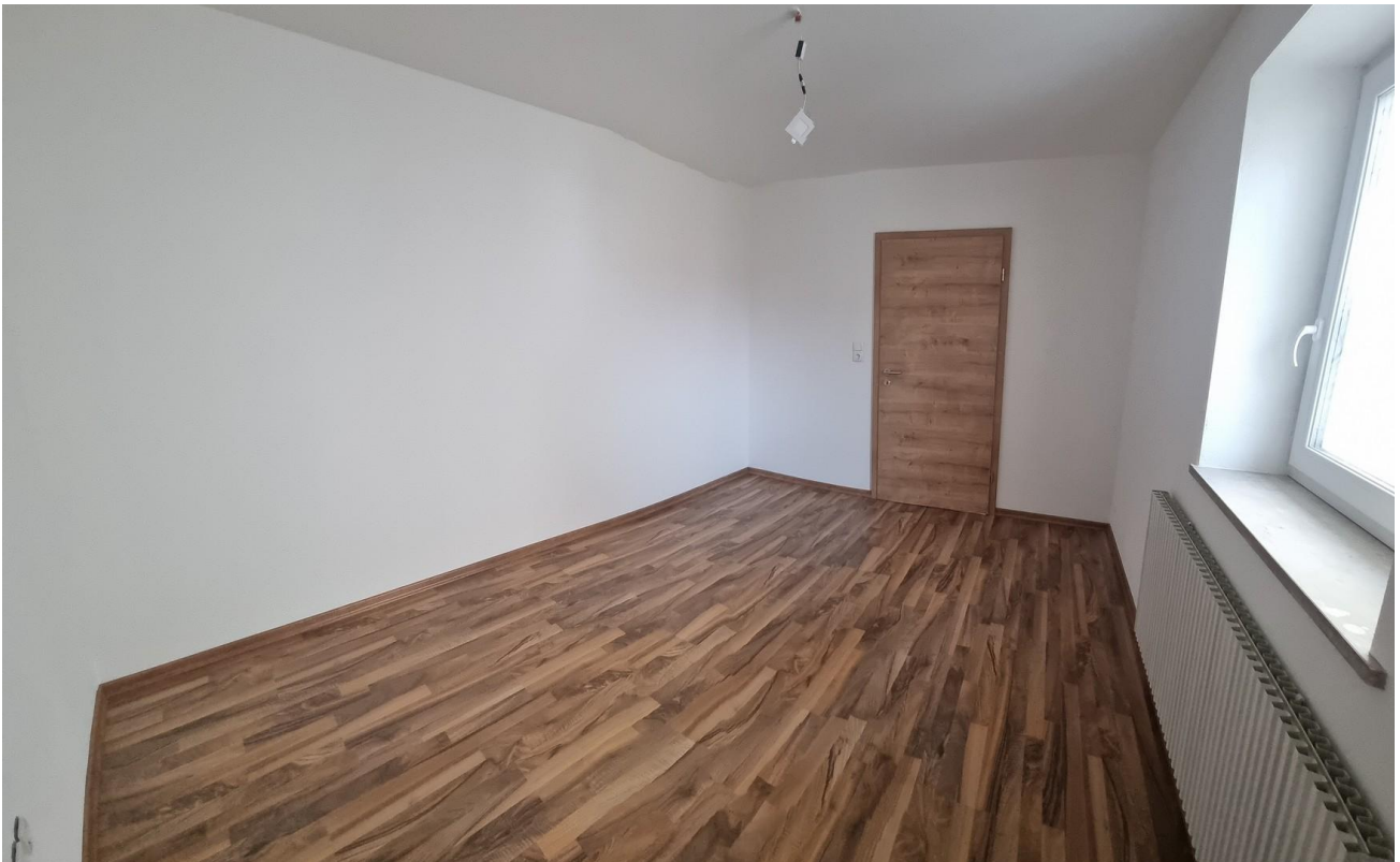
Kind 2 11,76m 2