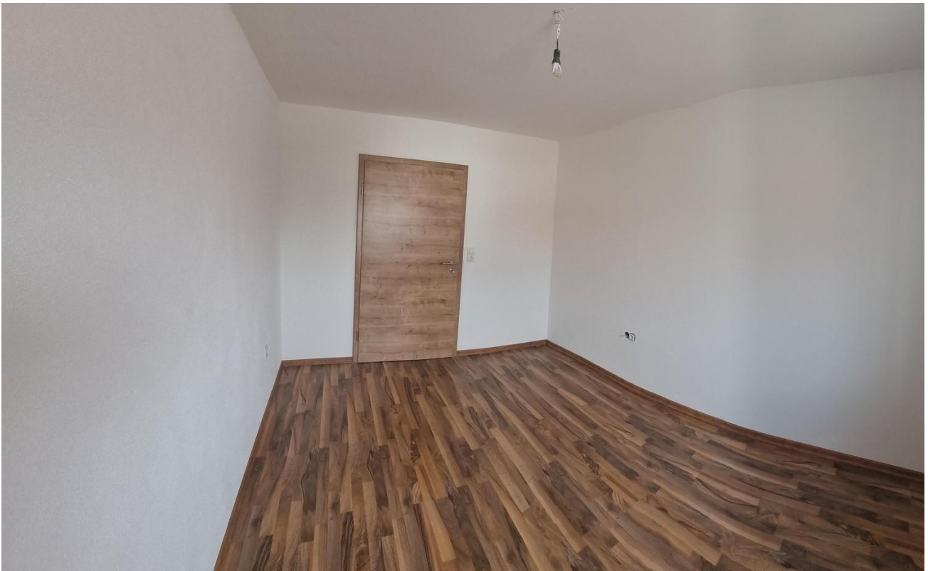
Kind 1 11,68m 2