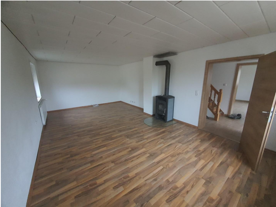
Wohnzimmer mit Schwedenofen