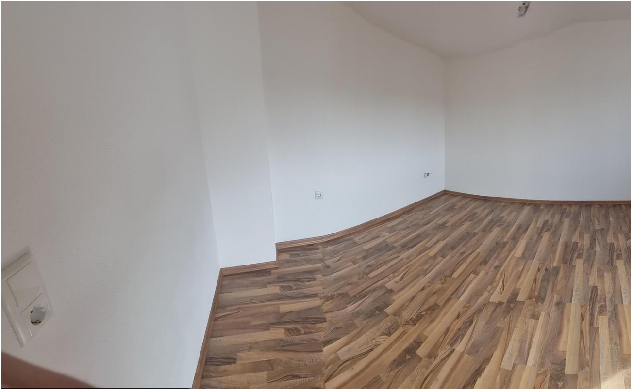
Kind 3 15,80m 2