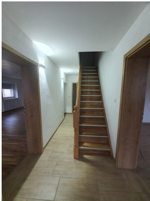
Treppe zum DG