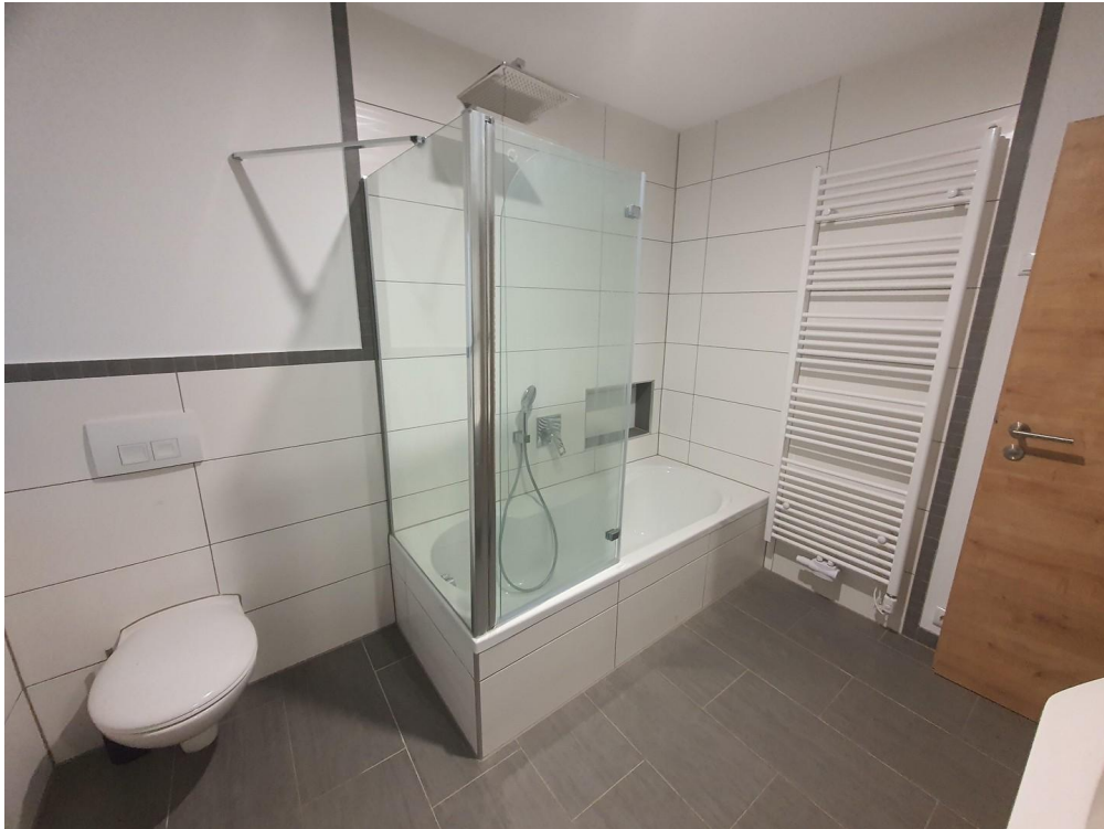
Bad Badewanne mit Dusche