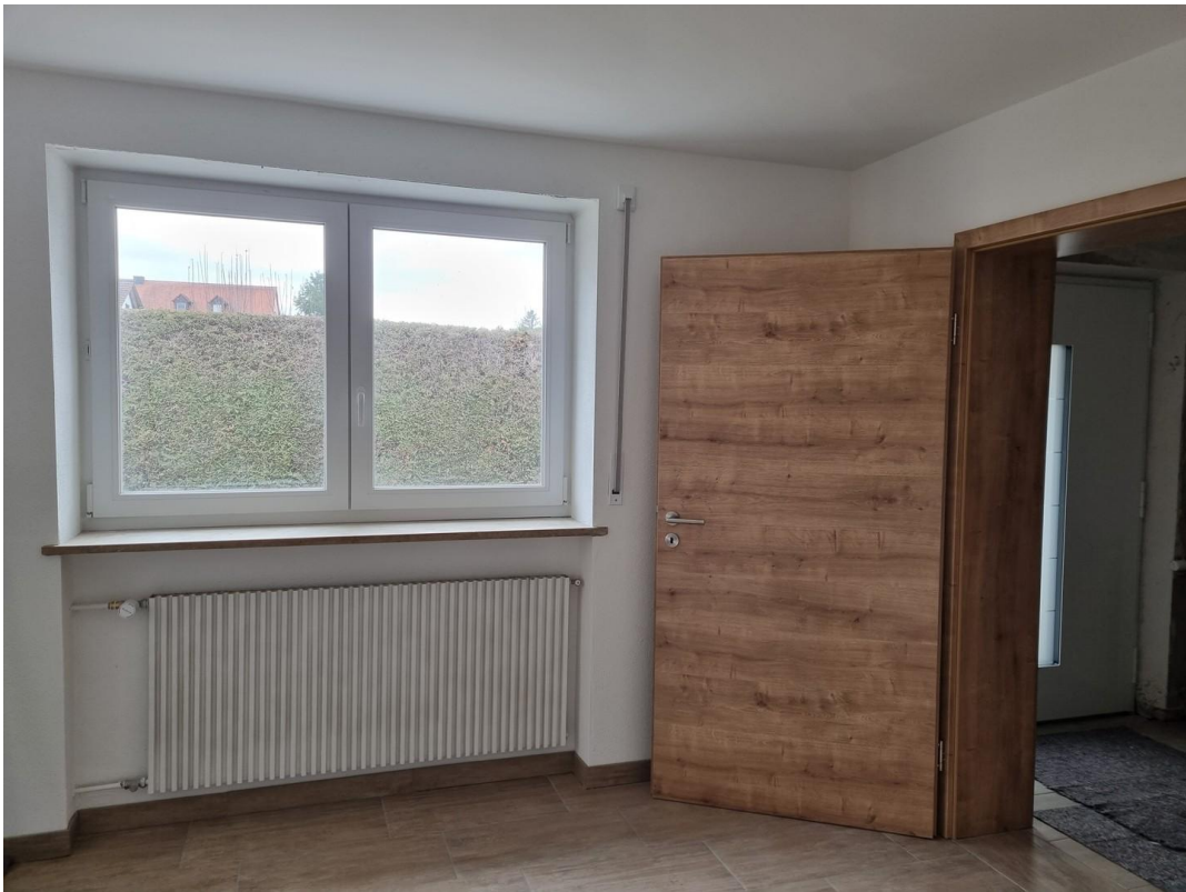
Küche/Esszimmer 15,25m 2