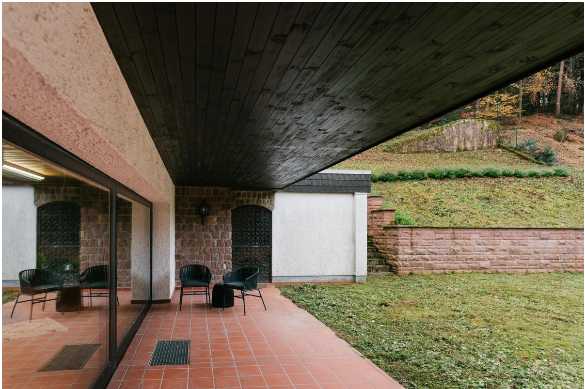
West-Terrasse im OG