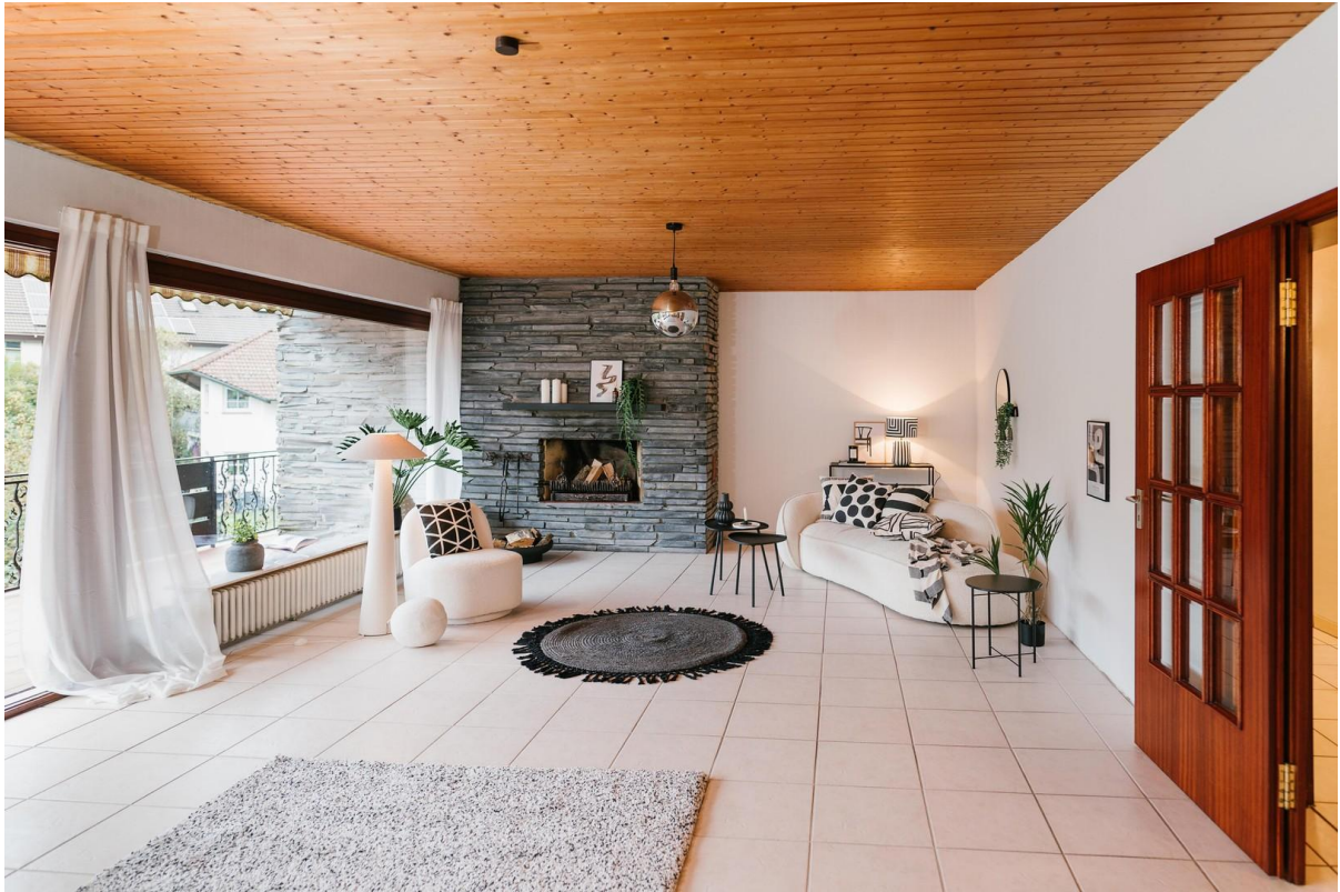
Wohnzimmer mit offenem Kamin