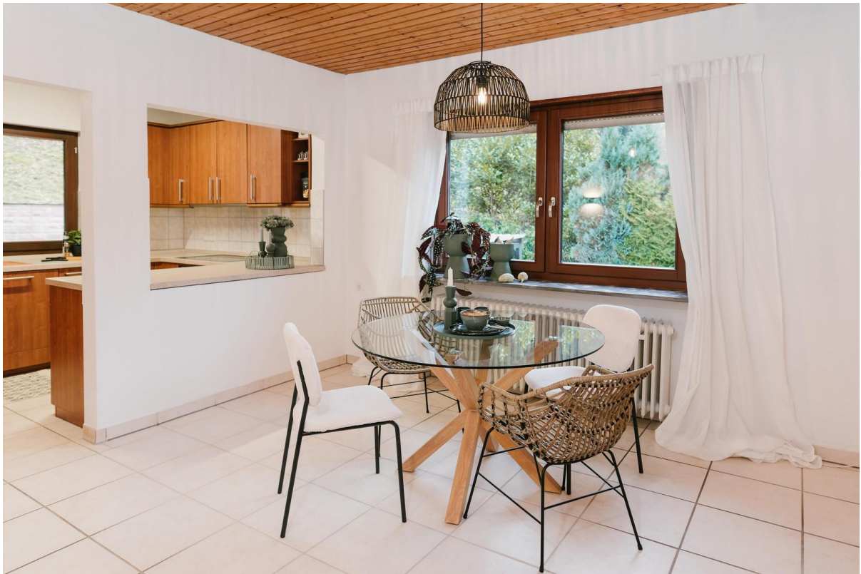
Küche mit Essecke im OG