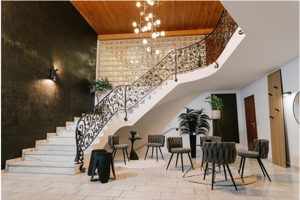
Aufgang OG mit Wartebereich