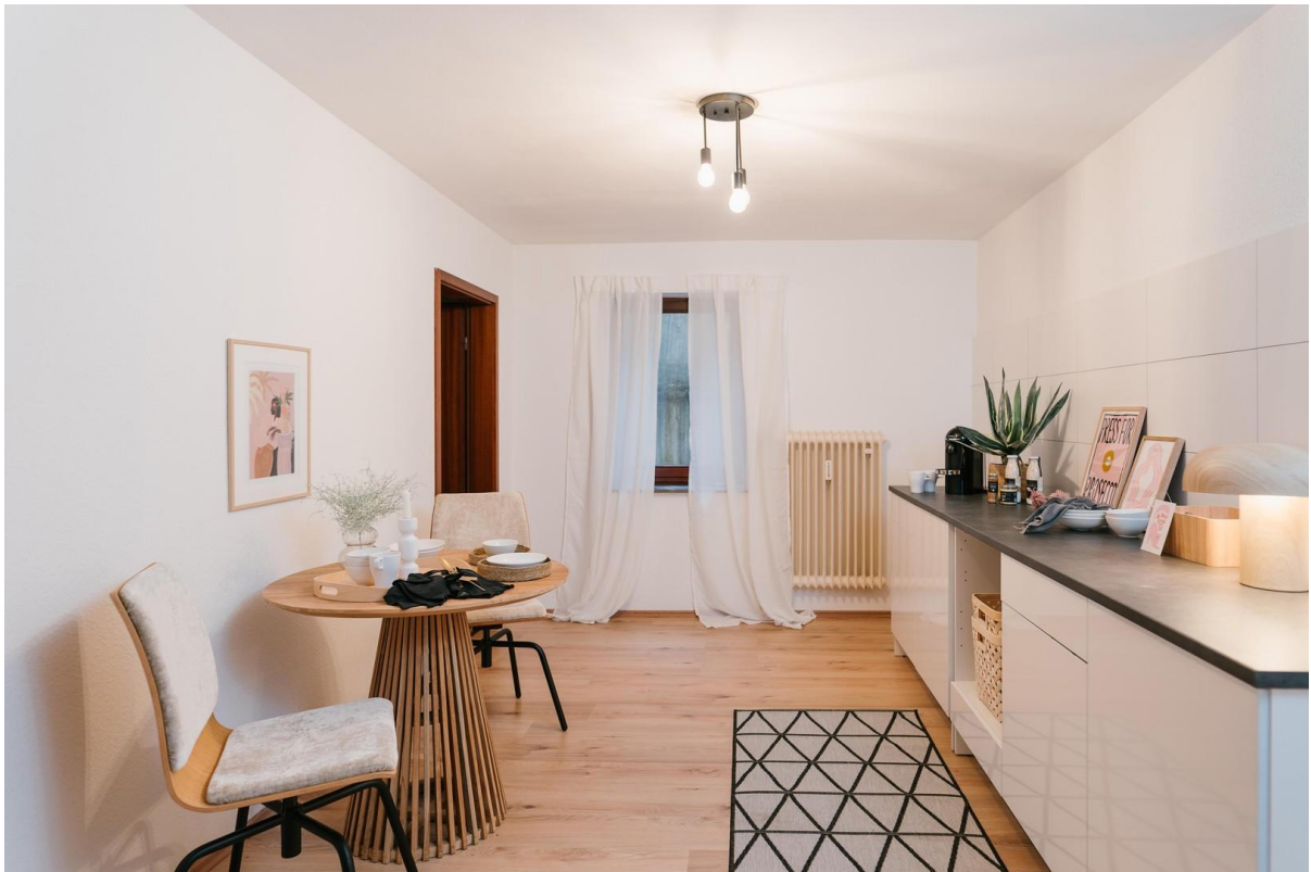
Teeküche im EG mit Archiv