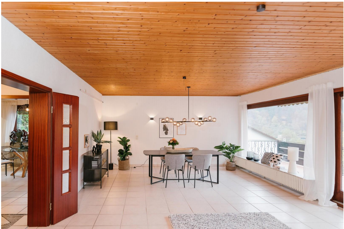
Esszimmer, Balkon mit Talblick