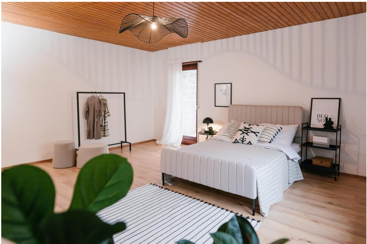
Schlafzimmer OG mit Balkon