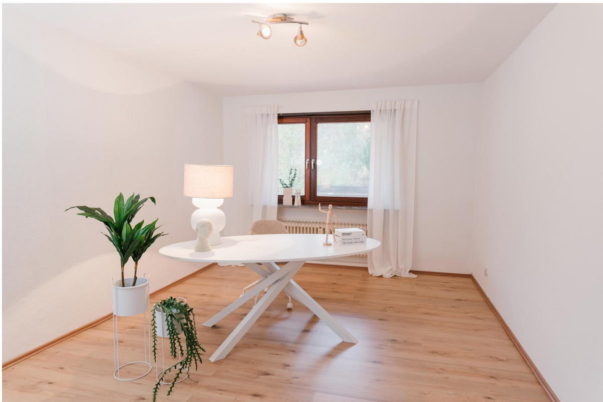
Büro im EG