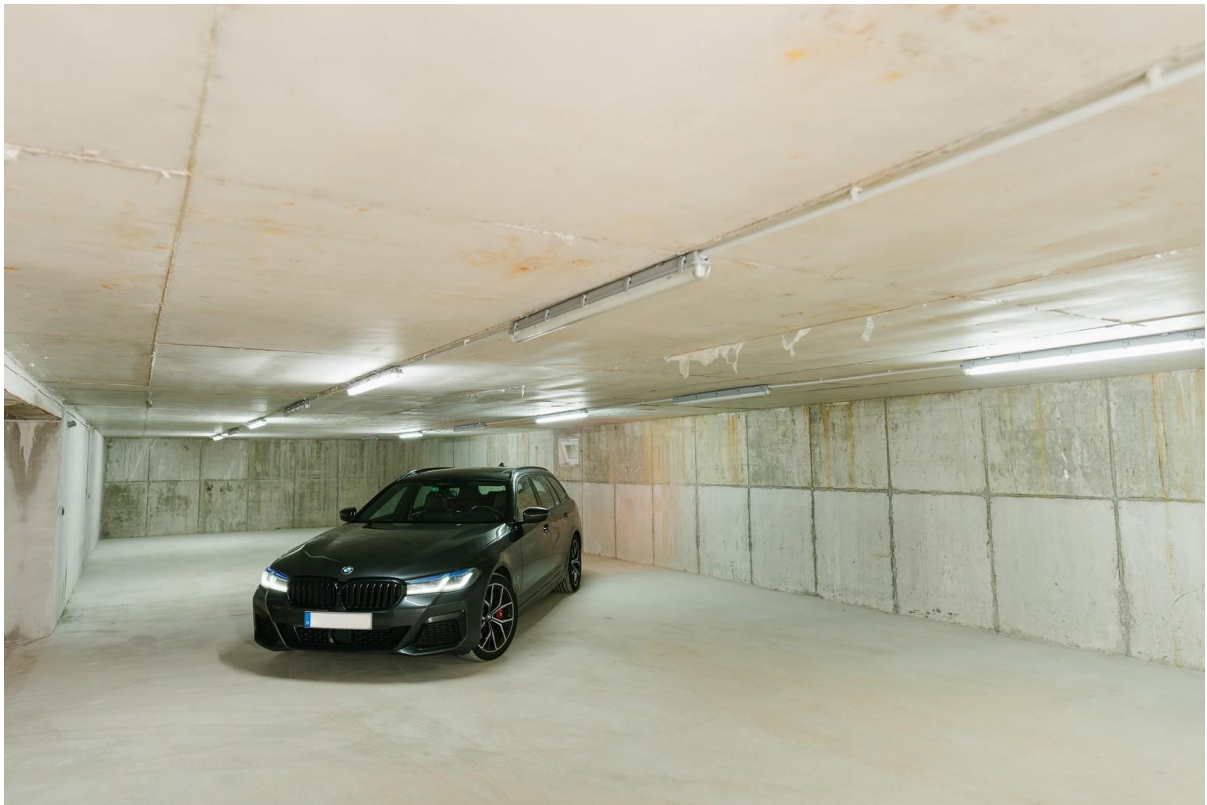
Tiefgarage / Lagerhalle