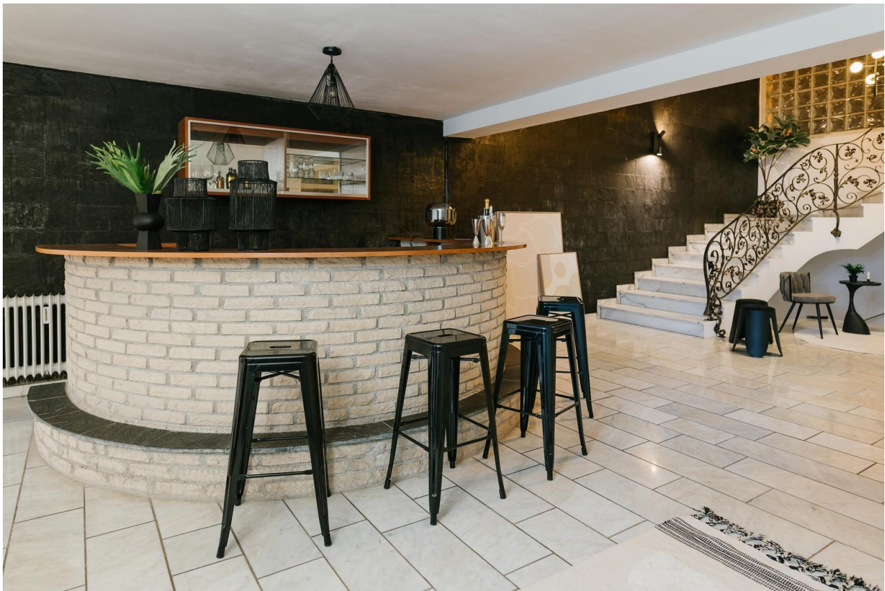
Bar in der Eingangshalle