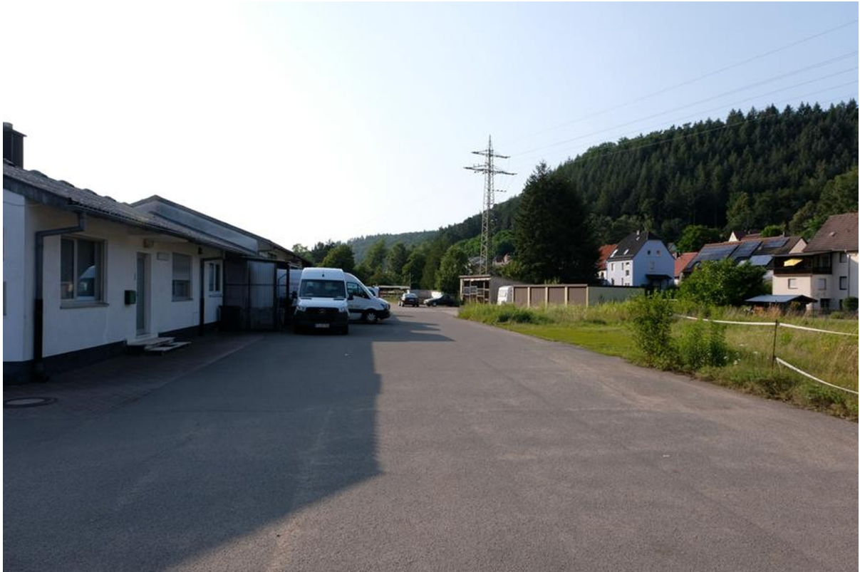
Gebäude Büro+Halle 300qm