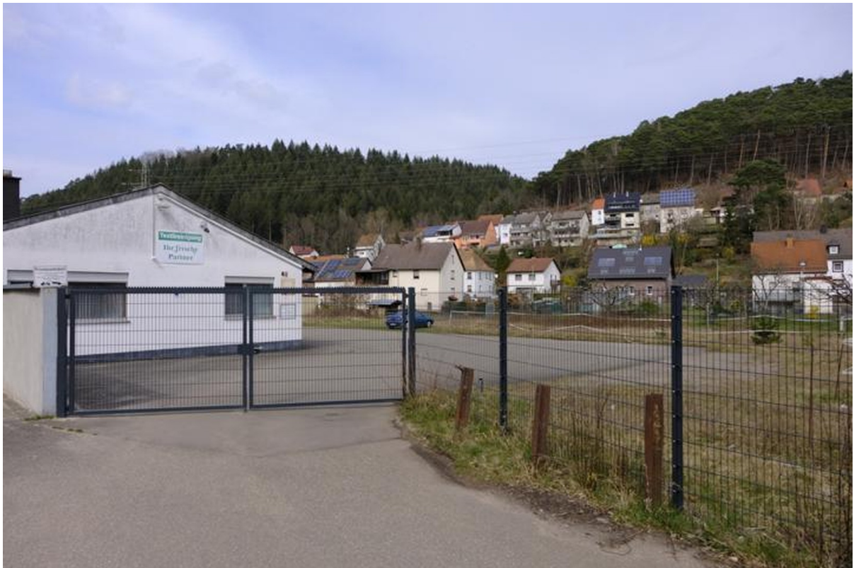
Einfahrt auf das Gelände