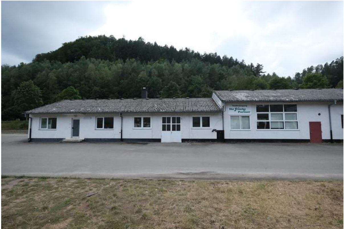
Gebäudeteil Büro mit Halle