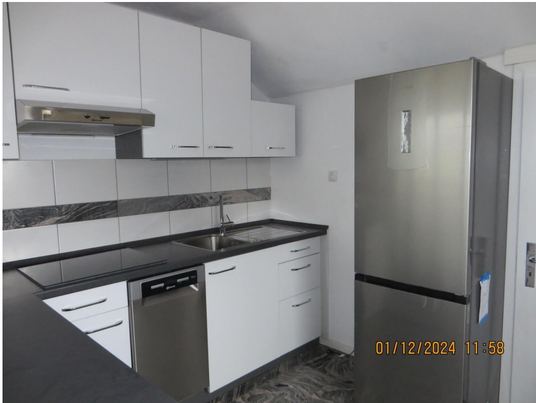
Küche mit Kühl-Gefrierschrank