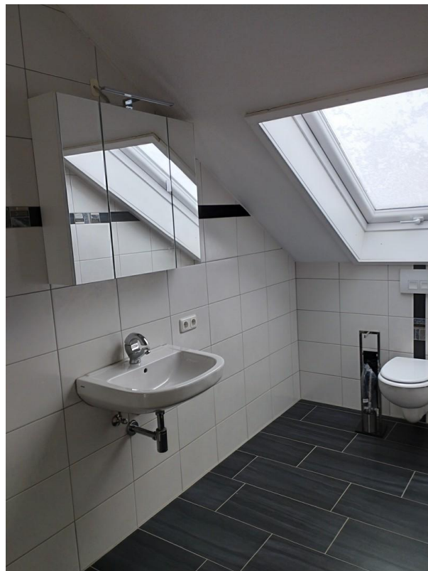
Bad mit Wanne, WC, Waschtisch