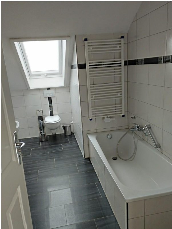
Bad mit Wanne, WC, Waschtisch