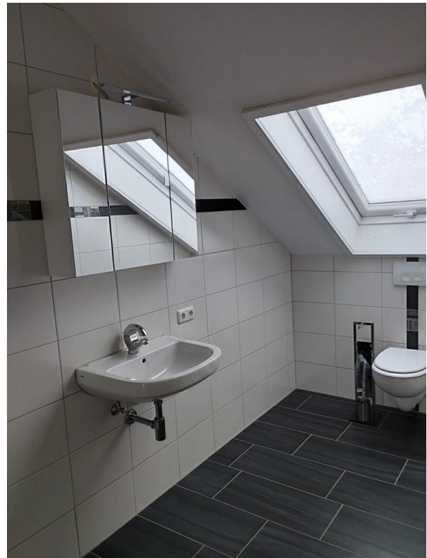
Bad mit Wanne, WC, Waschtisch