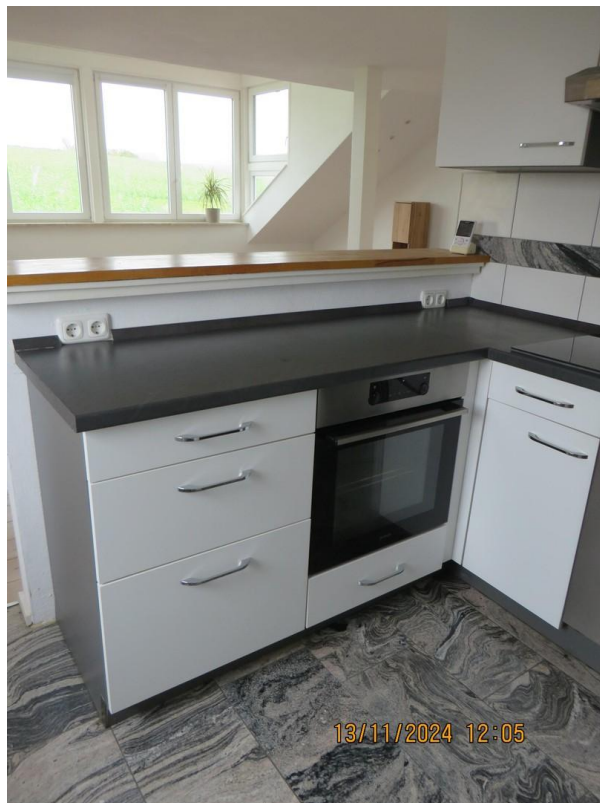
Blick ins Wohnzimmer