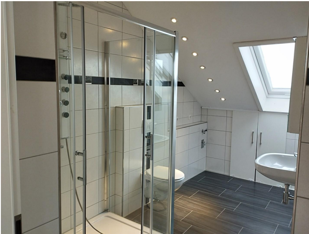
Dusche, WC WM Stellplatz