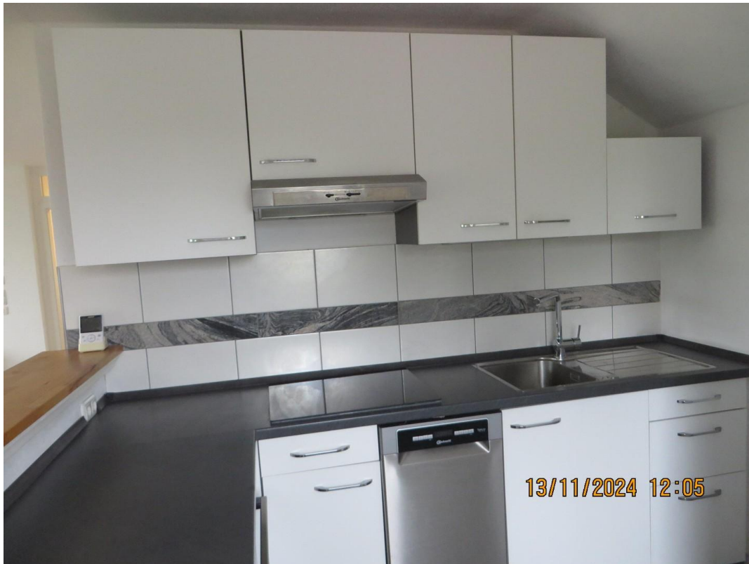
Küche von 2023 Nolte