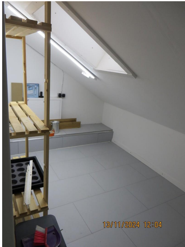
Abstellraum neben Küche