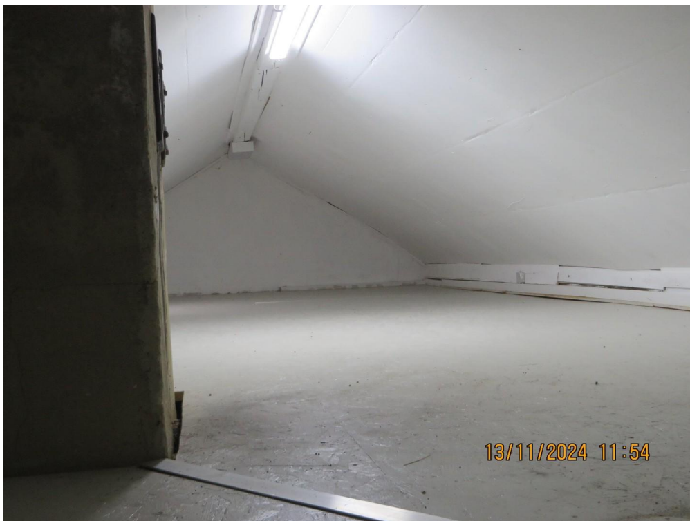
vollisolierter Dachboden 50 qm