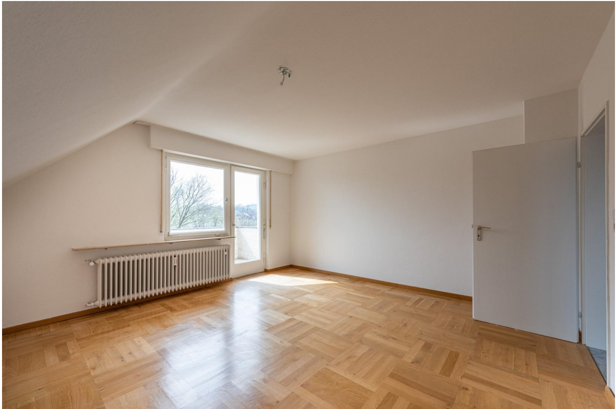
Schlafzimmer 1, Balkon