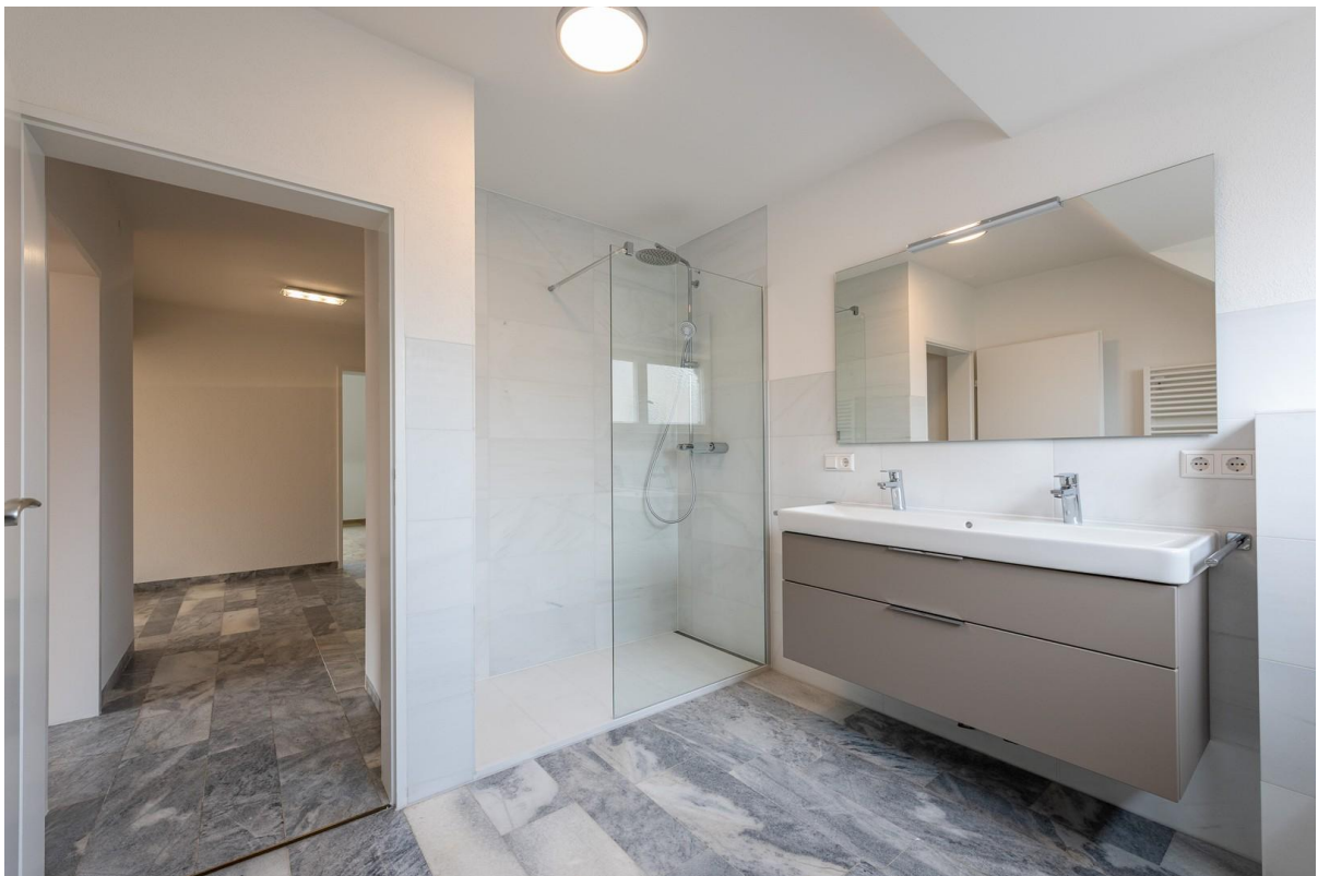
Renoviertes großes Bad