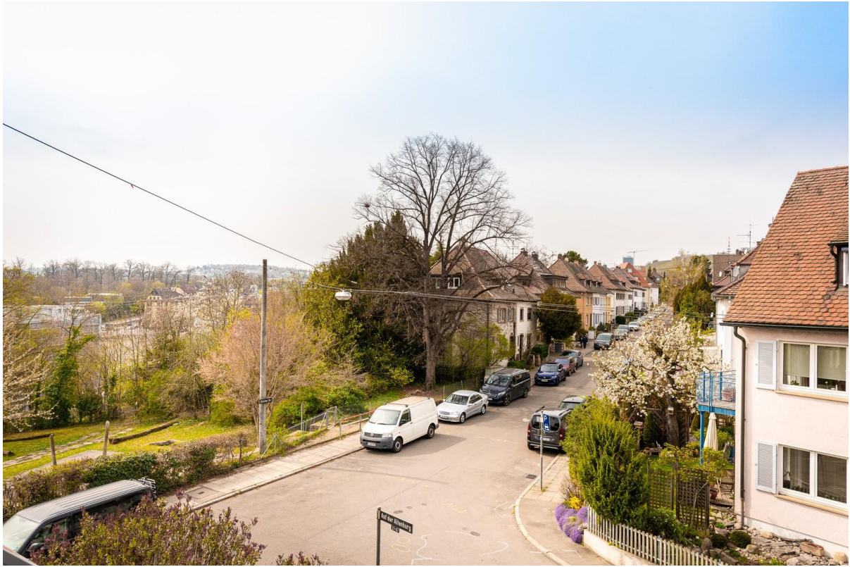
Ausblick zum Killesberg