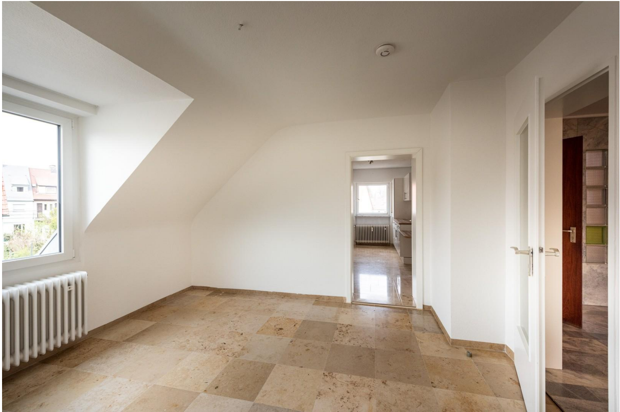
Esszimmer und Küche