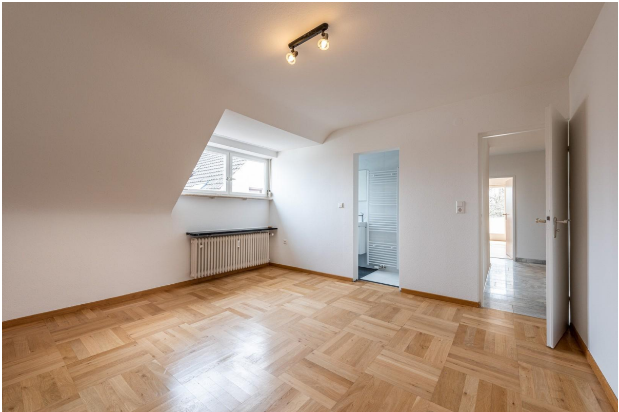
Schlafzimmer 2 inkl. Duschbad