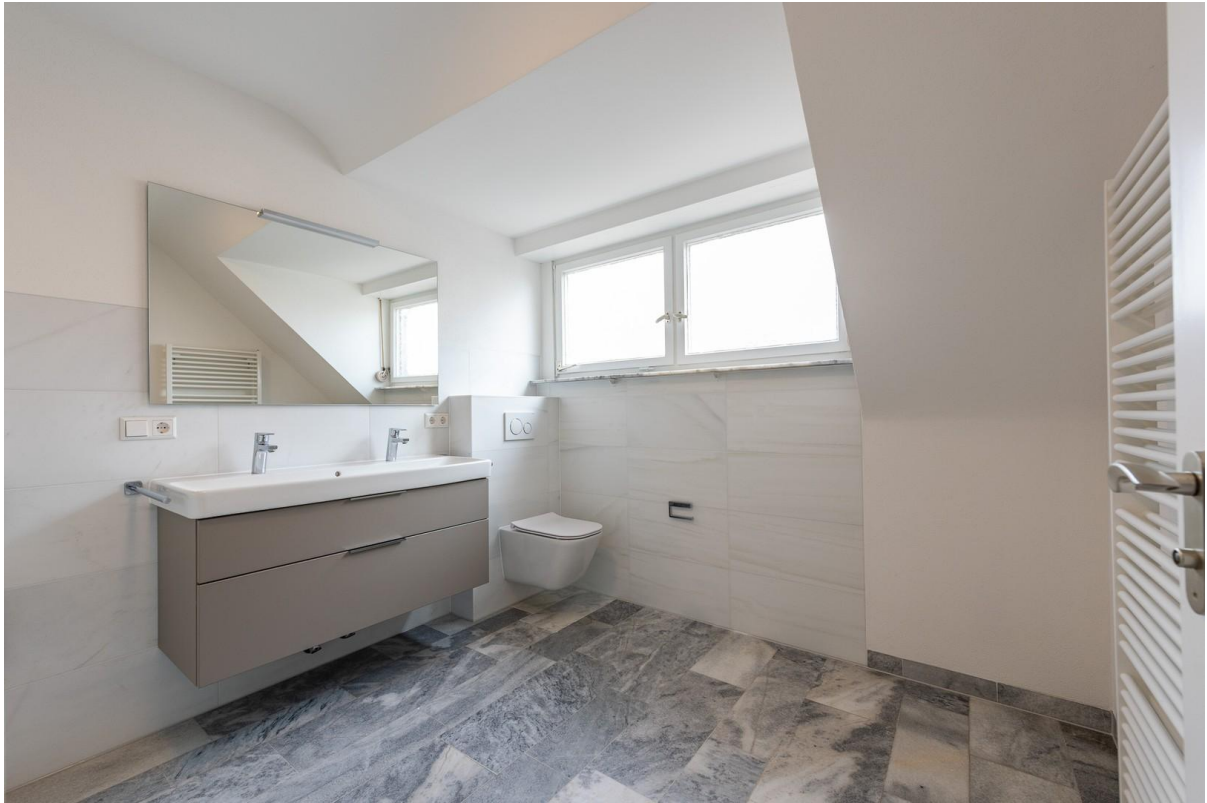
Renoviertes großes Bad