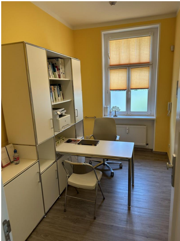
Ausstattungsbeispiel 2 von 3