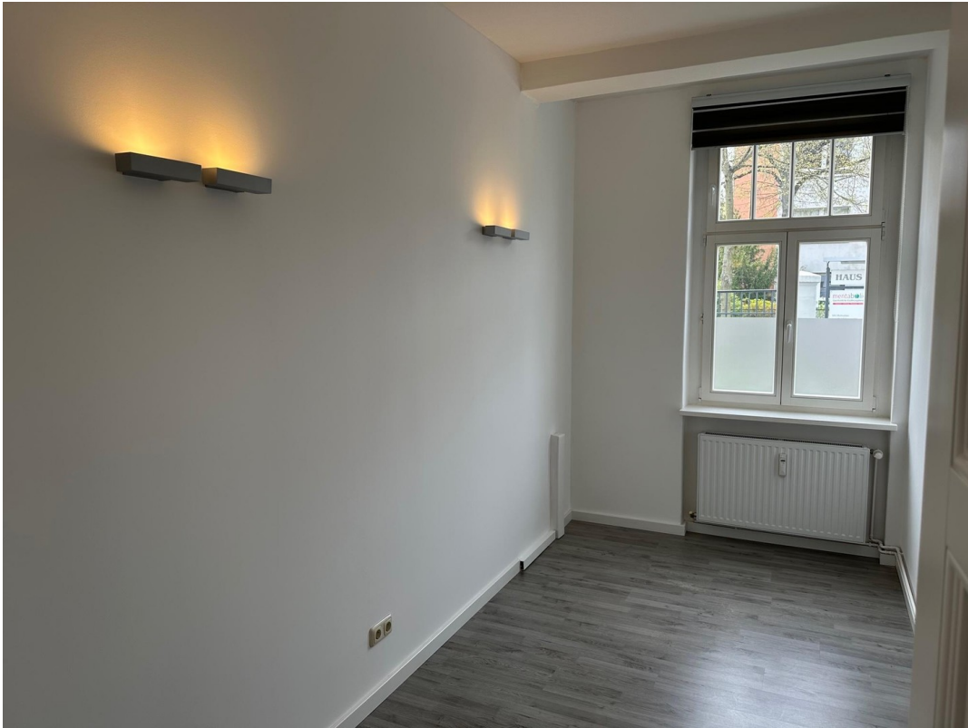
Büro 05 Blick zum Fenster