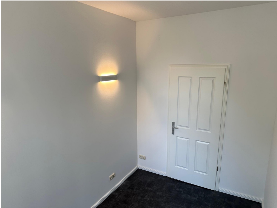
Büro 05 Blick zur Tür