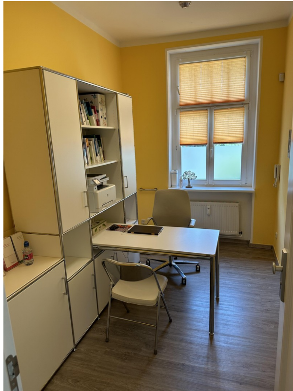
Ausstattungsbeispiel 2 von 3