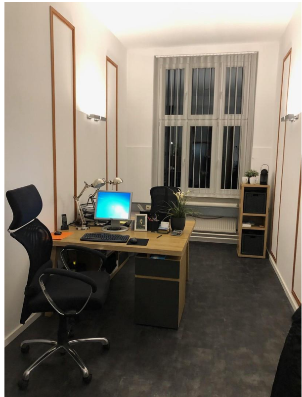
Ausstattungsbeispiel 3 von 3