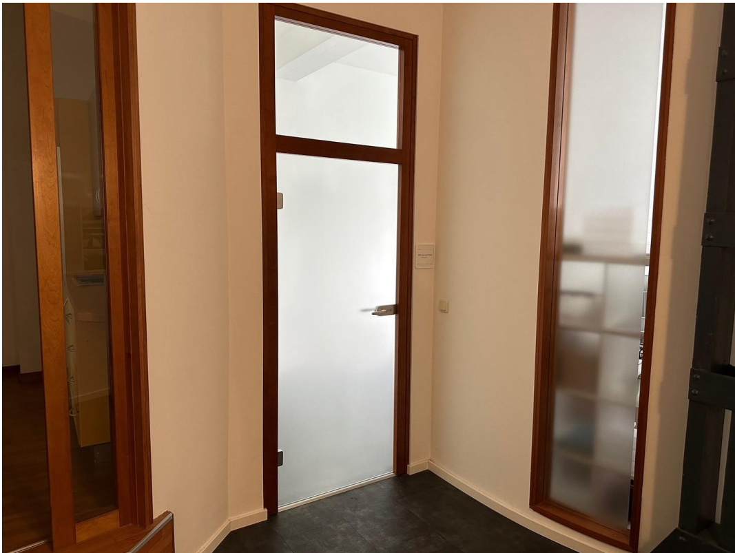
Eingang zum Büro