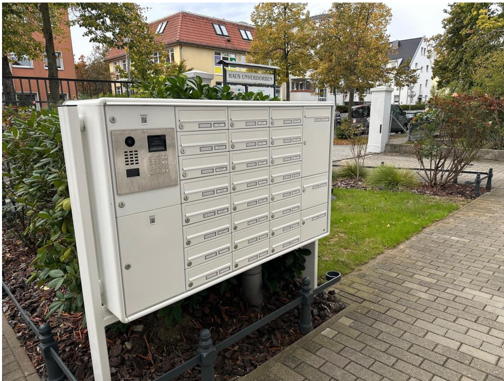
Briefkastenanlage - extra groß