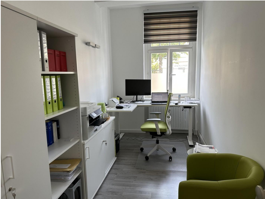
Ausstattungsbeispiel 1 von 3