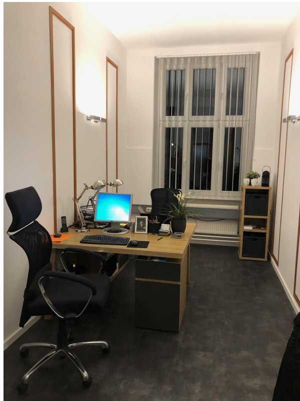
Ausstattungsbeispiel 3 von 3