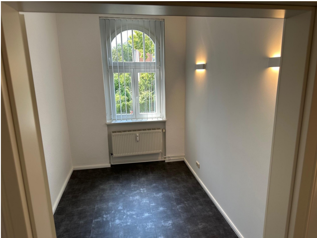
Büro 05 Blick in den Raum