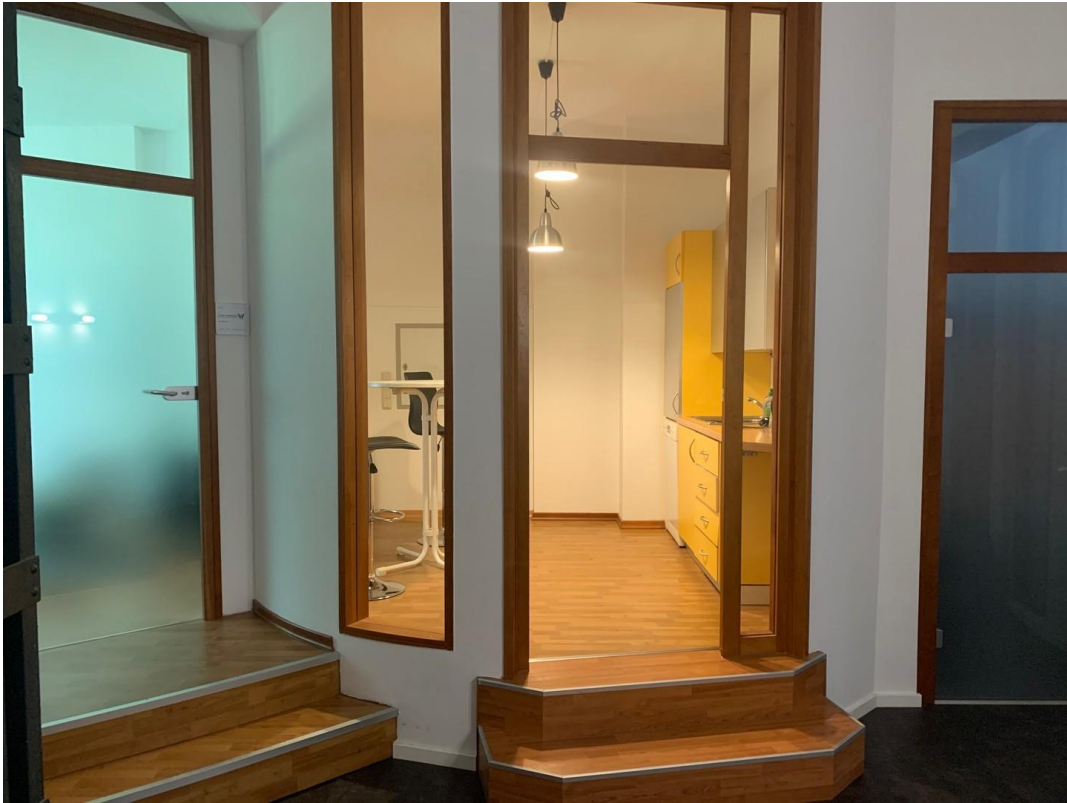
Flurblick zur Küche