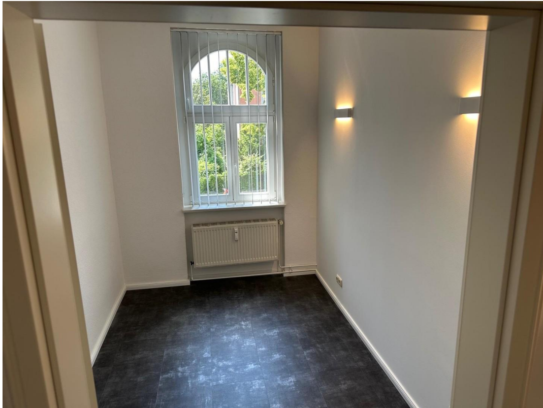
Büro 03 Blick in den Raum