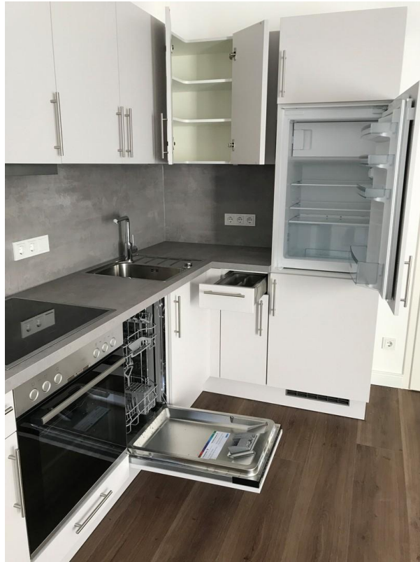
Küche mit Bosch-Markengeräten