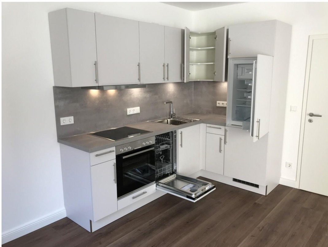
Küche mit hohen Schränken