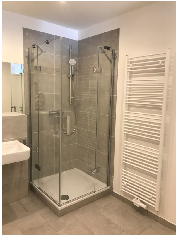
Dusche mit Glasabtrennung