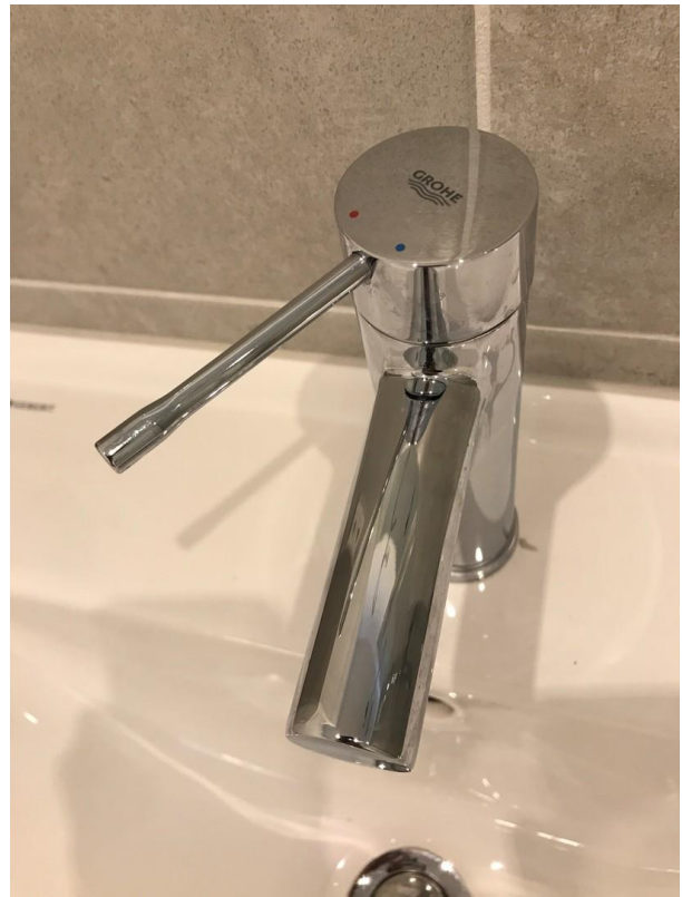
Grohe Armaturen Bad und Küche