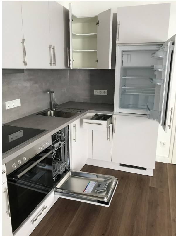
Küche mit Bosch-Markengeräten