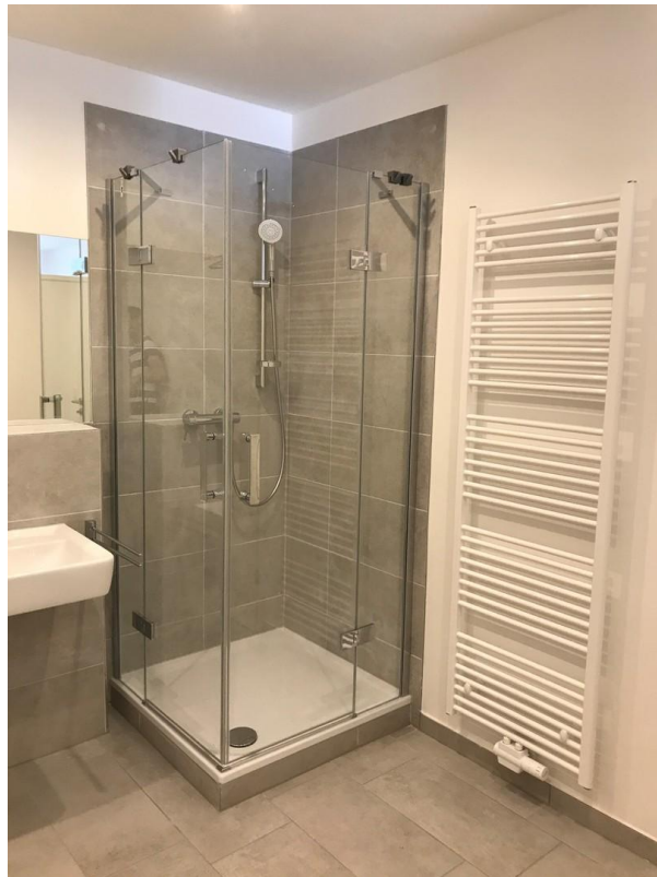
Dusche mit Glasabtrennung