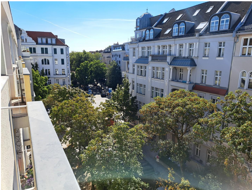
Südbalkon Blick 1