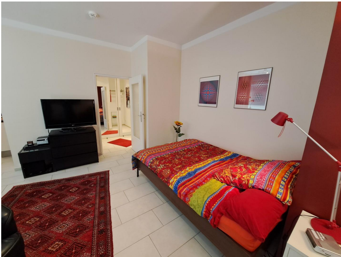
Blick zum Flur