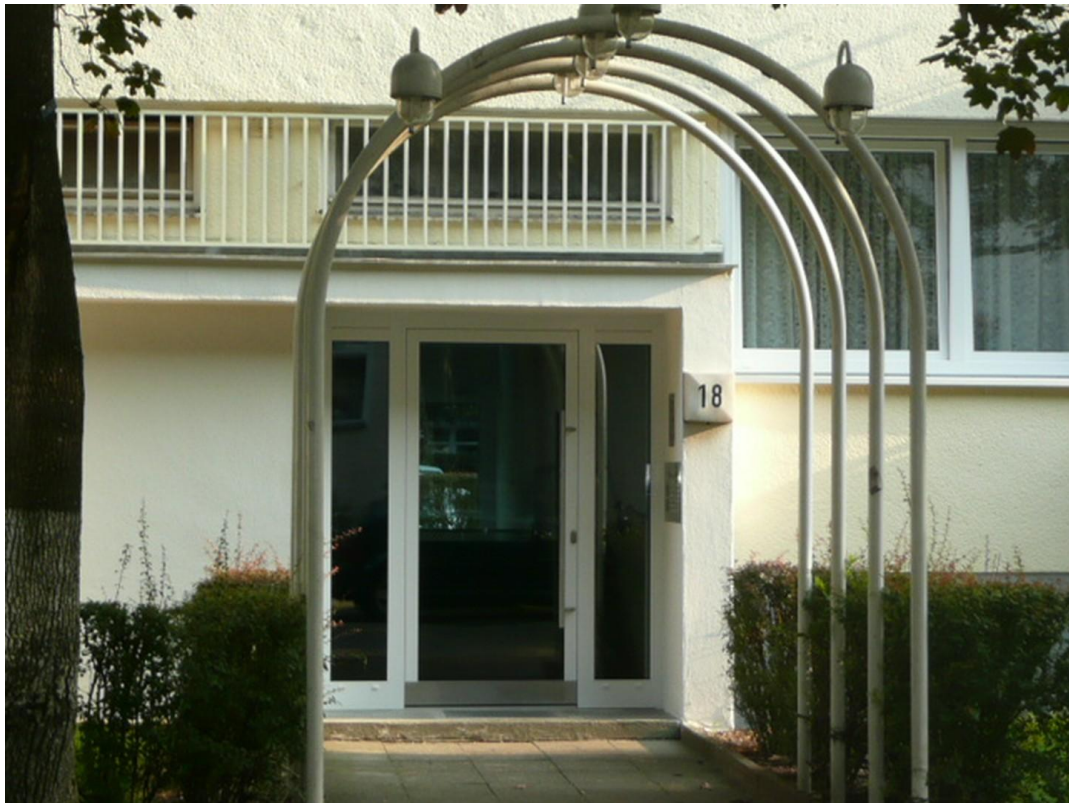
Eingang Zähringerstr. 18