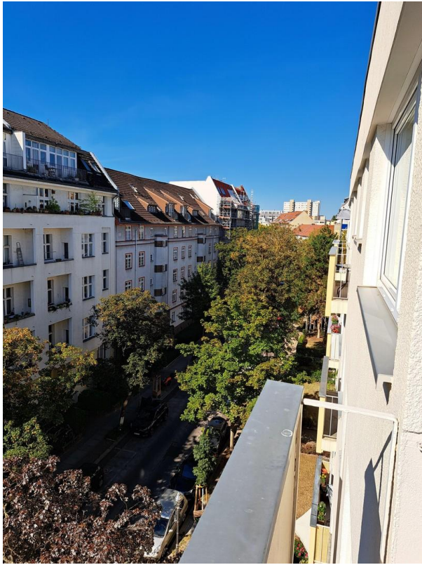
Südbalkon Blick 2