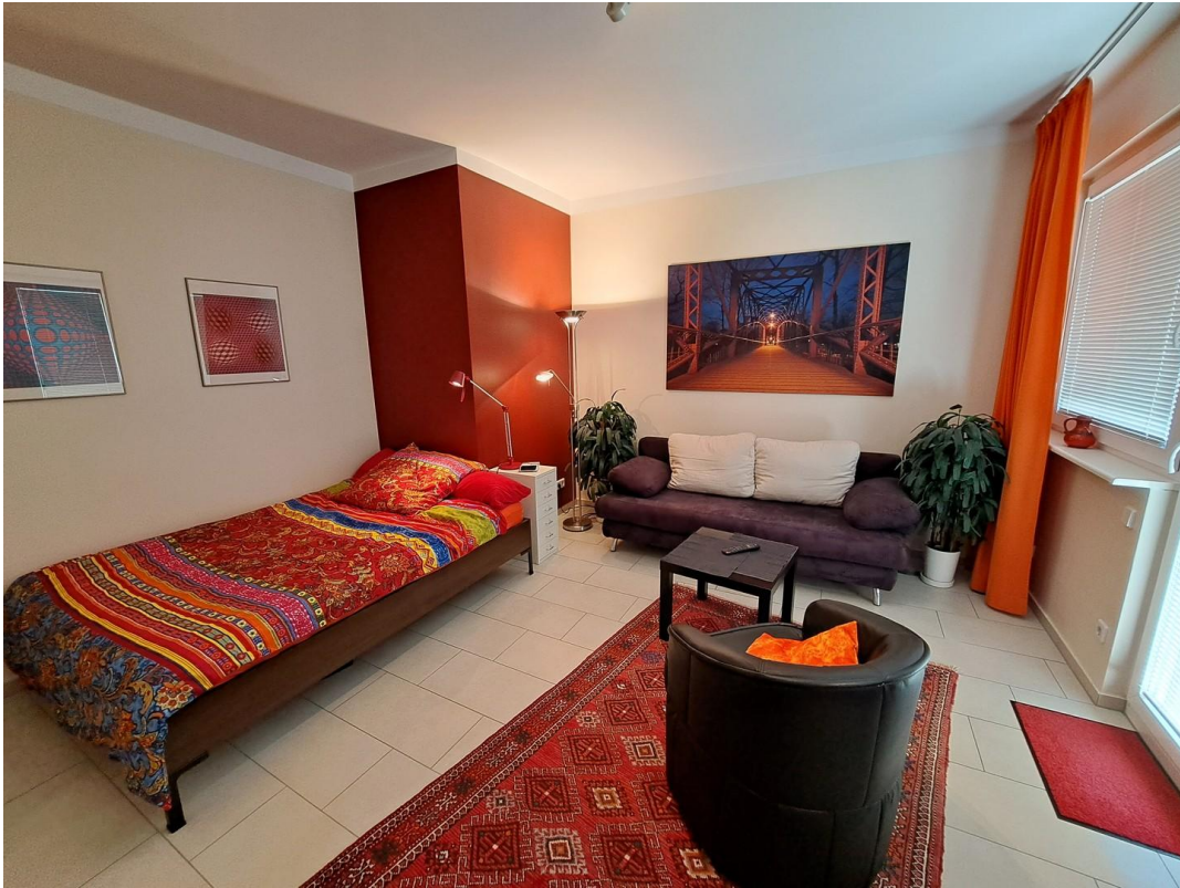
Bett 1,40x2,00 m + Gästecouch