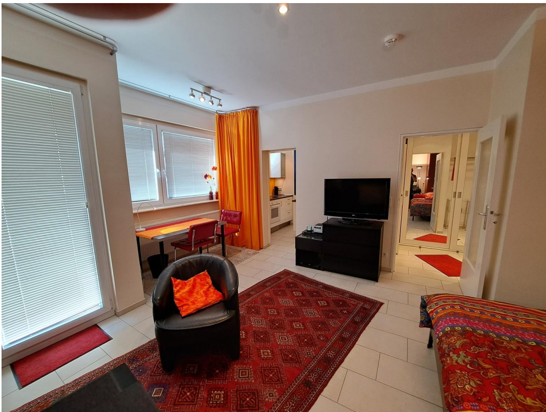
Blick zum Tisch und zur Küche