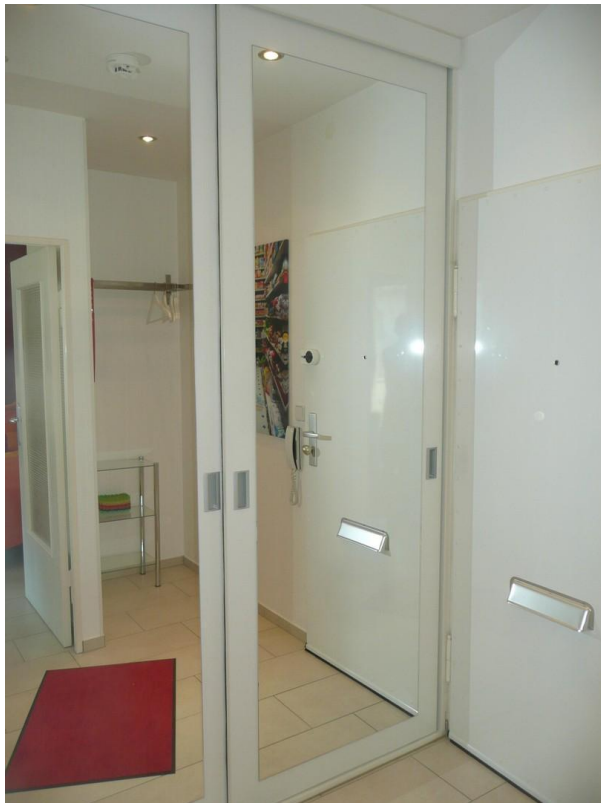
Großer Wandschrank mit Spiegel