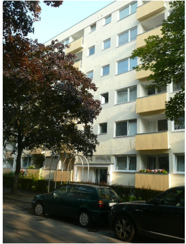
Haus Zähringerstr. 18