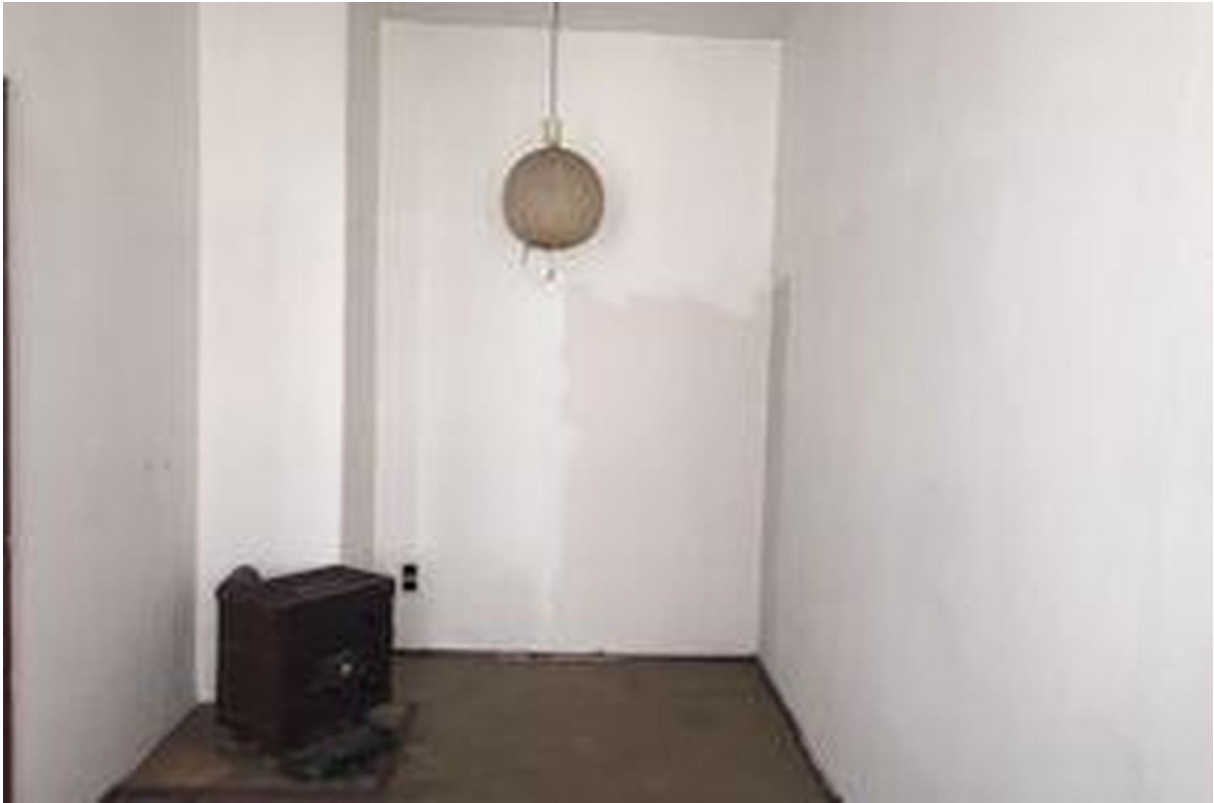
1-ten Stock- Raum