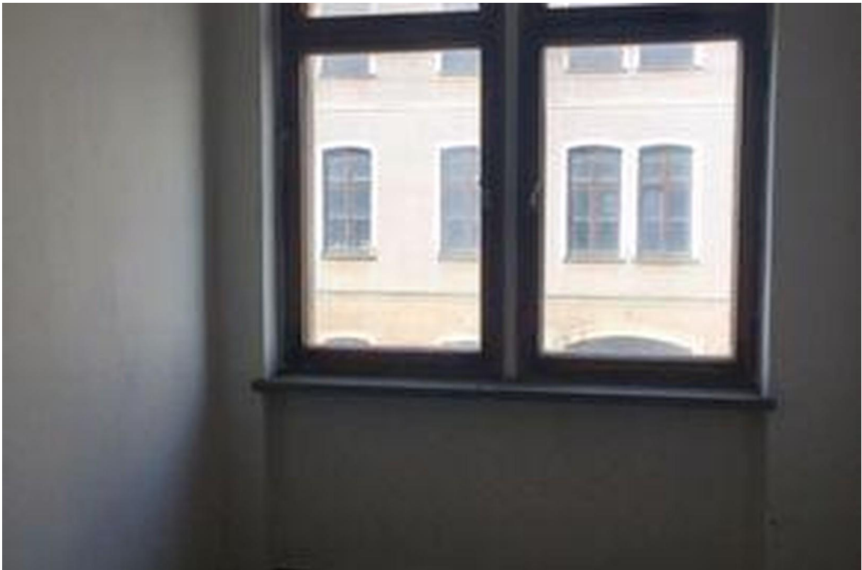
1-ten Stock- Raum