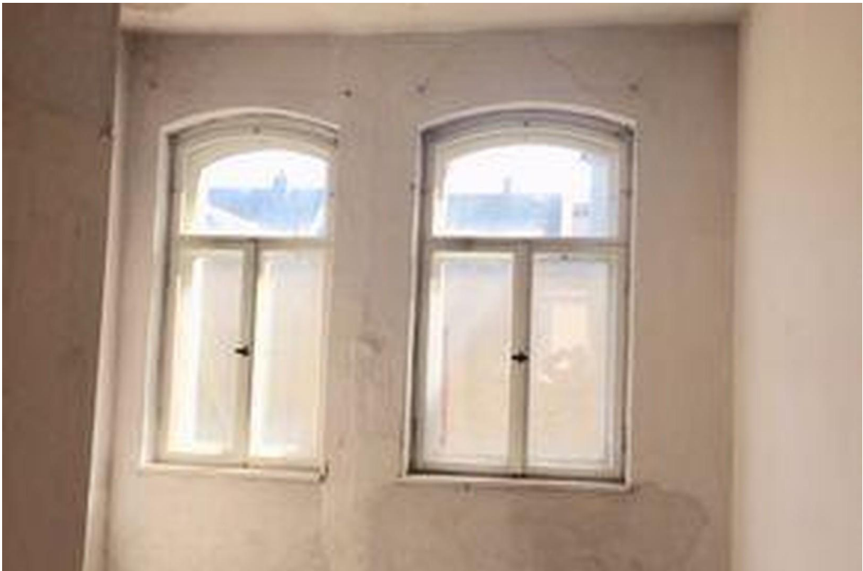
1-ten Stock- Raum