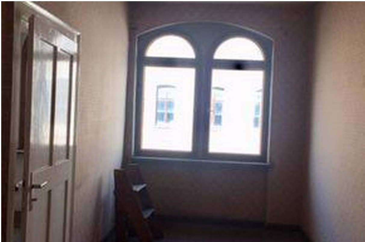
1-ten Stock- Raum