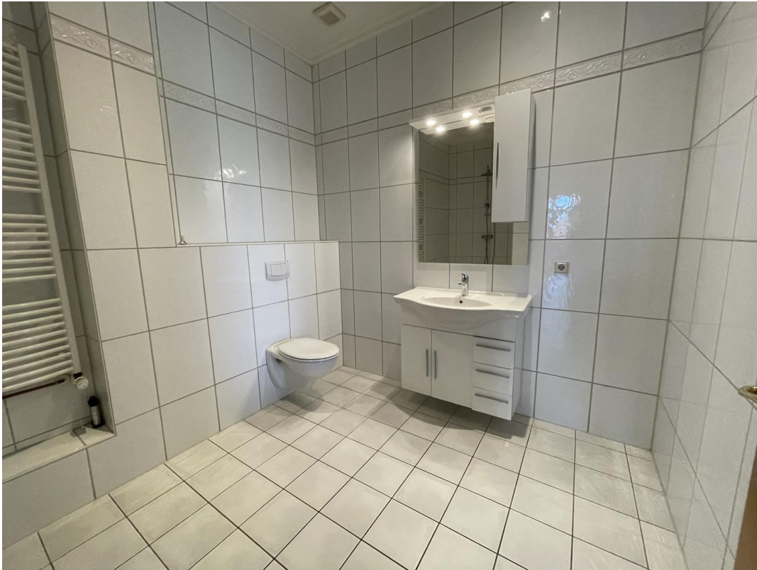
2. Bad mit Dusche