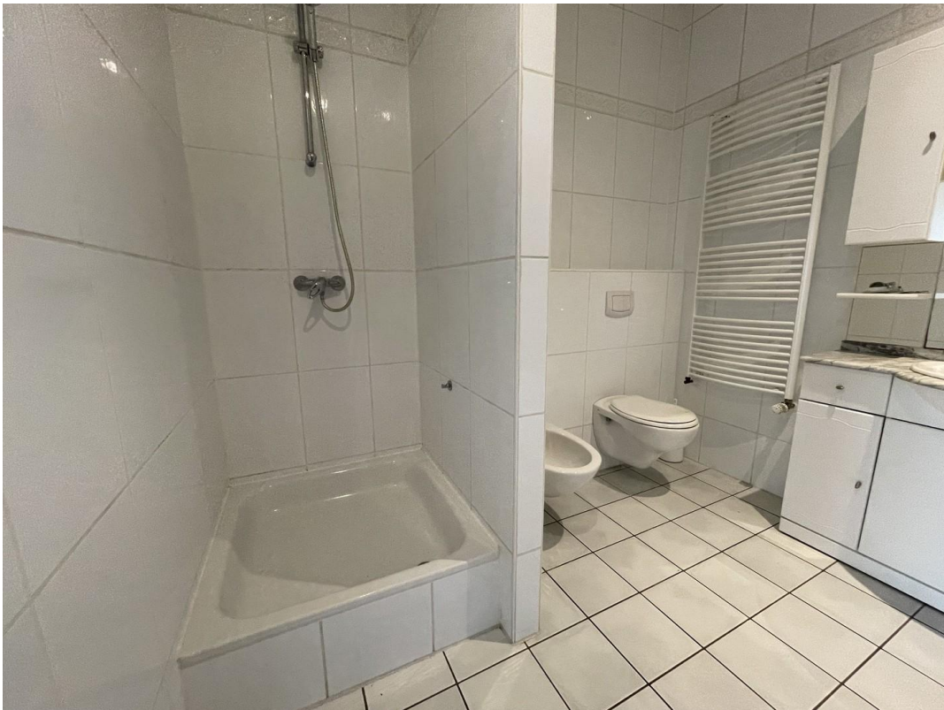
1. Bad mit Dusche u. Wanne