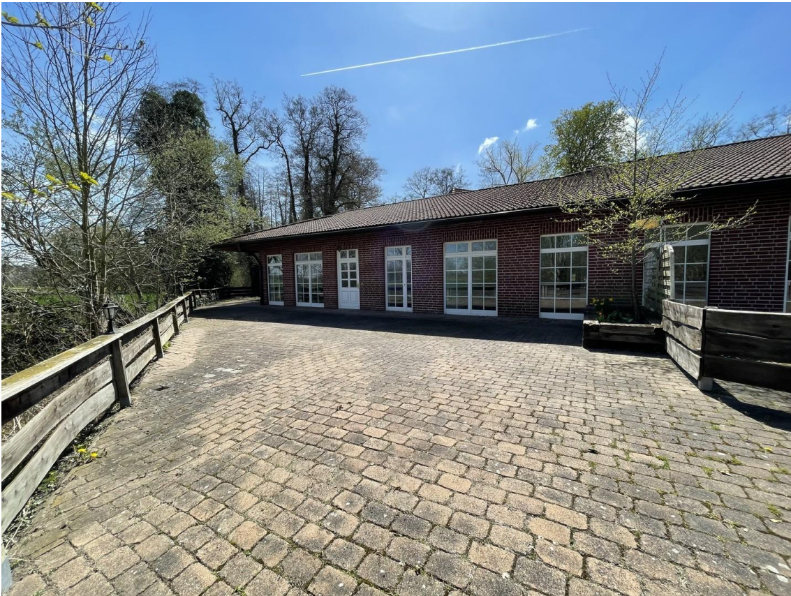
Terrasse mit Zugang