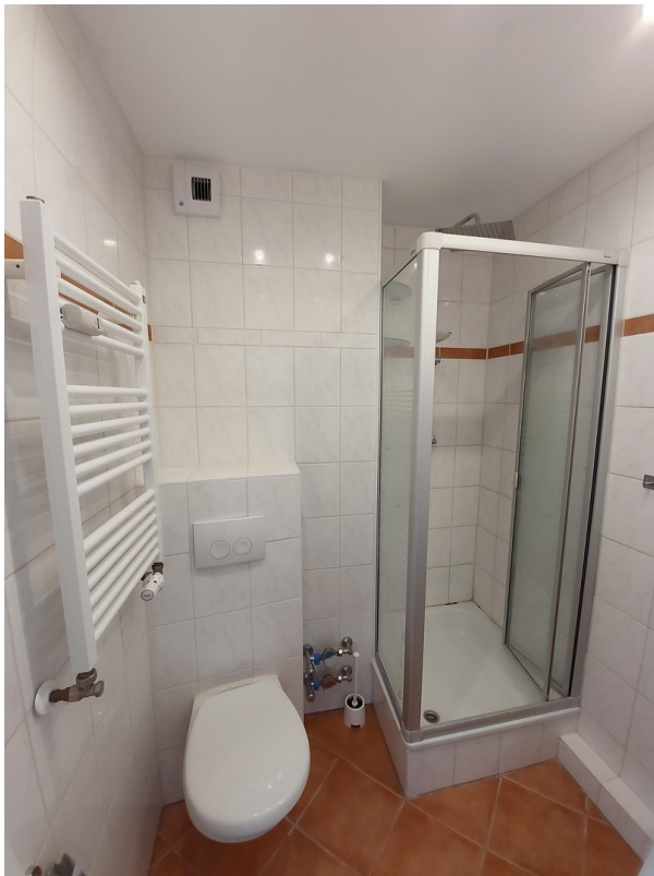
Badezimmer mit Spots