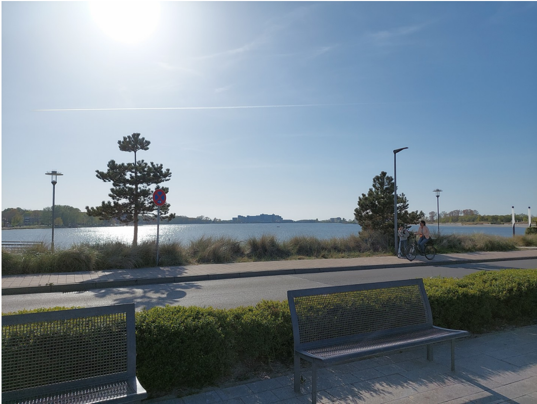
Blick auf den Ferienpark