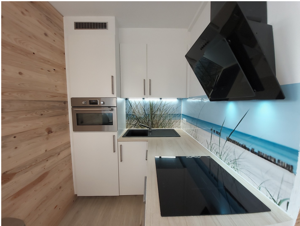
Hochwertige IKEA Einbauküche