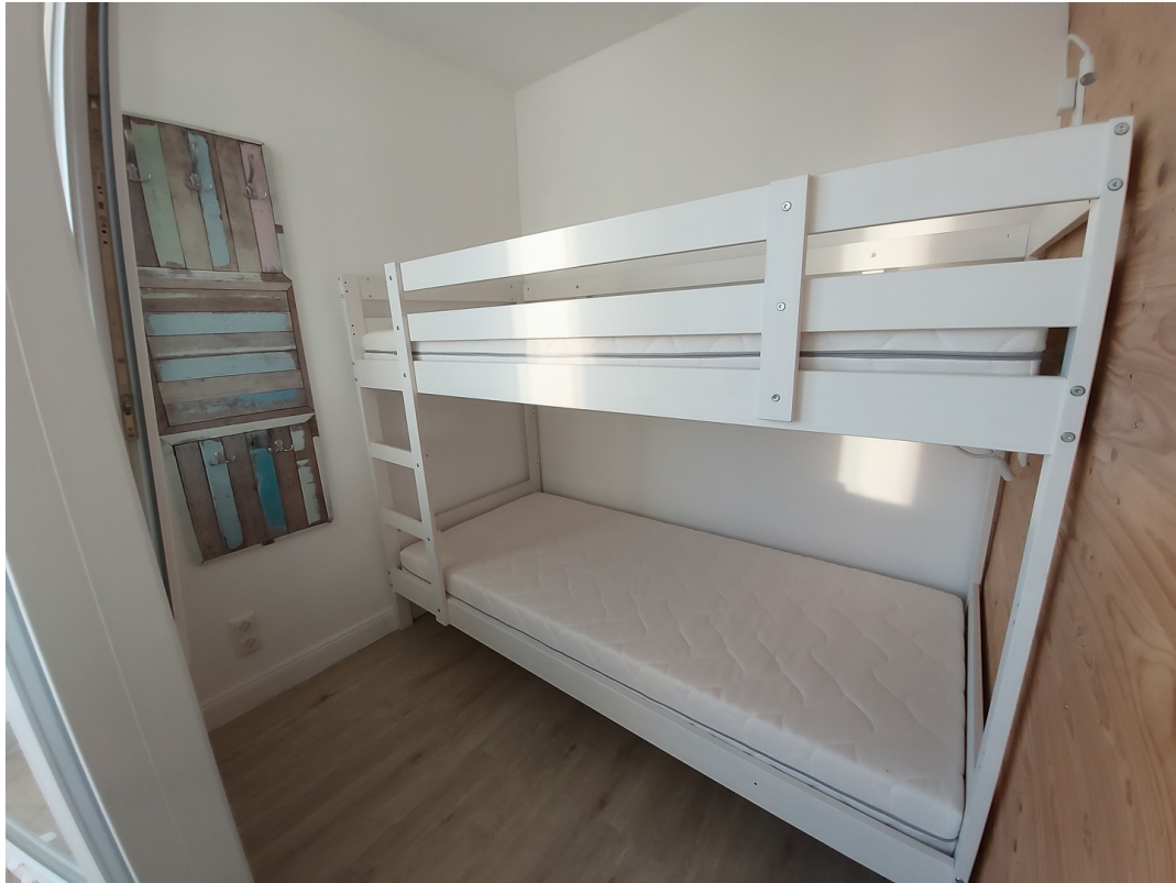
Hochbett bis zu 100kg/ Lage