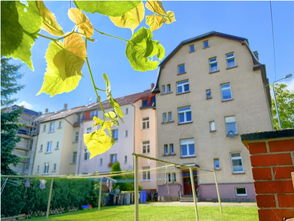
Hof mit Grün