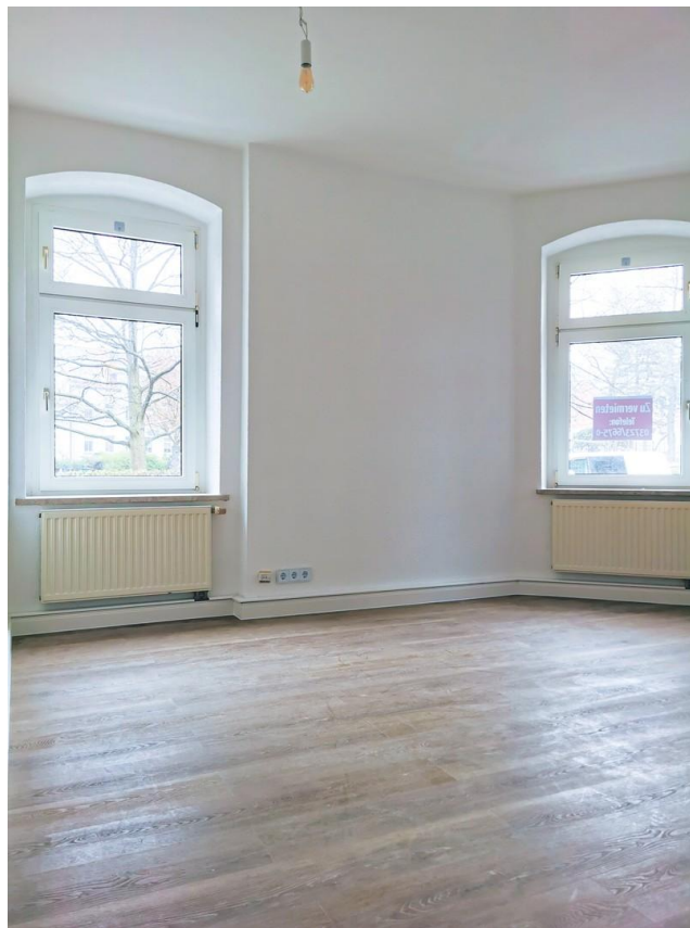
Neues Design Laminat