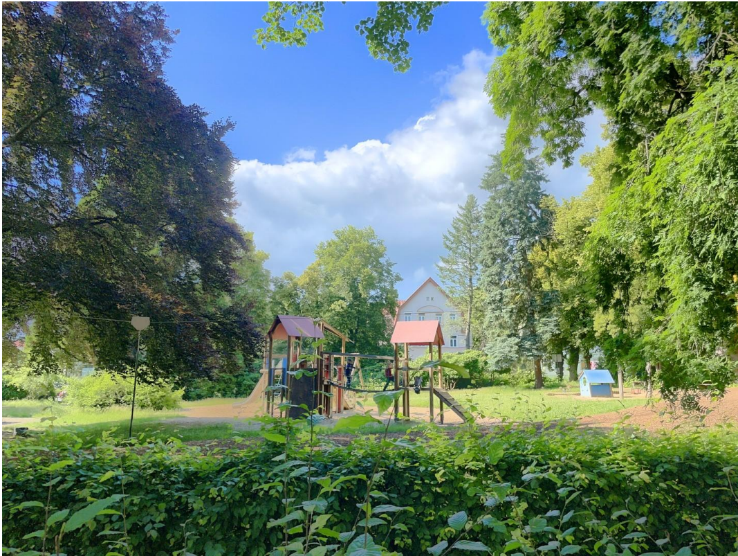
Park - 50 m entfernt