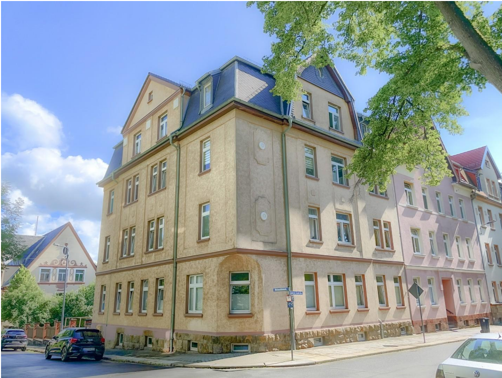
Blick auf das Haus