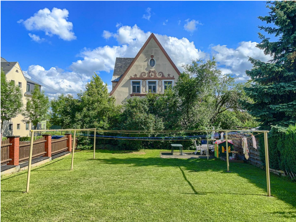
Blick in den eigenen Hof