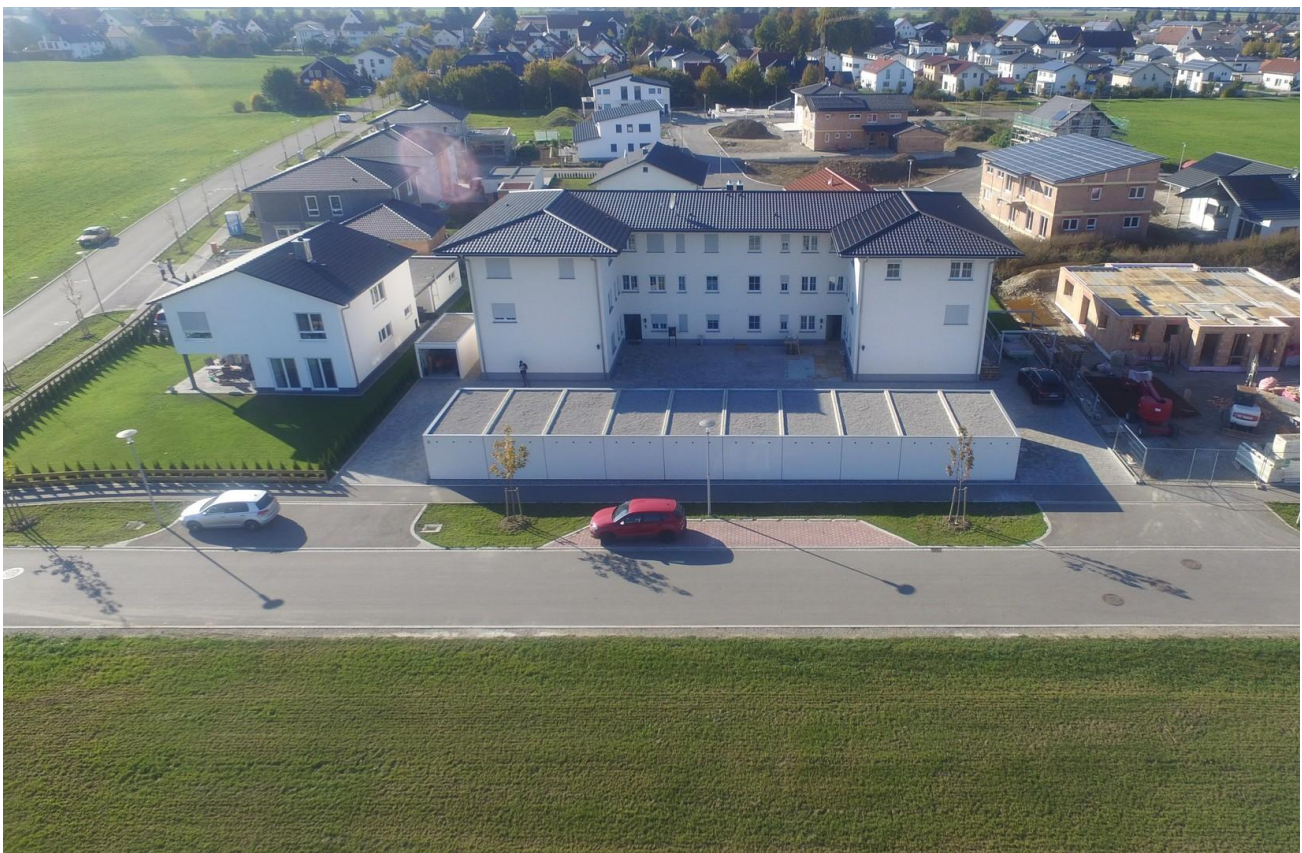
Wohngebäude - Lage