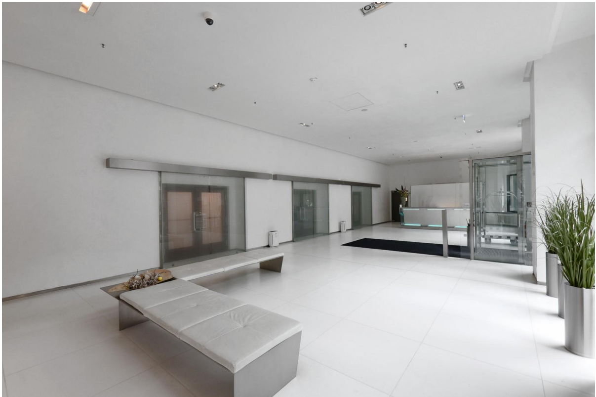
Eingangsbereich mit Concierge