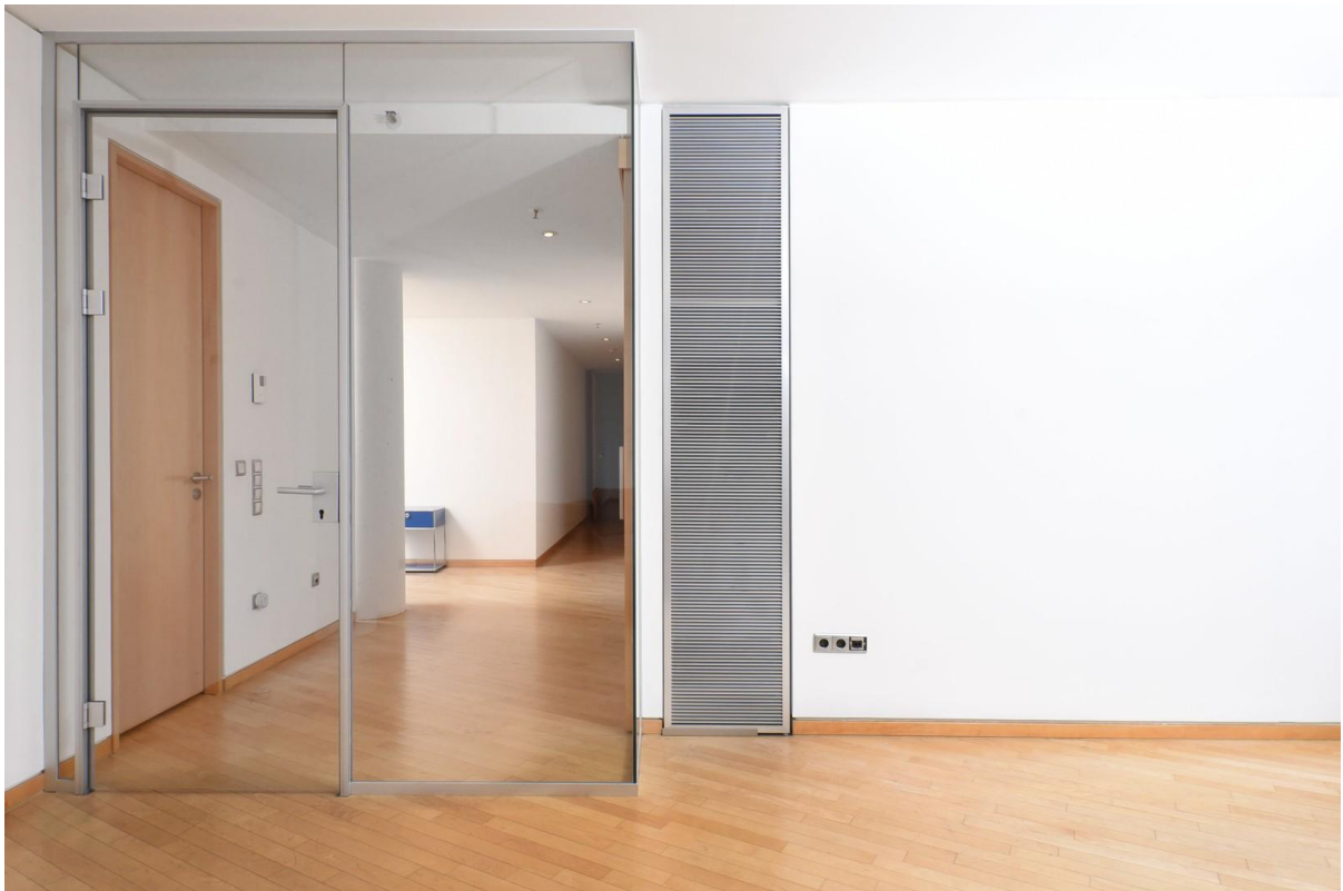
Blick in Flur