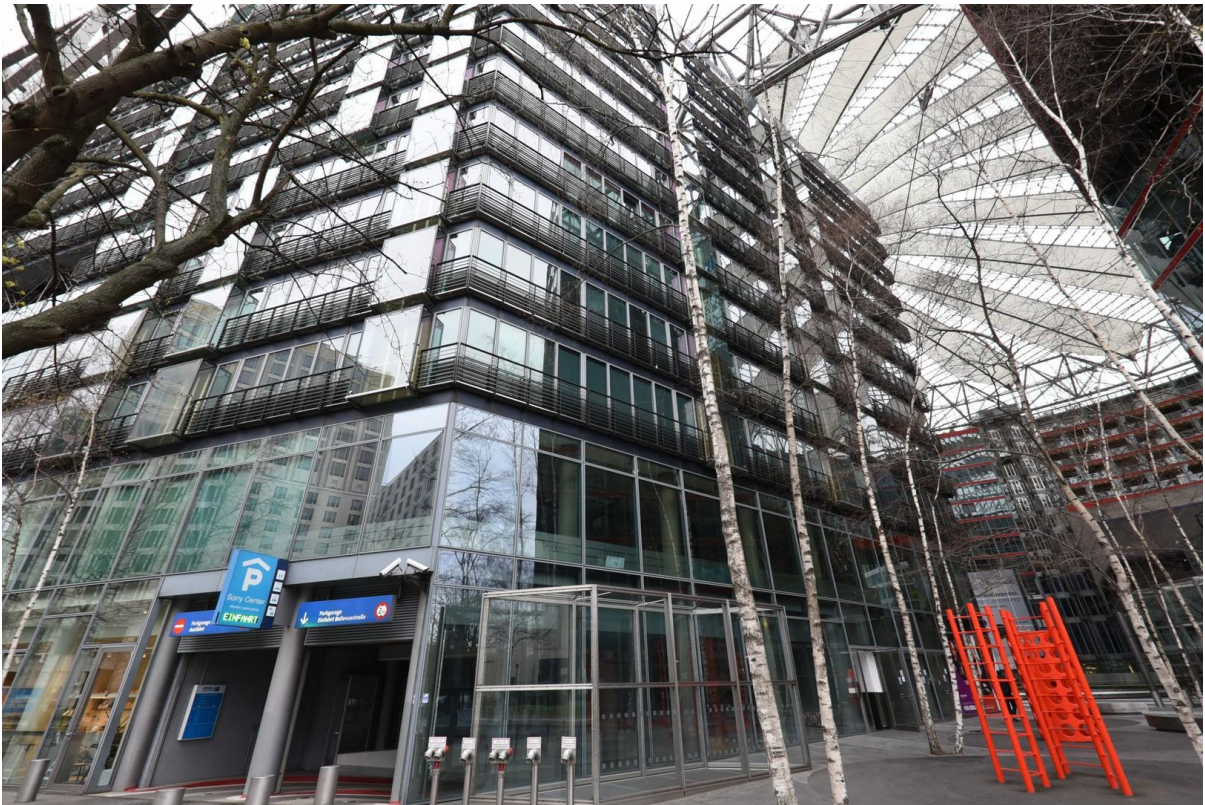
Tiefgarage im Haus