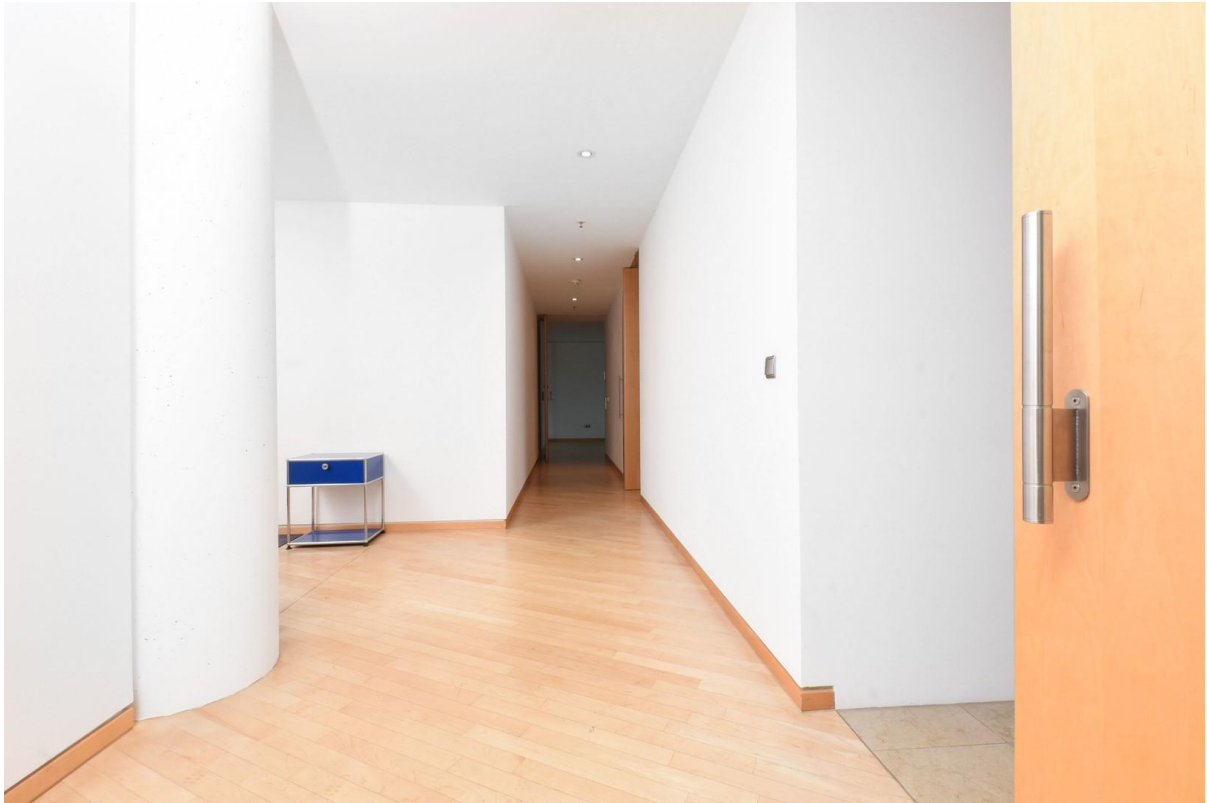
Flur, links Eingangsbereich