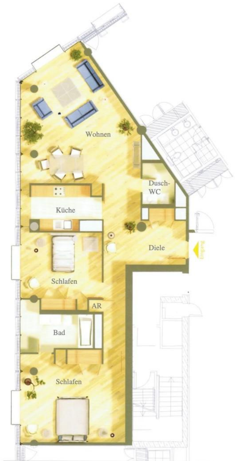
Grundriss Sony Center Wohnung4