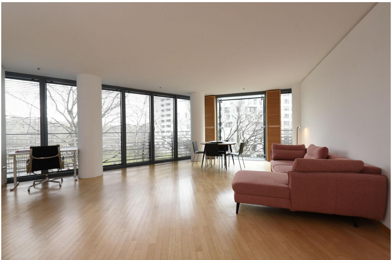
Wohnzimmer Ritz-Carlton Blick