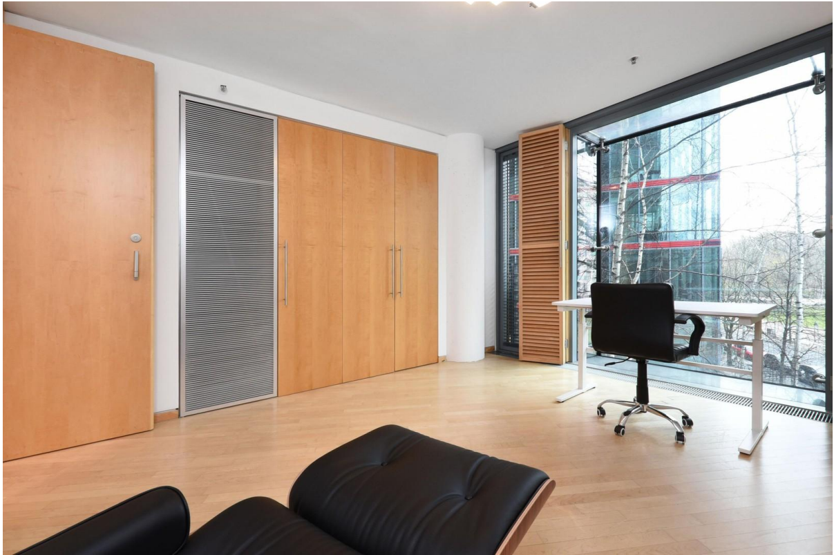
Kinderzimmer / Büro