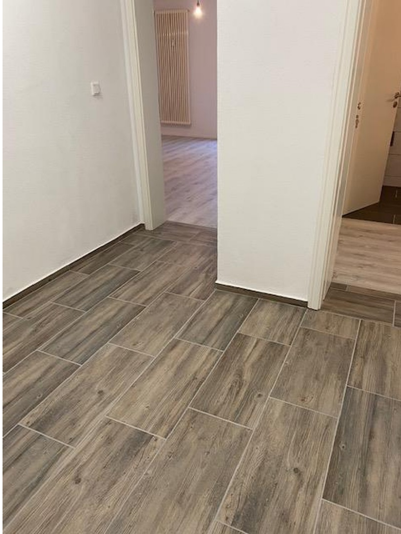
Eingangsbereich zur Wohnung