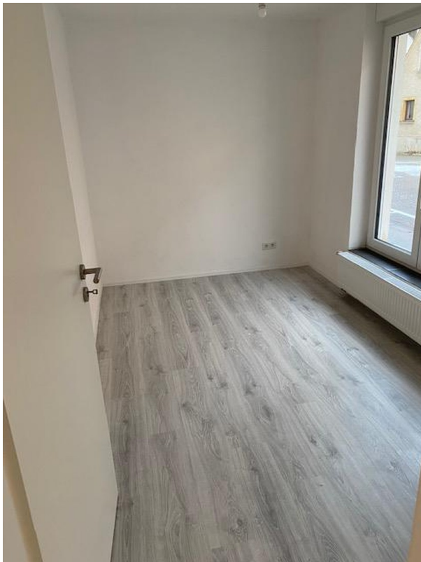
Kinderzimmer - Büro - Gästezi.