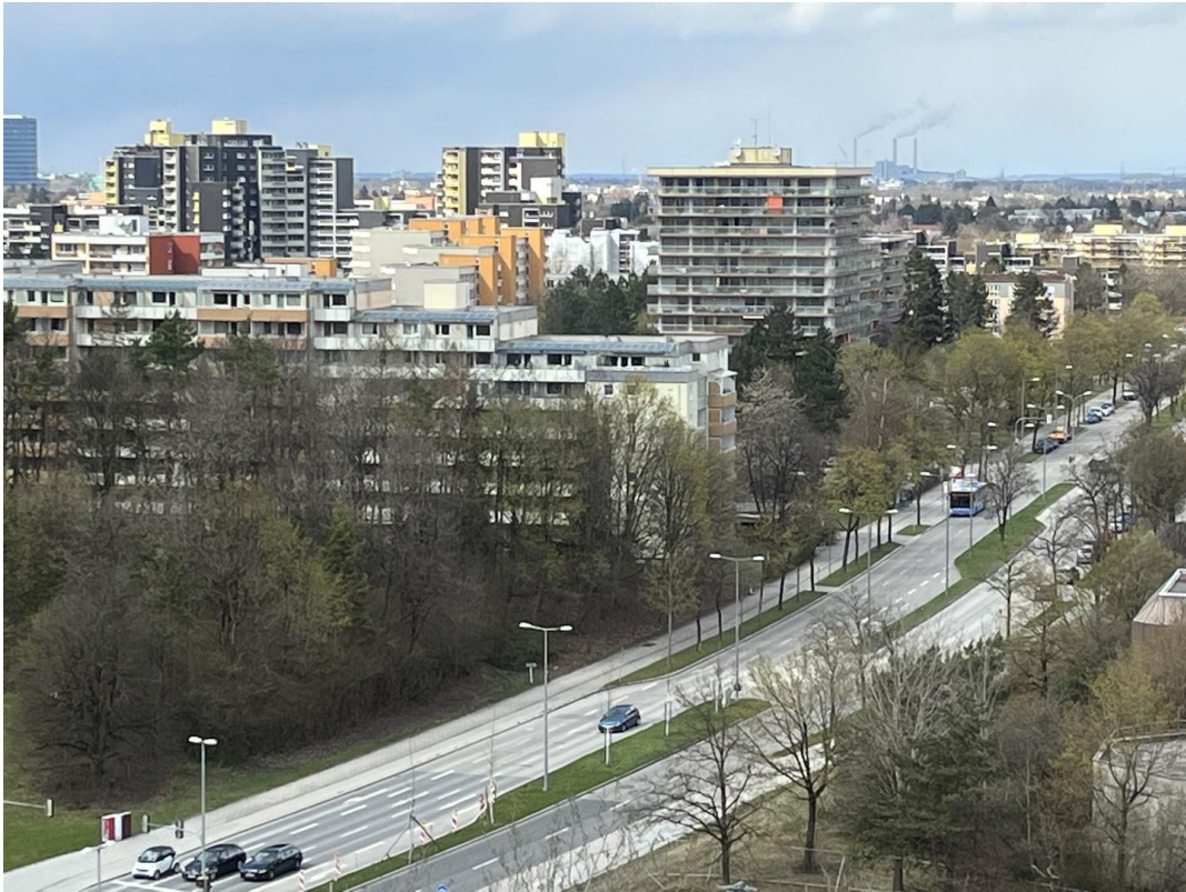
Blick Von Küche Fenster_01