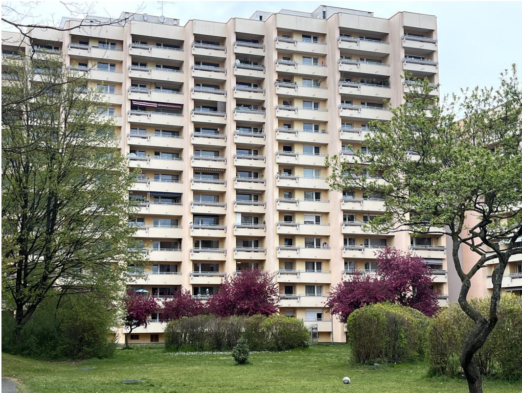
Wohngebäude von Außen 02