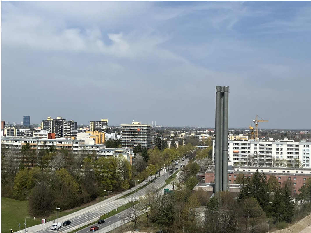
Fernblick von Nordloggia_02