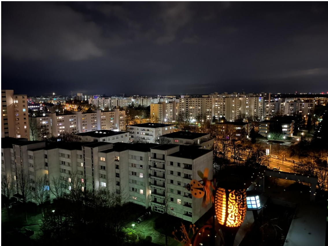
Fernblick Nacht Südloggia_02