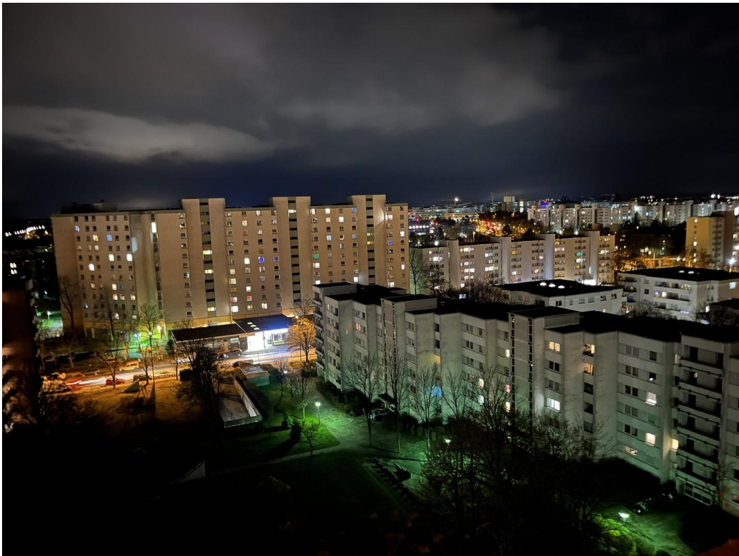
Fernblick Nacht Südloggia_03