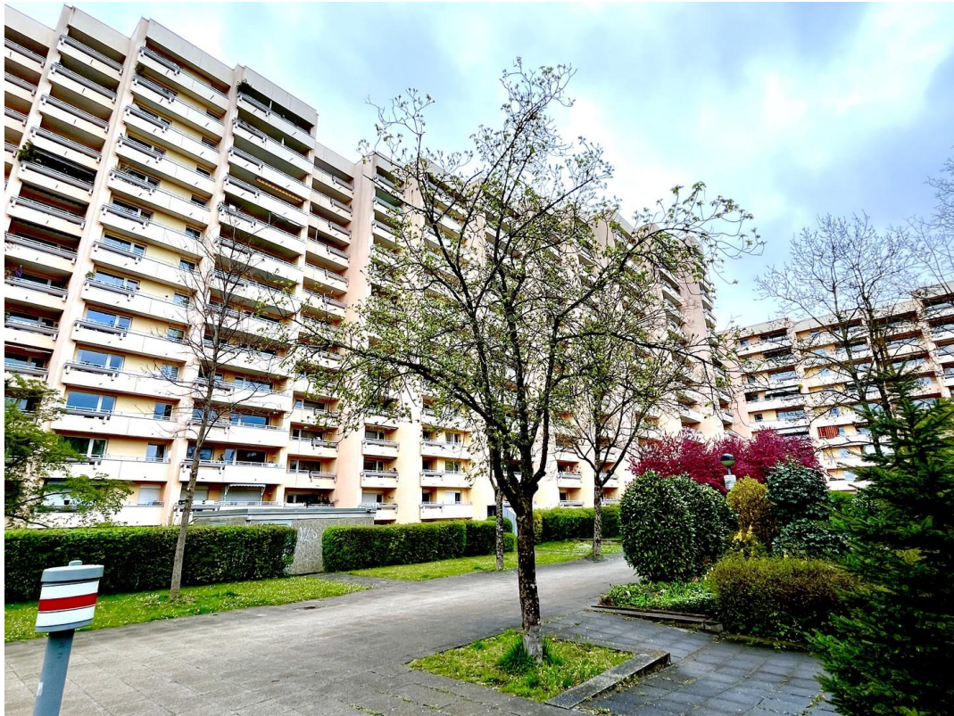
Wohngebäude von Außen 01