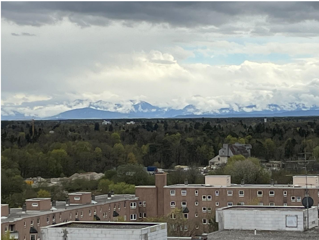
Fernblick Nacht Südloggia_06