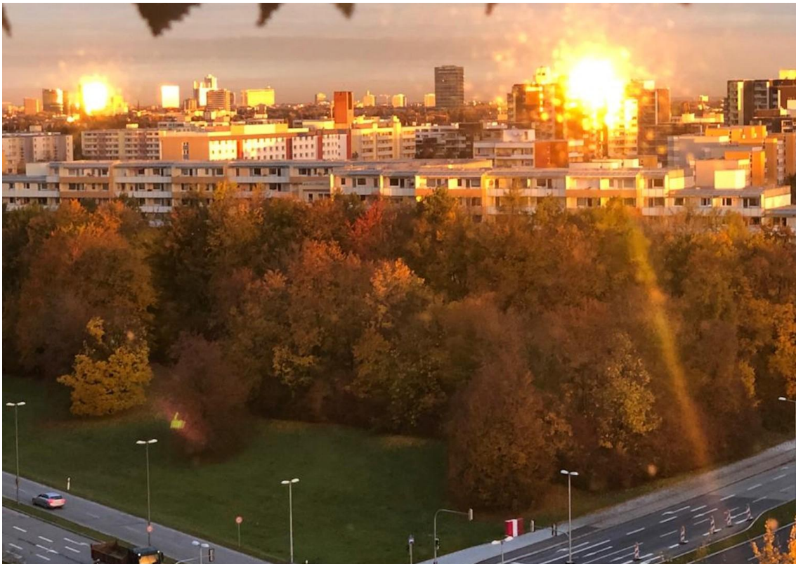
Fernblick von Nordloggia_03