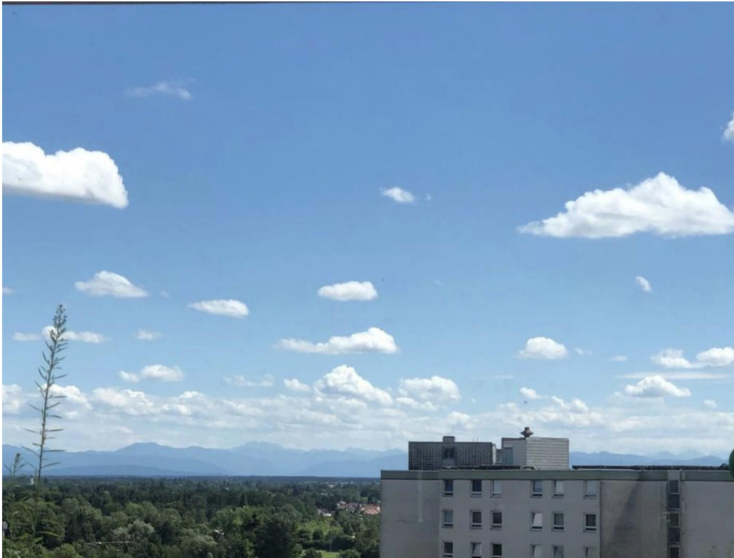
Alpenblick von Südloggia_01