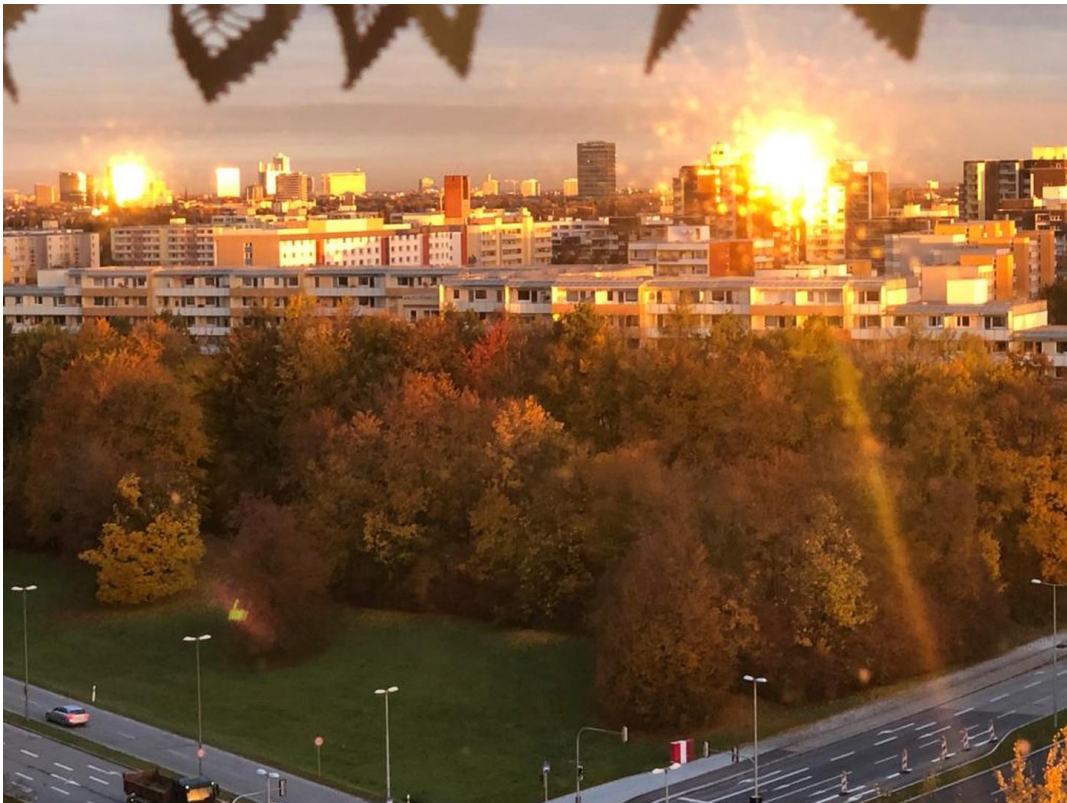
Blick Von Küche Fenster_02