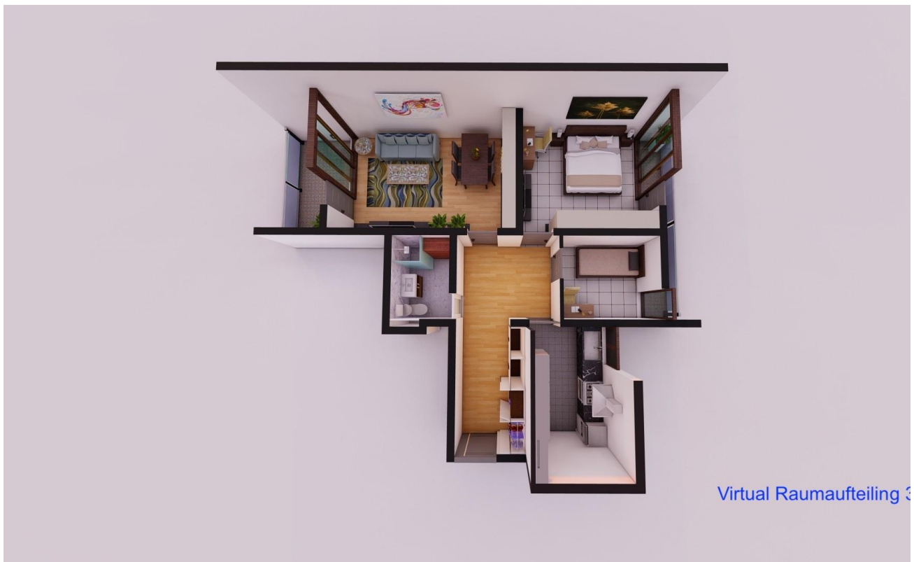
Virtual Raumaufteilung 03