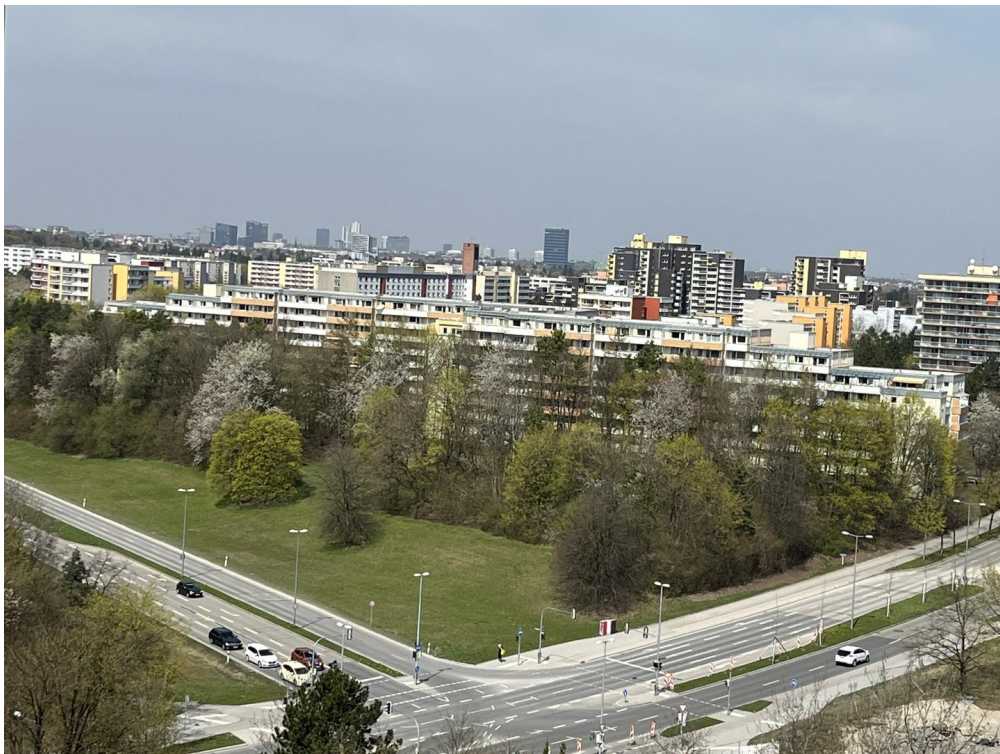
Fernblick von Nordloggia_01