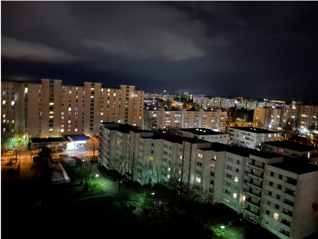
Fernblick Nacht Südloggia_04