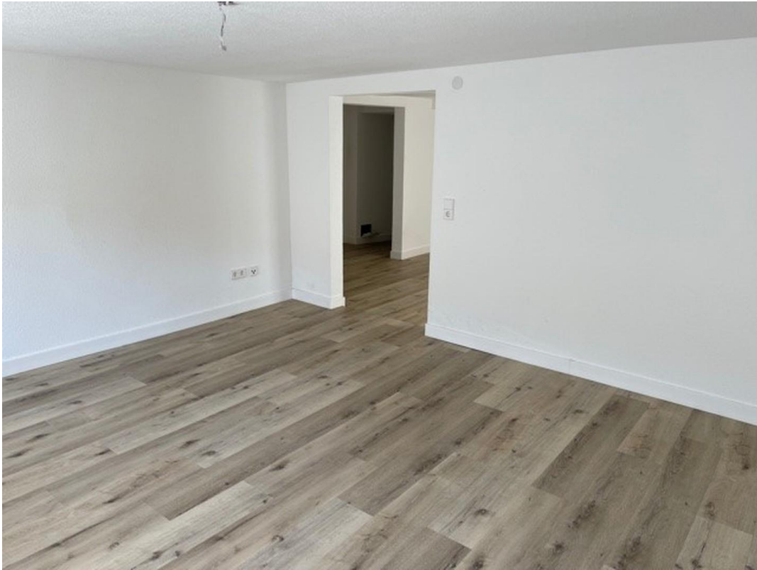
Wohnzimmer nach innen