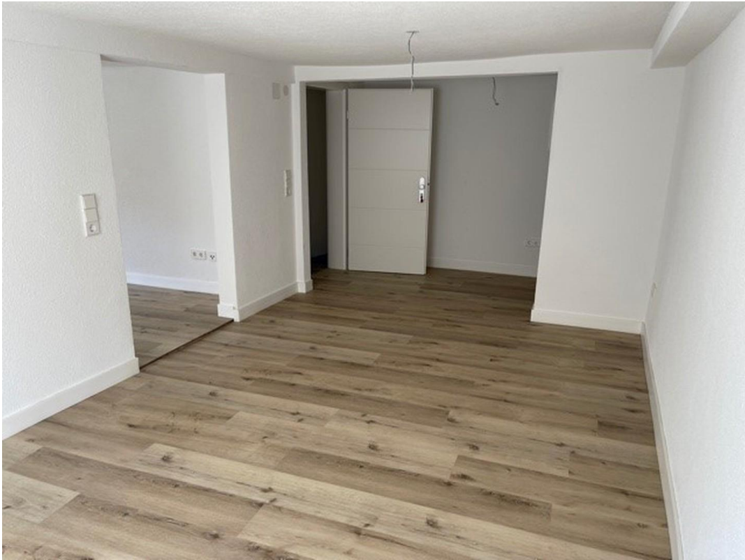
Mittelzimmer Richtung Gang