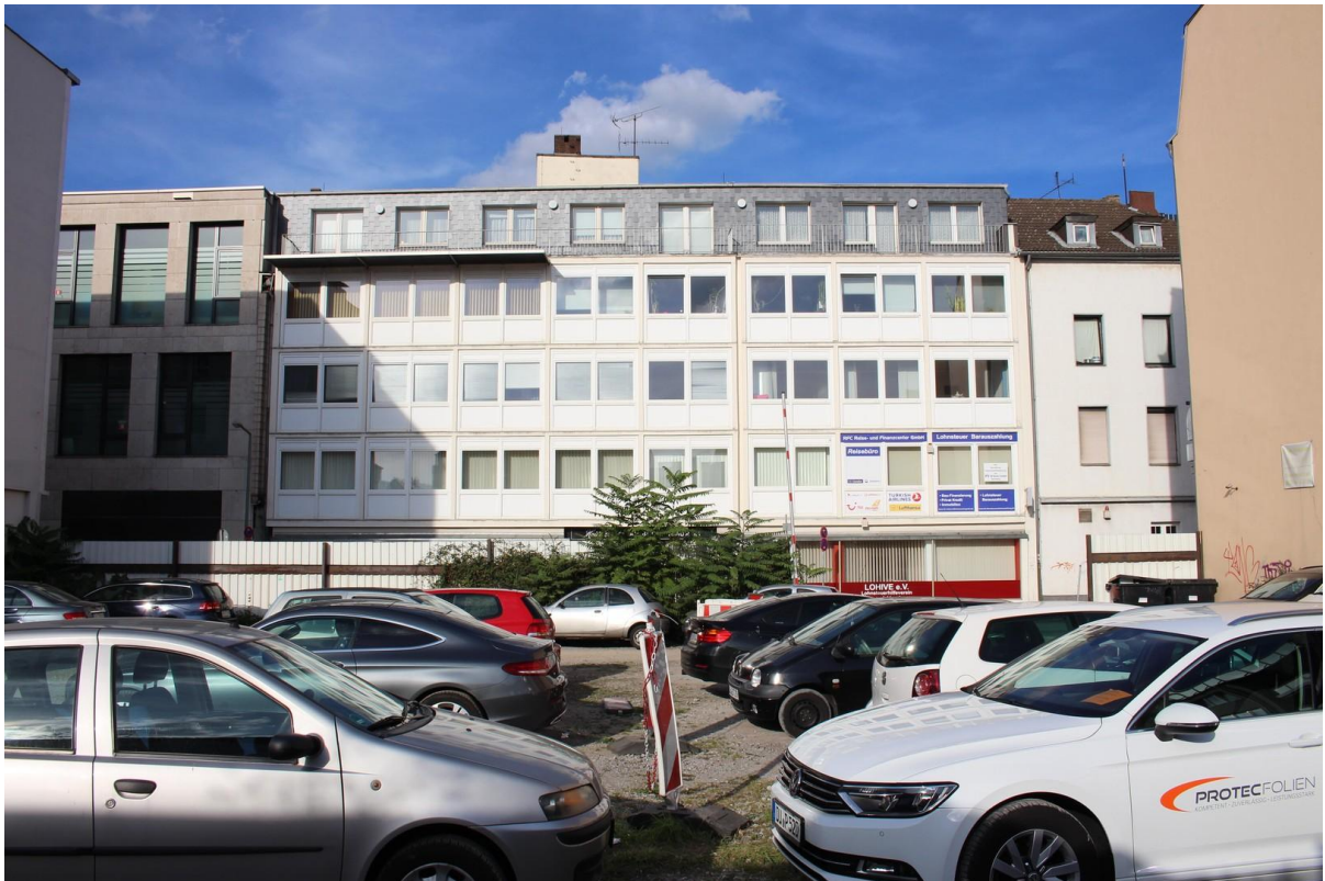
Parkplatz vor dem Haus