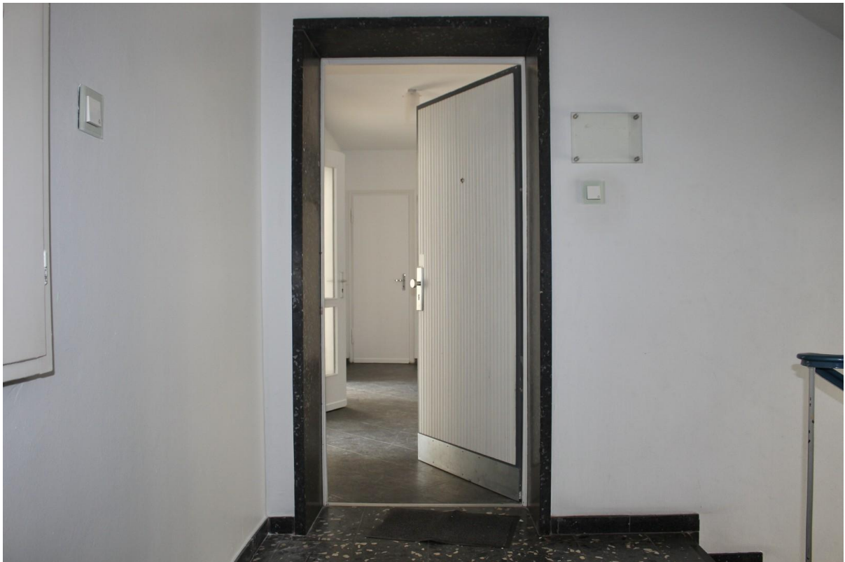
Blick vom Treppenhaus