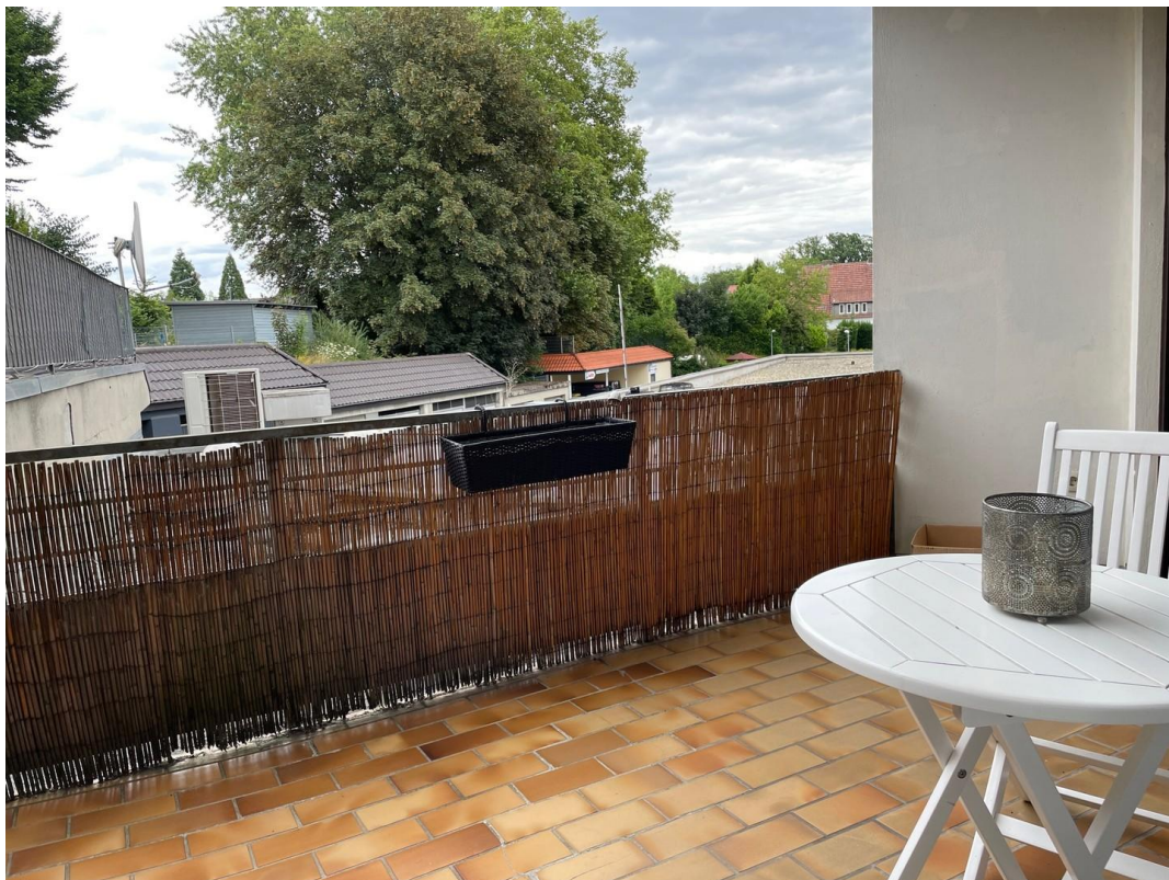
Balkon zum Hof