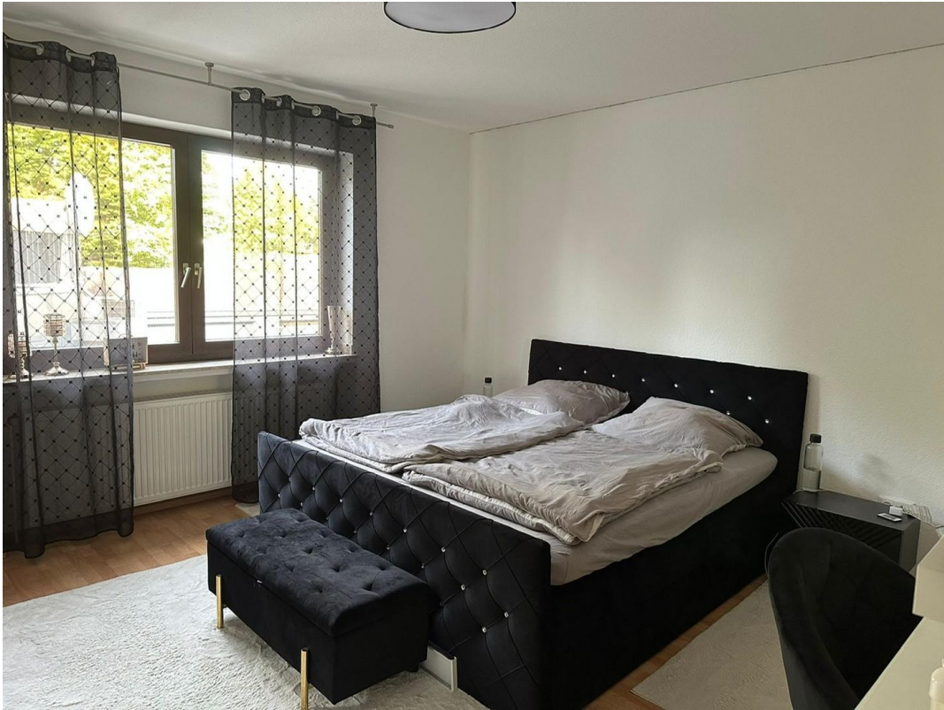
Schlafzimmer mit Fenster