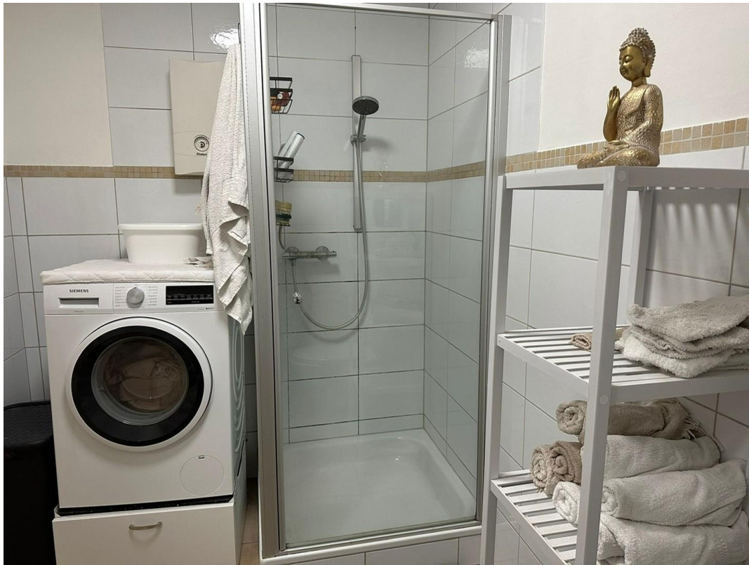
Bad mit Dusche, Waschmaschine