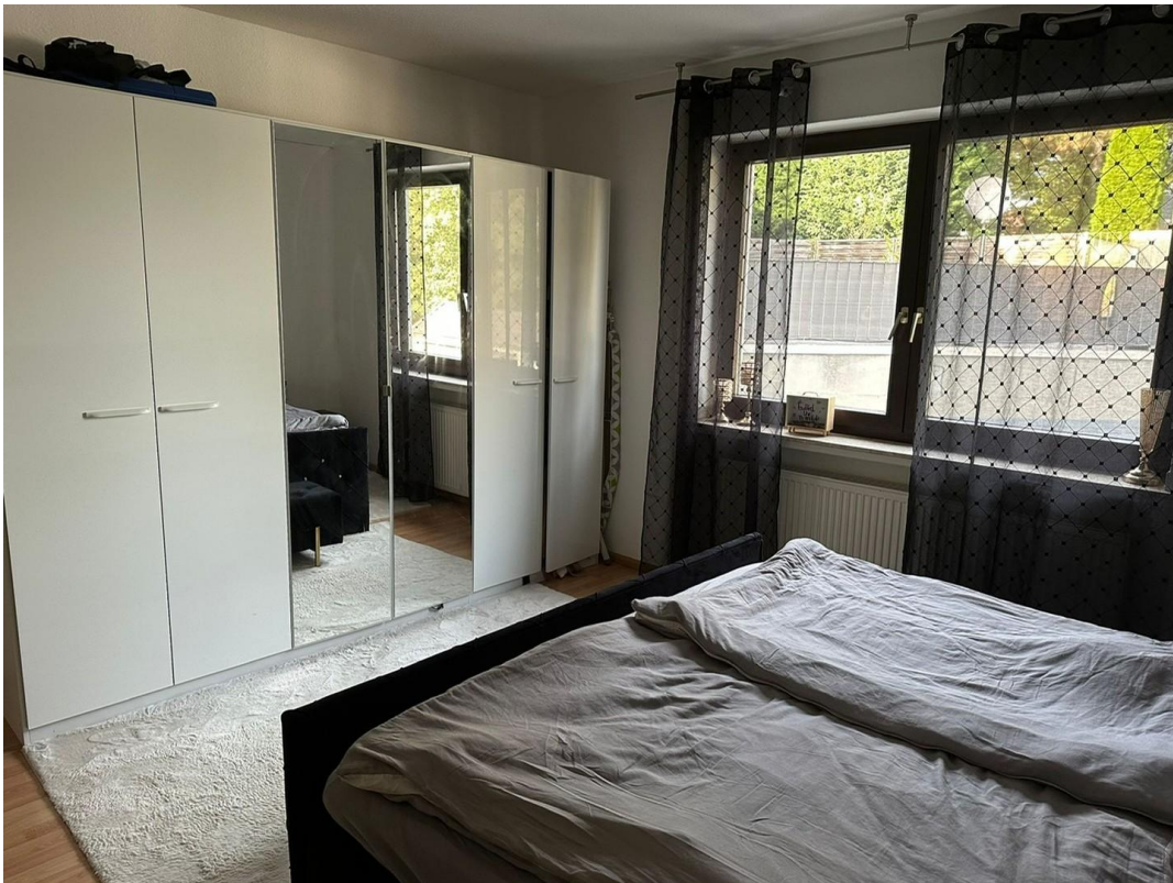
Schlafzimmer m. Kleiderschrank