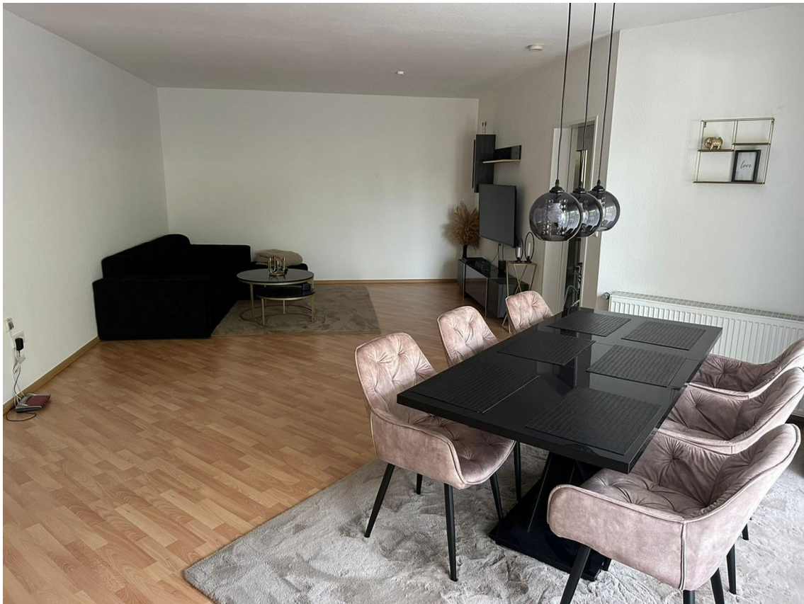
Esszimmer mit Wohnzimmer