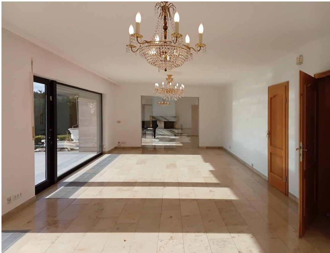
Wohn- Ess- Kaminzimmer