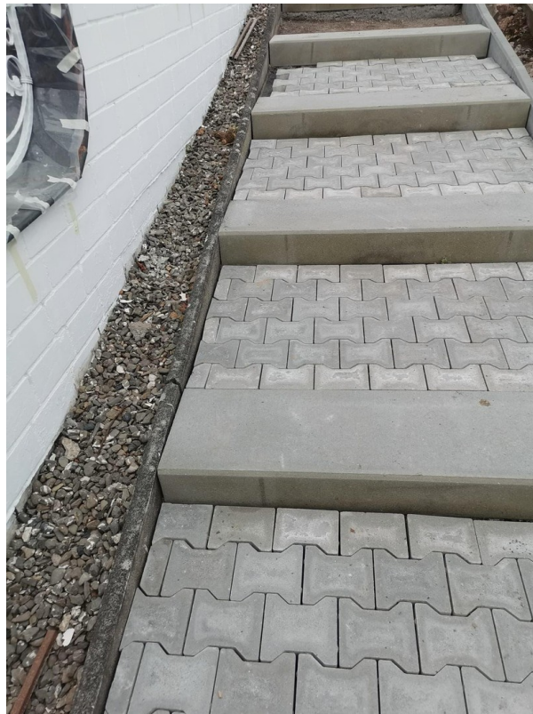
Eingangsbereich zur Straße