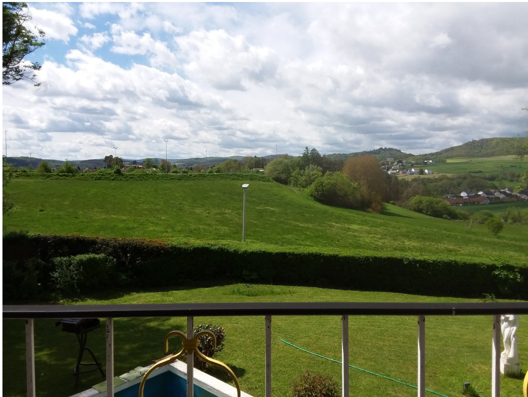
Ausblick OG. Balkon