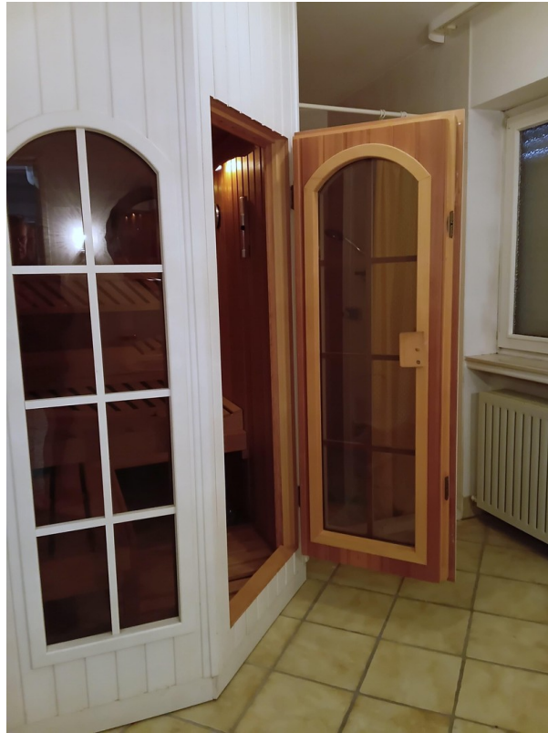
Sauna mit Bad