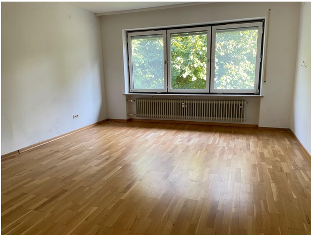
helles Zi 5