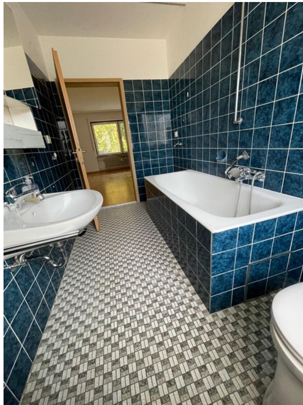
helles Bad mit Tageslicht