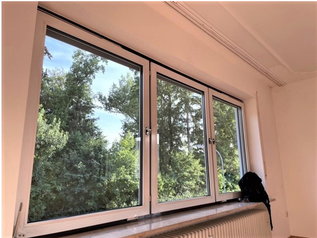
helles Z 2