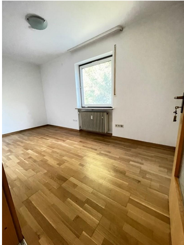
helles Zi 4