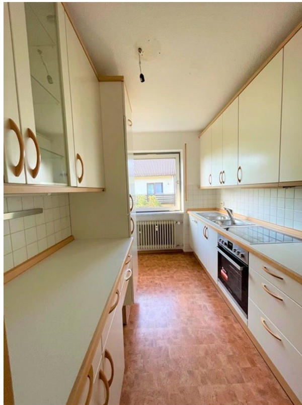
helle Küche mit Tageslicht