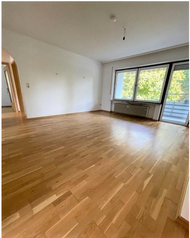
Großes Zi 3 mit Zugang Balkon