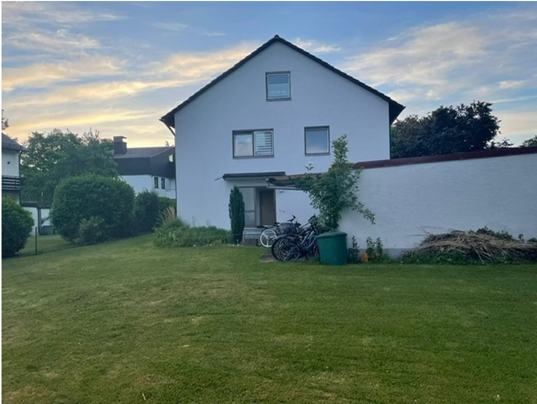
Teilansicht 2 Garten