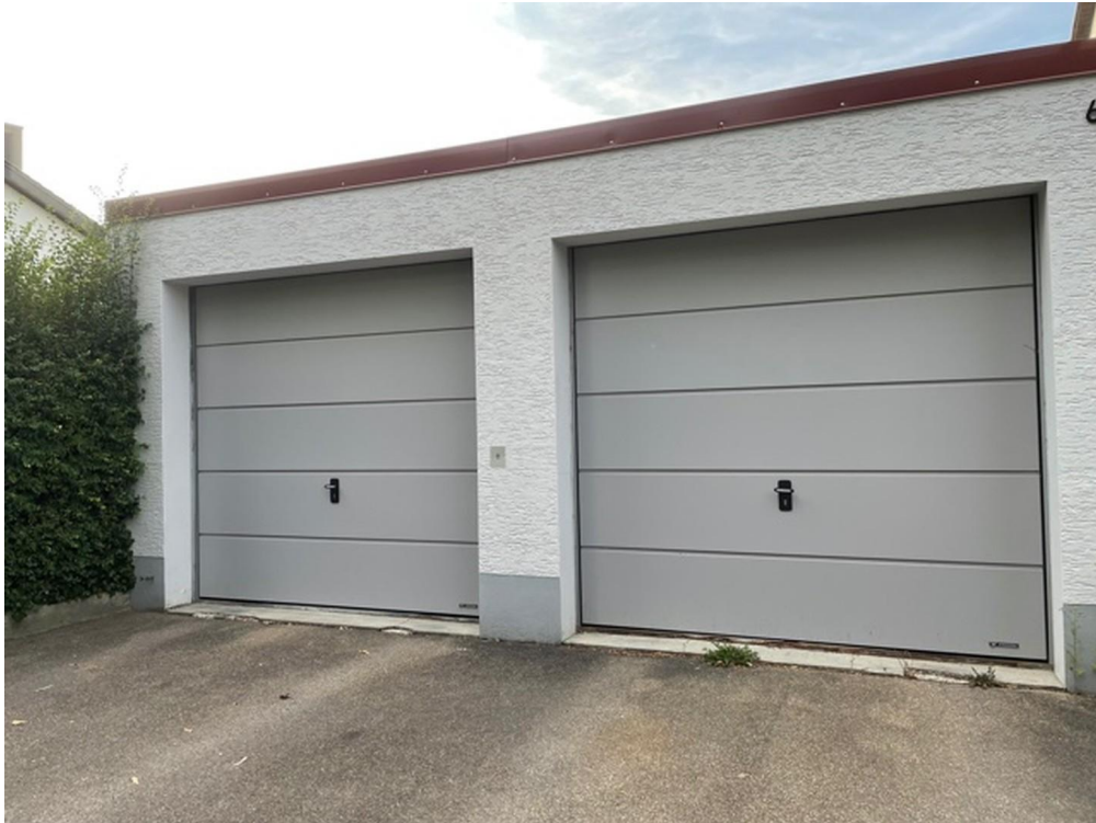
elektr.Garage mit Dach&Tor neu