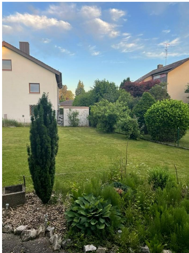
Teilansicht 1 Garten