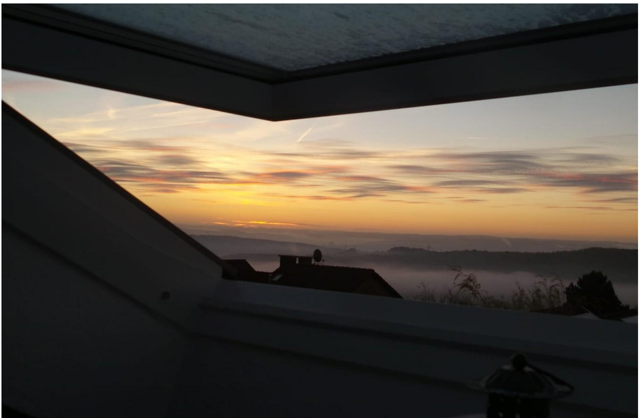
Außblick ins Sauerland