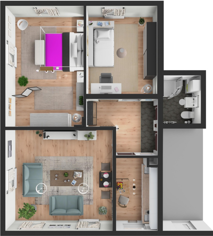
Grundriss 3D mit Möbeln (Bsp.)