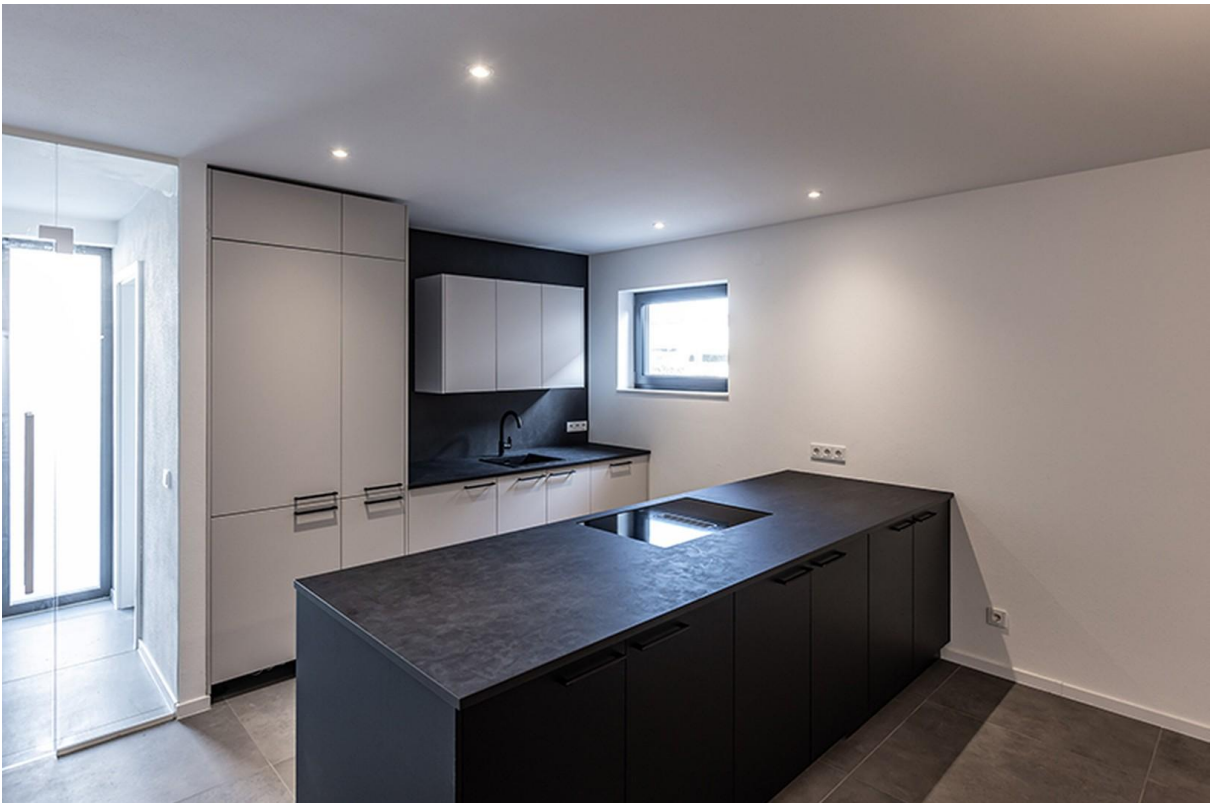
Küche EG / Musterhaus