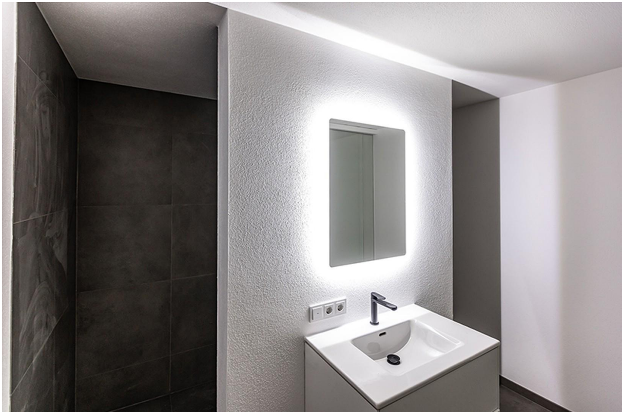
Badezimmer UG / Musterhaus