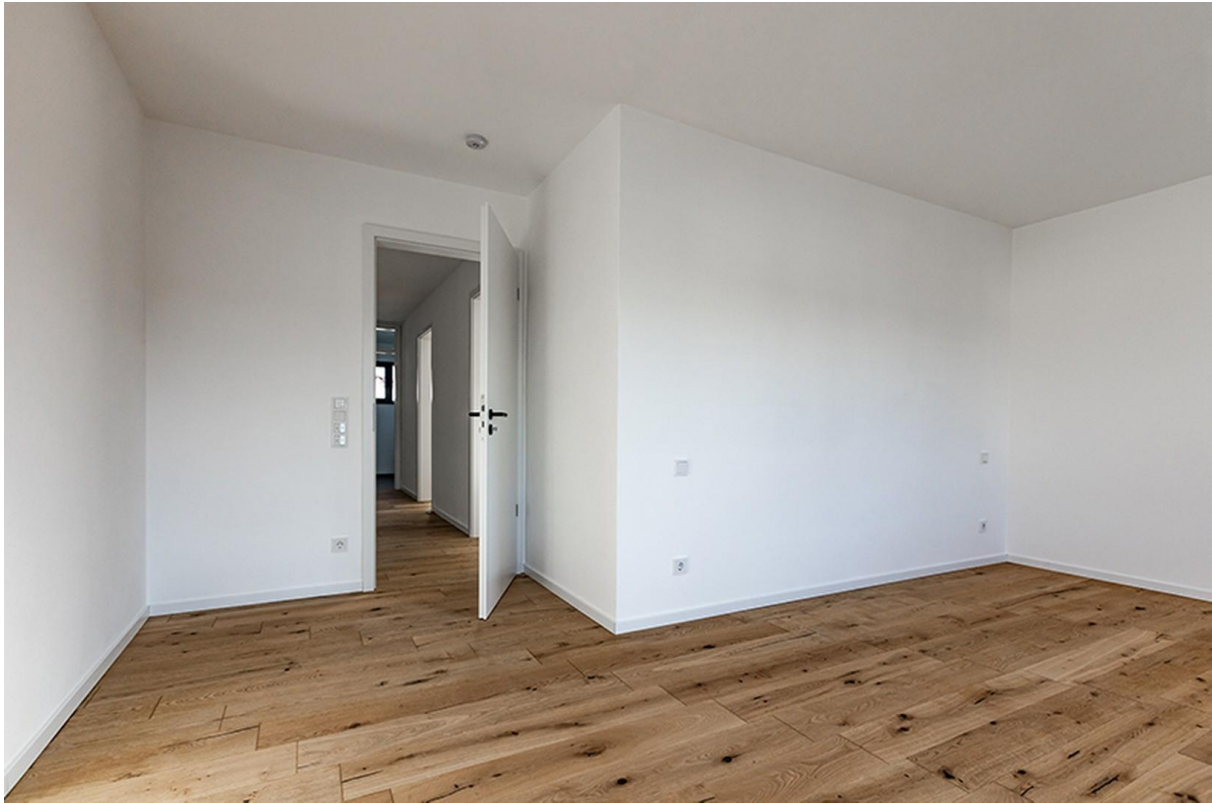
Schlafzimmer OG / Musterhaus