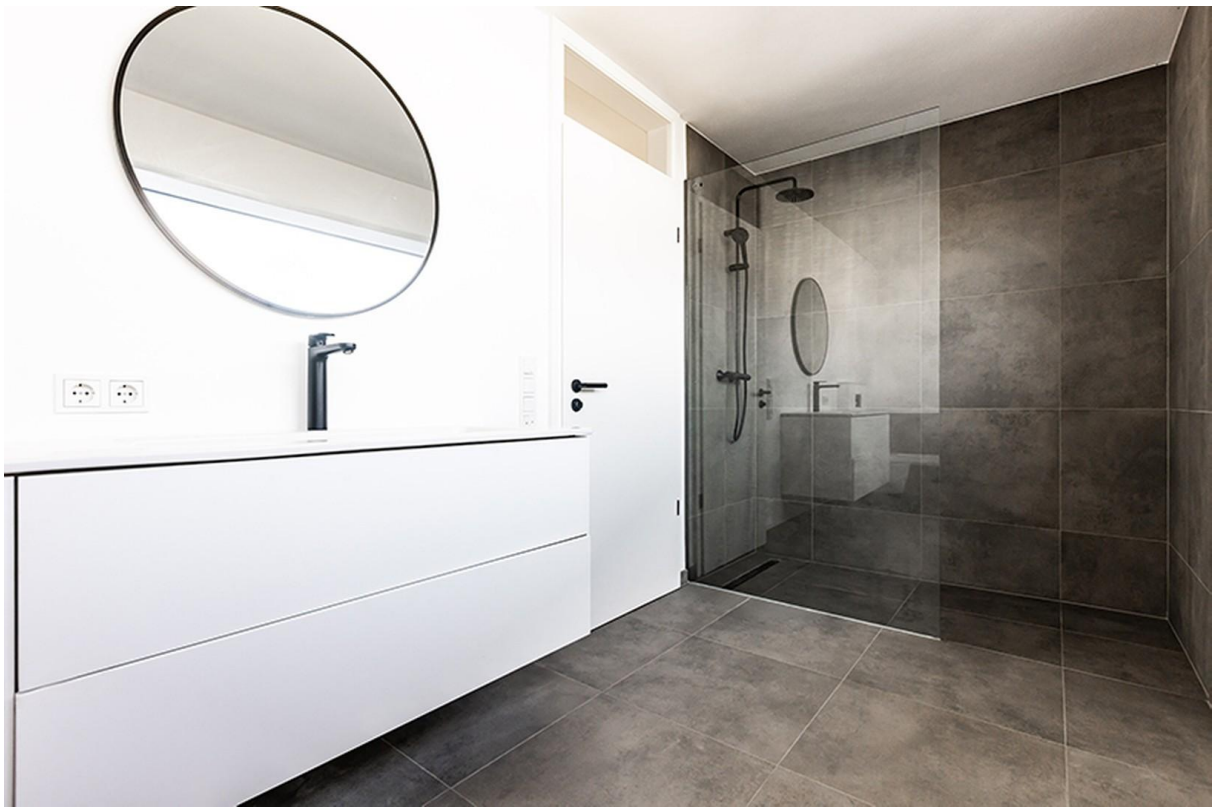
Bad OG / Musterhaus