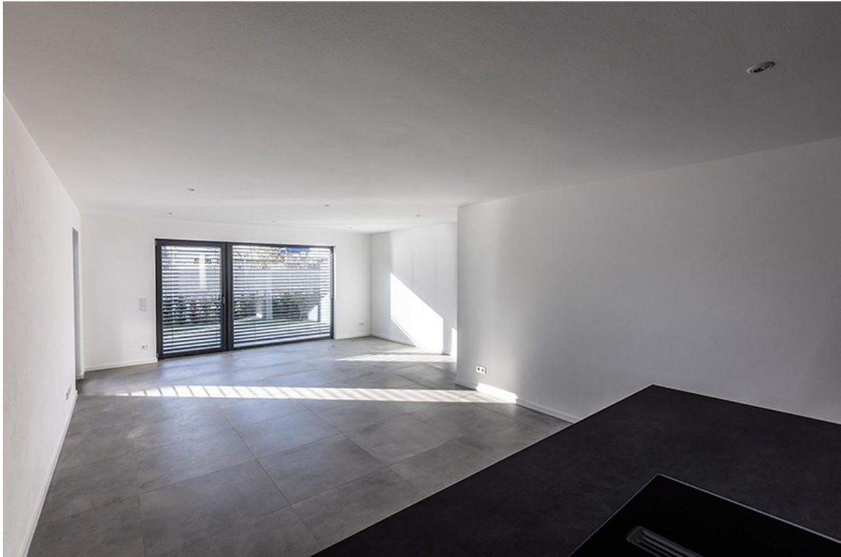
Wohn-, Essbereich / Musterhaus