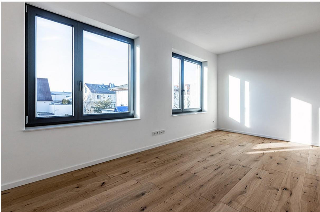
Schlafzimmer OG / Musterhaus