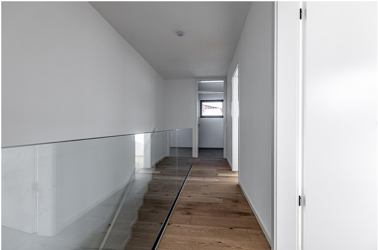
Flur OG / Musterhaus