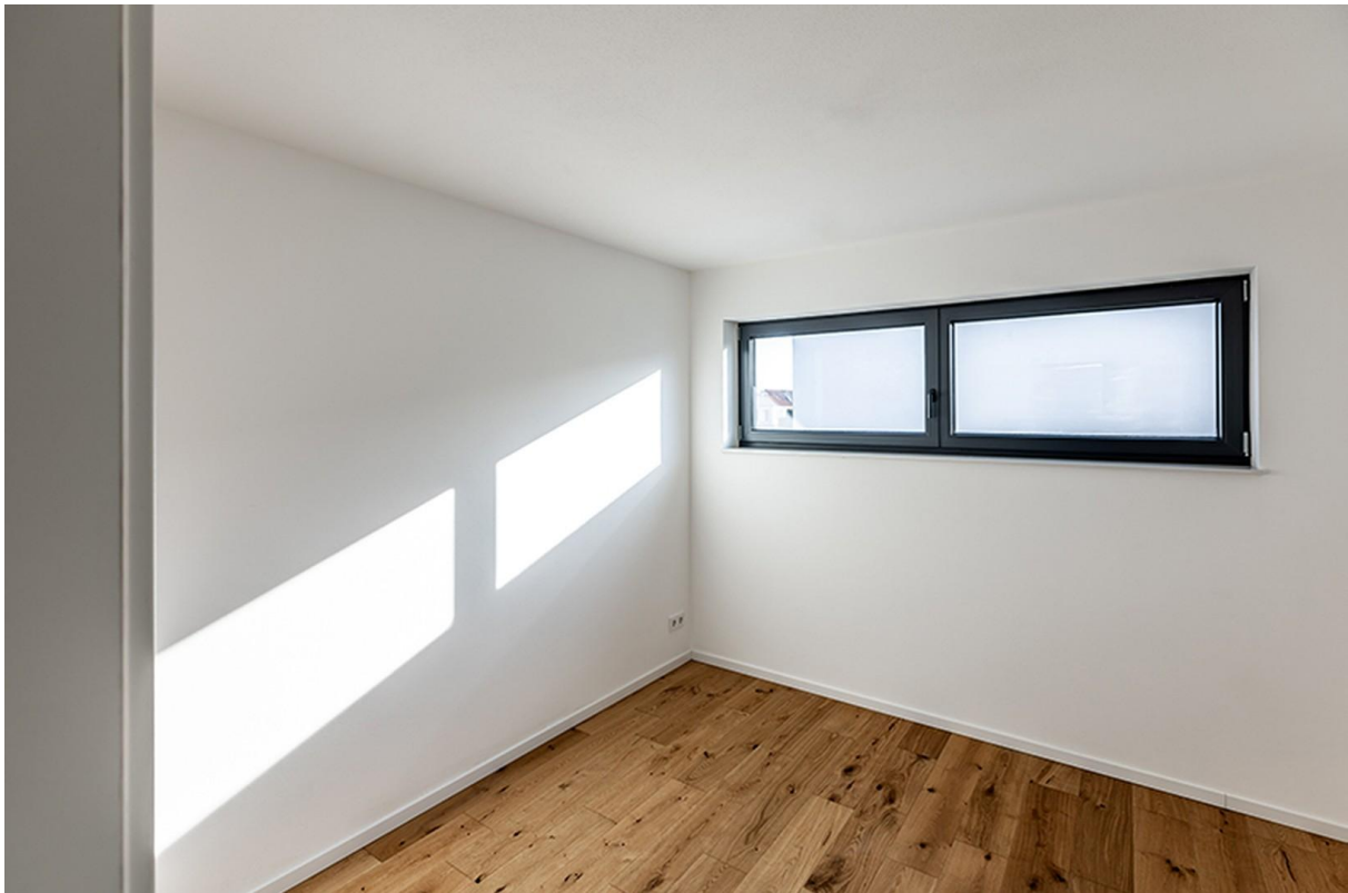
Kinderzimmer OG / Musterhaus