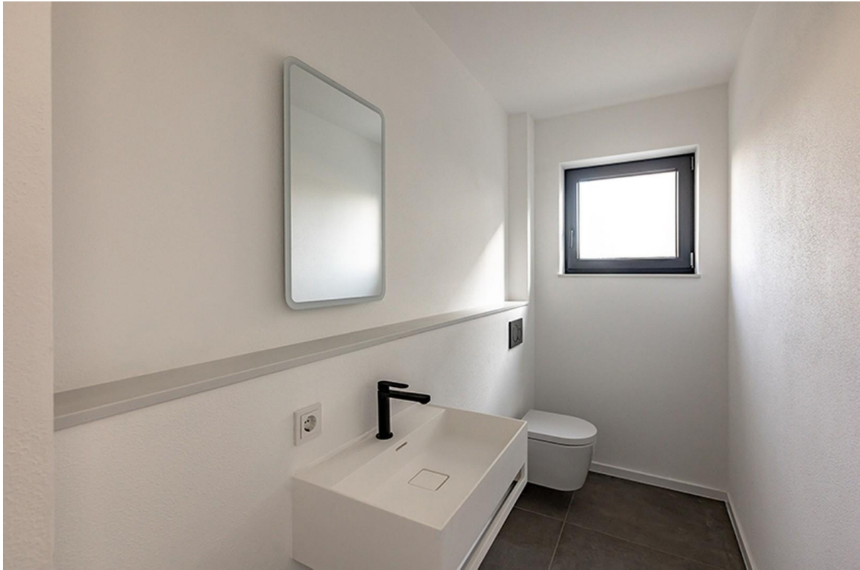
Gäste WC / Musterhaus