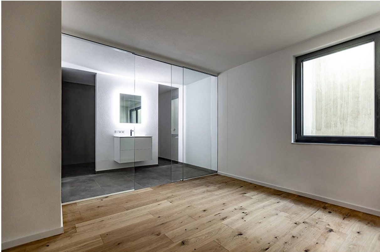
Wohnen UG / Musterhaus