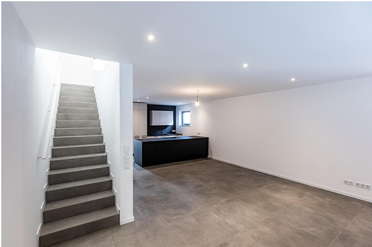
Wohnen EG / Musterhaus