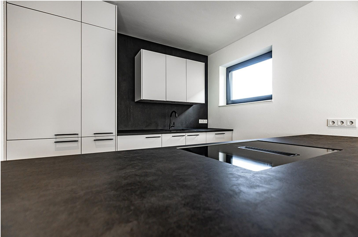
Küche EG / Musterhaus