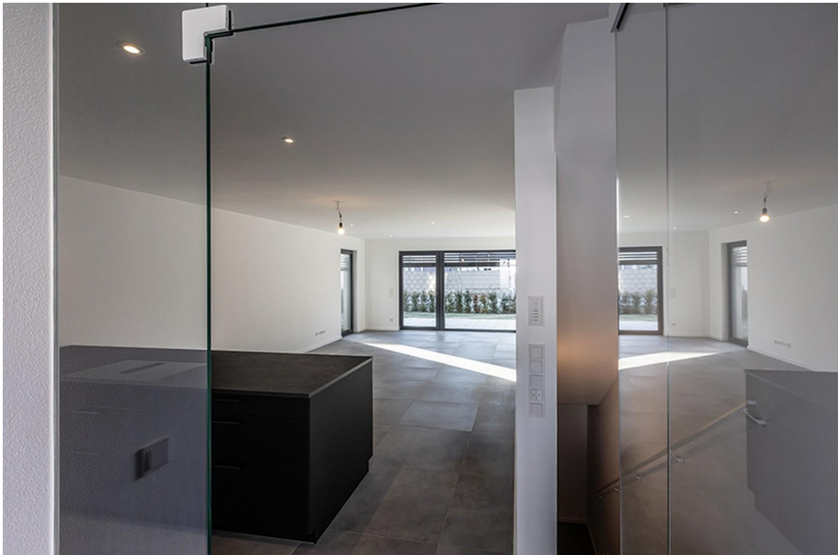
Flur / Musterhaus