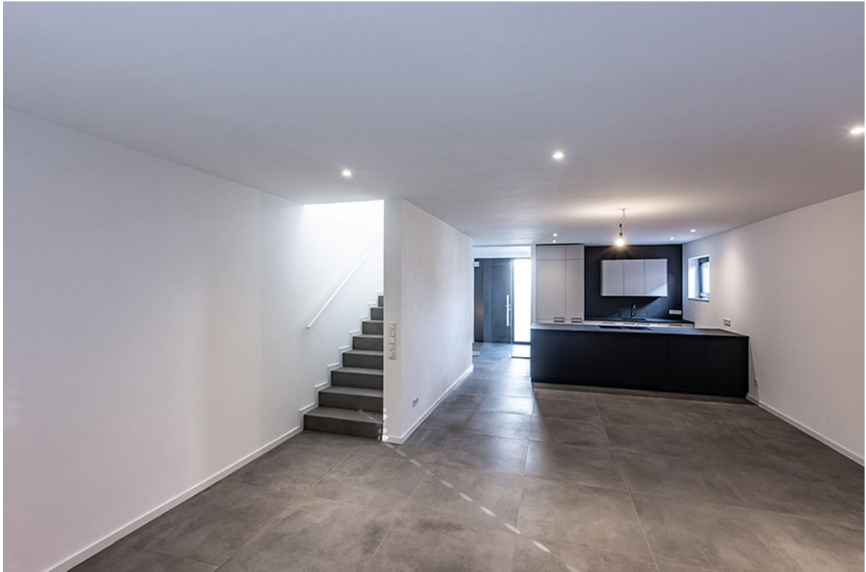
Wohn-, Esszimmer / Musterhaus