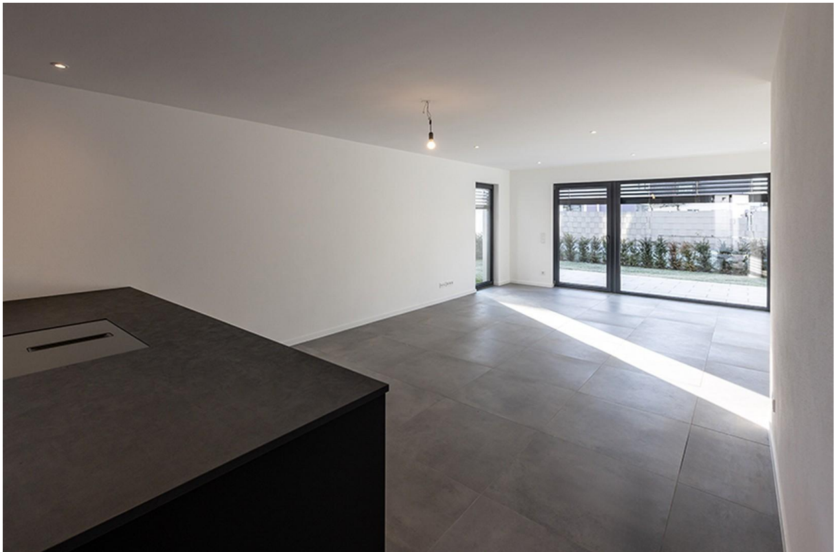
Wohn-, Essbereich / Musterhaus