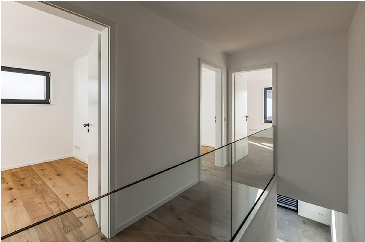
Flur OG / Musterhaus