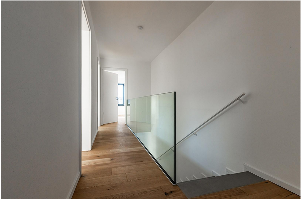
Flur OG / Musterhaus