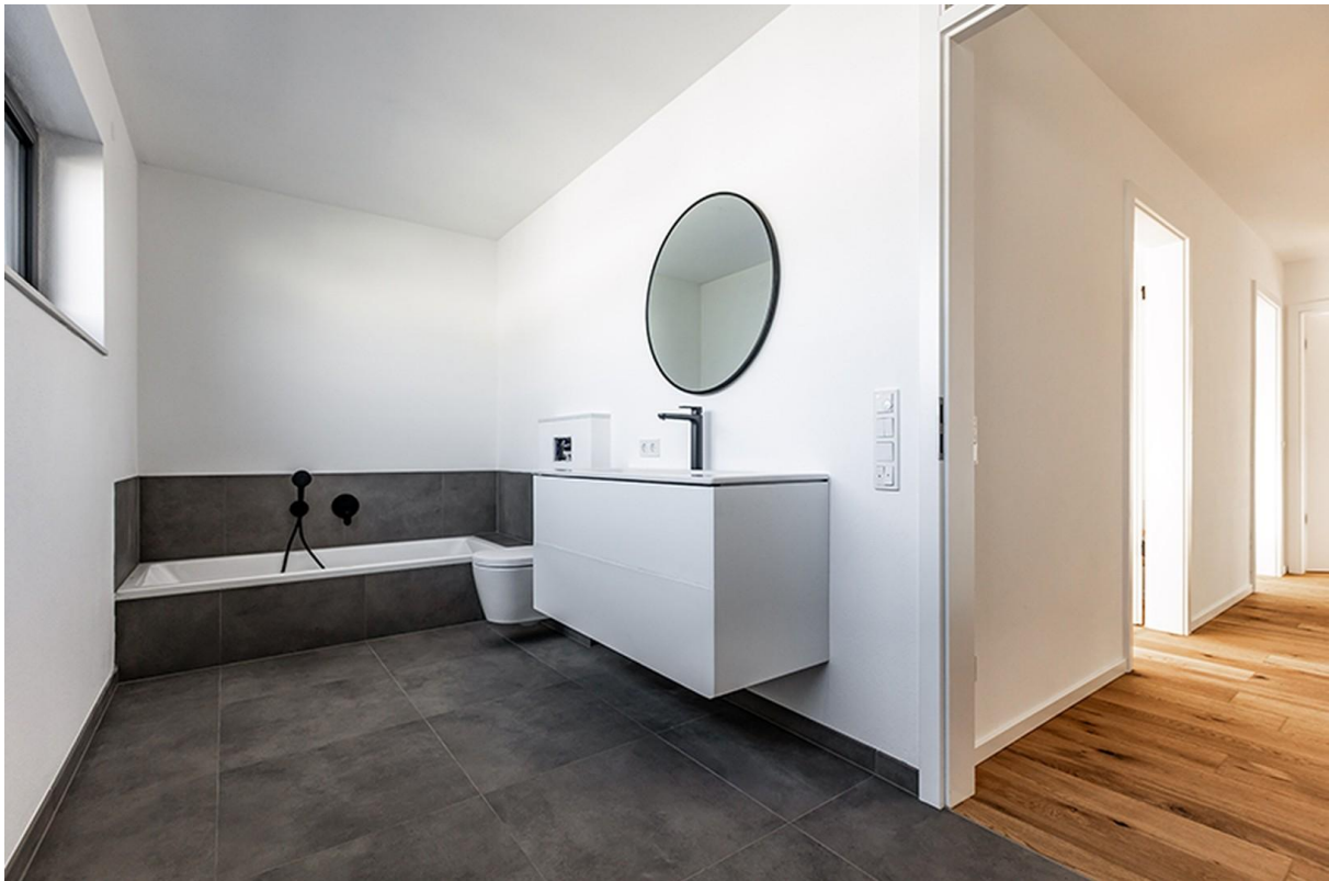
Bad OG / Musterhaus