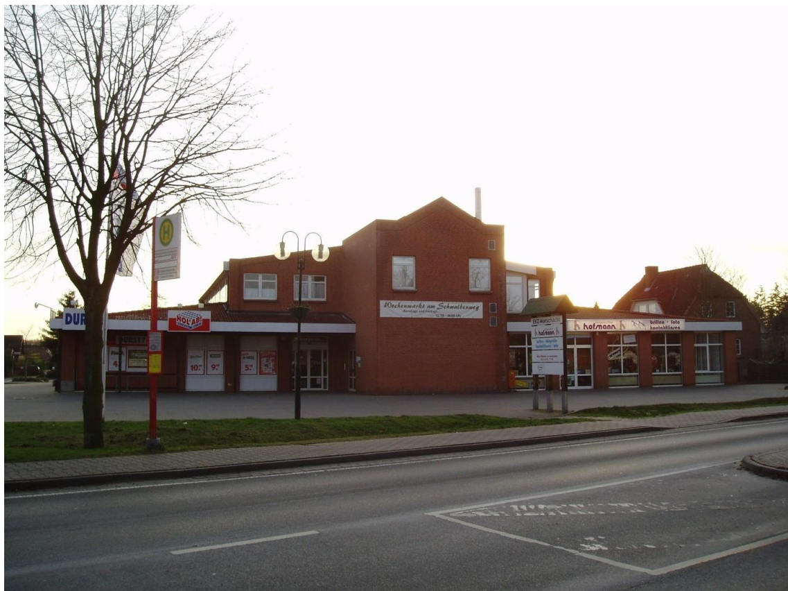
Ansicht von der Elbuferstraße