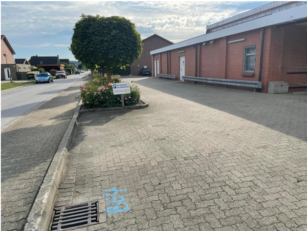
Be- und Entladung der Ware