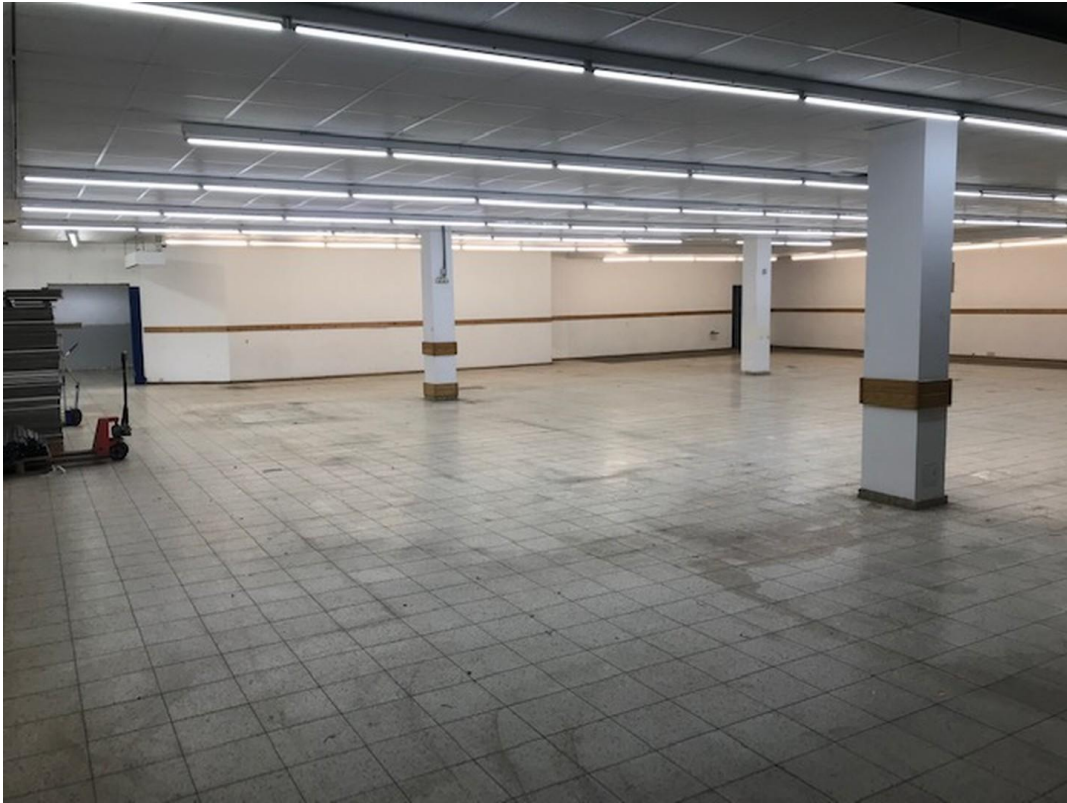
Einblick in die Ladenfläche