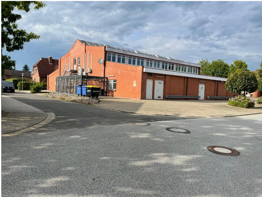
Ansicht von hinten