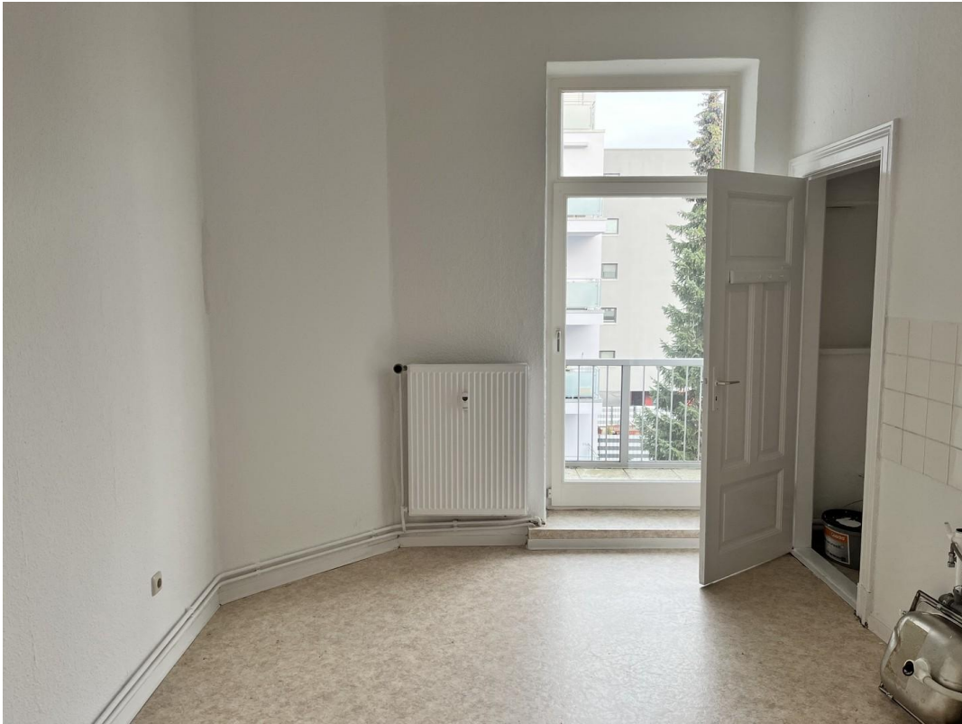
Küche mit Balkonzugang