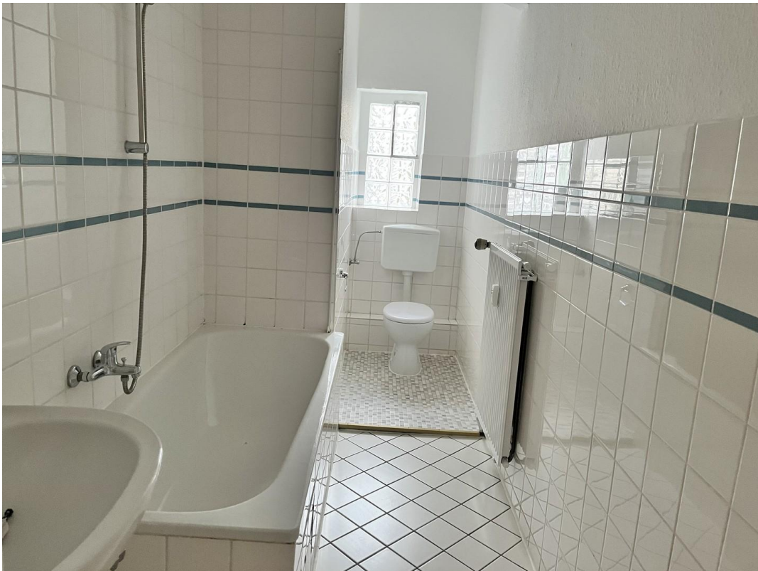
Badezimmer mit Badewanne