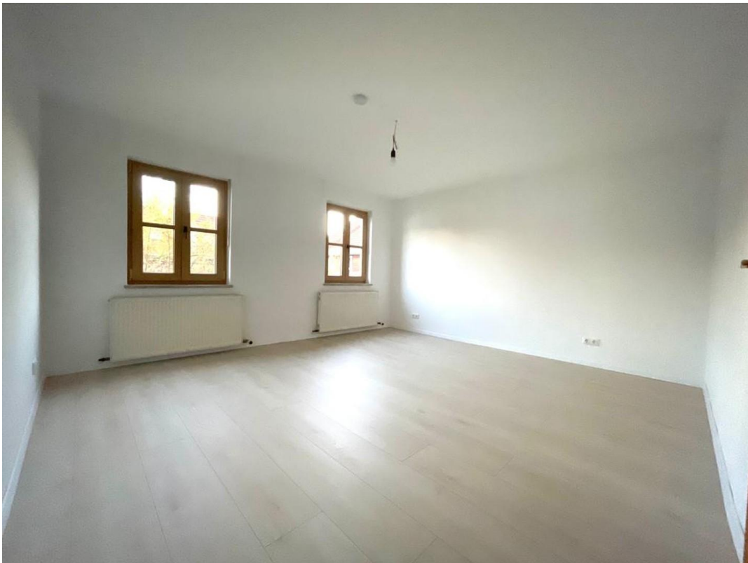
1.OG 1. Zimmer