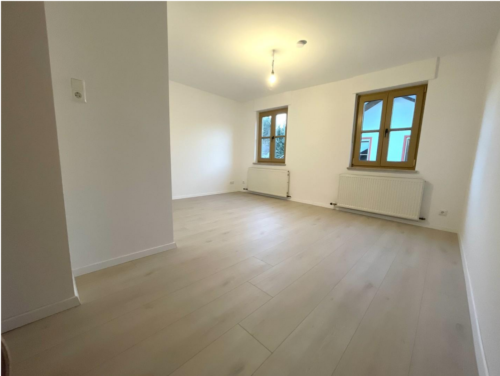
1.OG 2. Zimmer