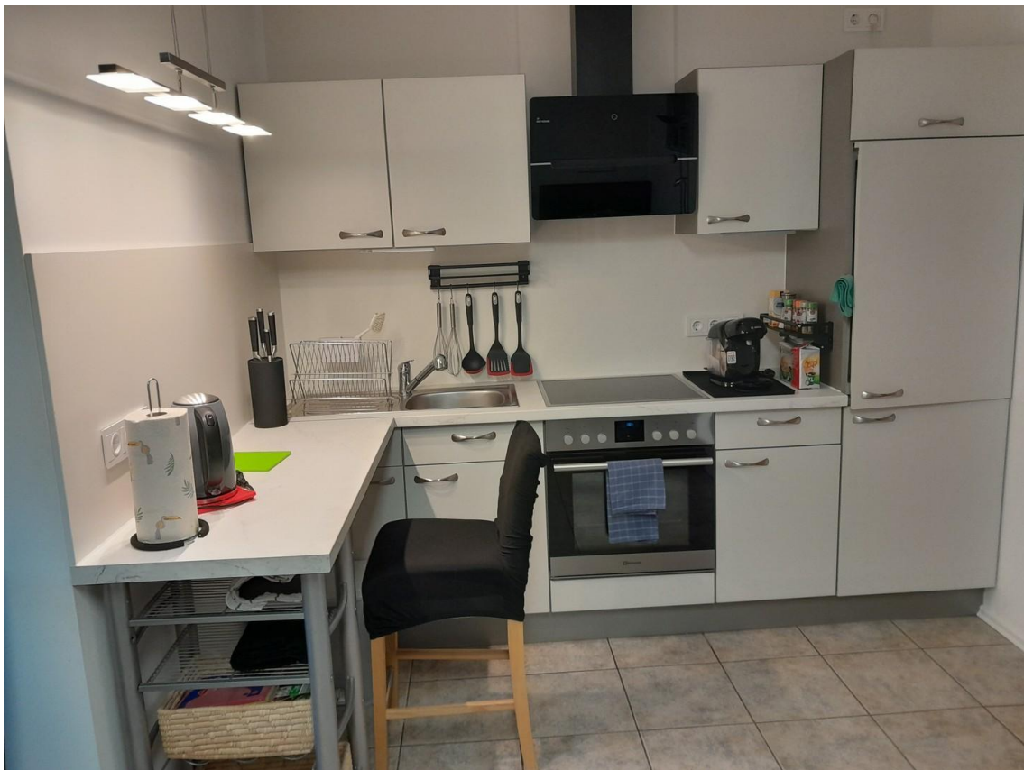
Kueche mit Essplatz