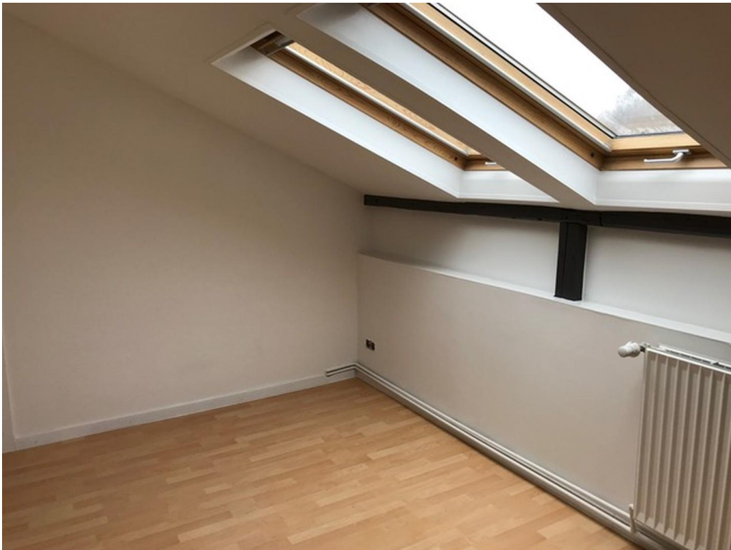
Wohn-Schlafraum linke Seite