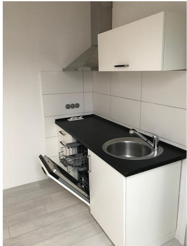
Küchenzeile mit Geschirrspüler