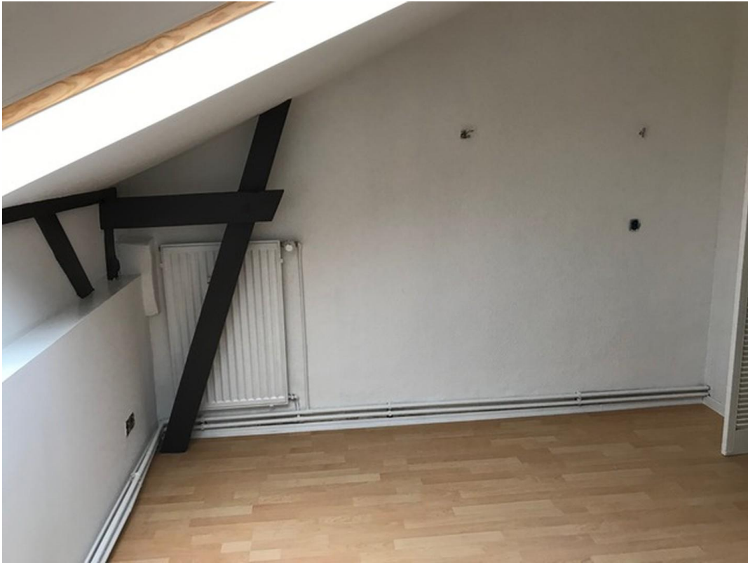
Wohn-Schlafraum rechte Seite