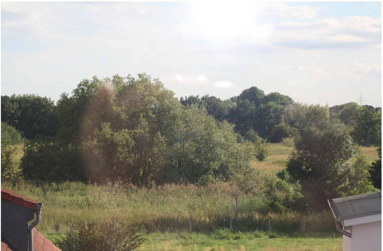
Krückkau in direkter Umgebung