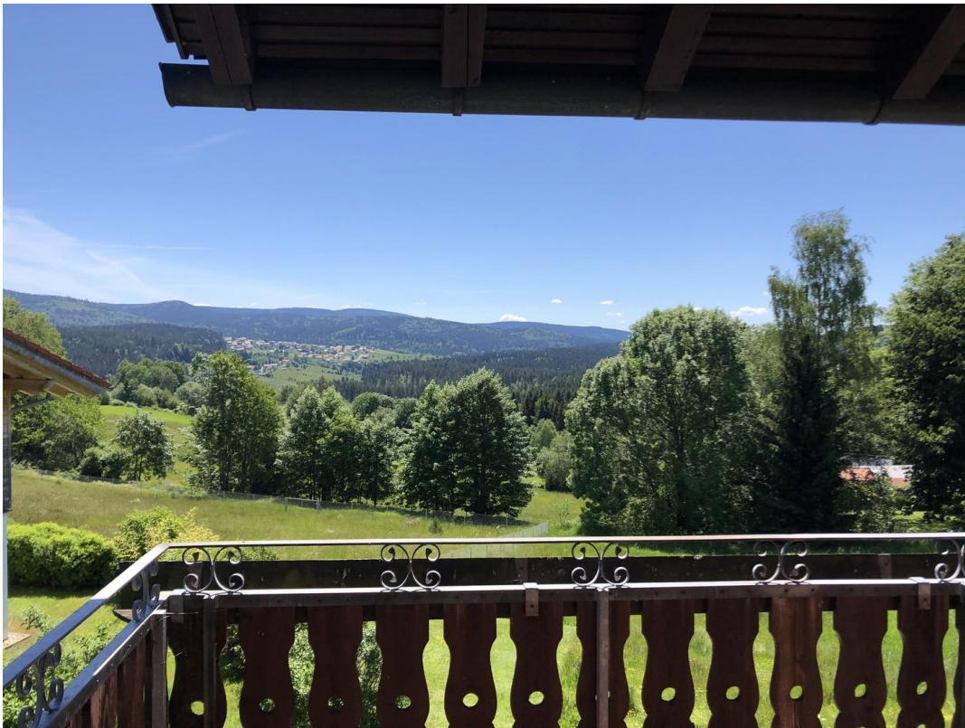
Aussicht von der Loggia