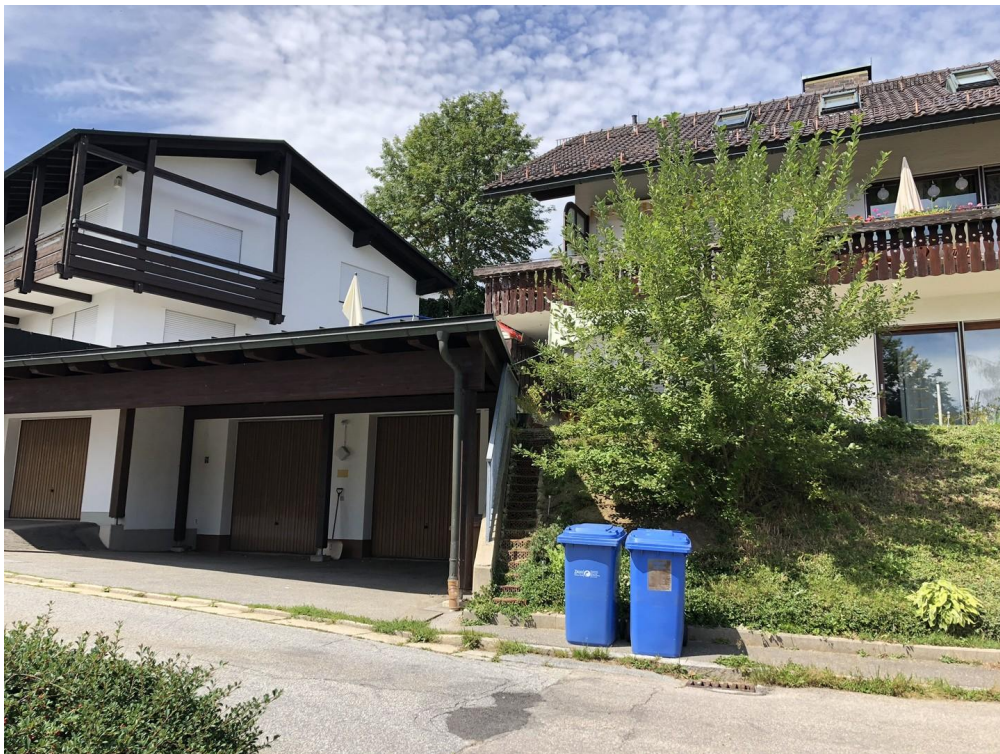
Carport und Garage