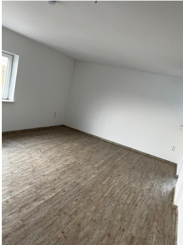
Wohn- / Schlafzimmer