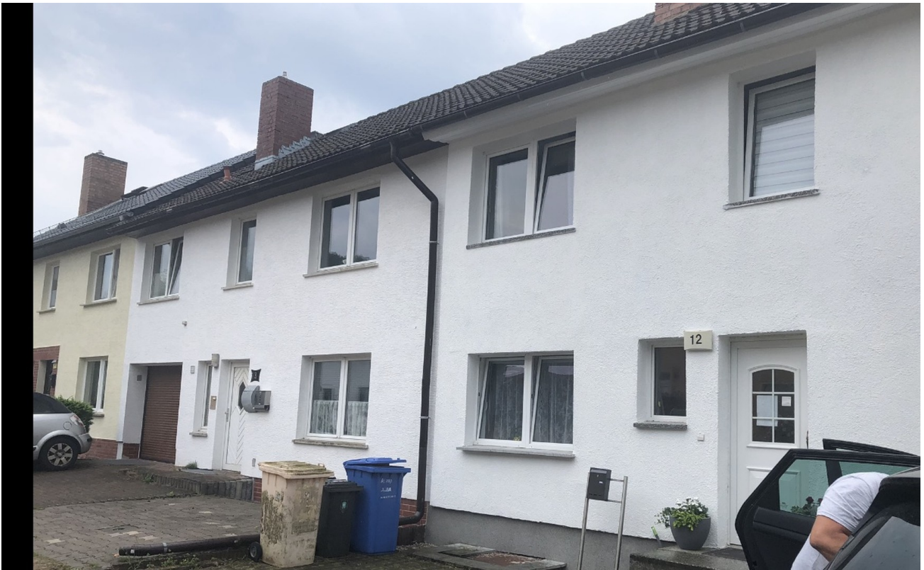
Haus vorderer Eingang