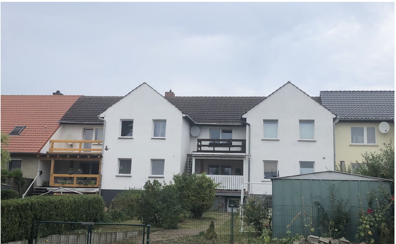
Haus von hinten aus dem Garten