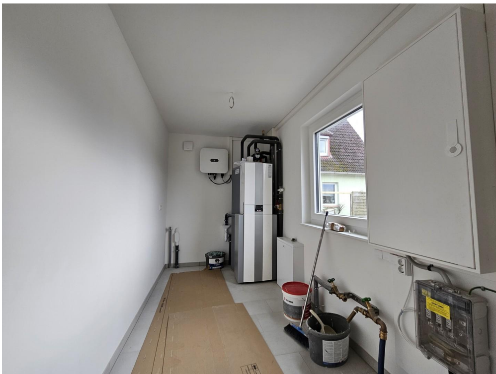
Wärmepumpe PV Anlage