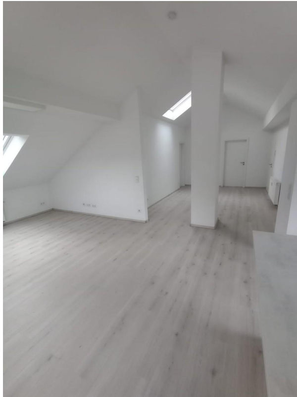
Eingangs-, Wohn- u. Essbereich