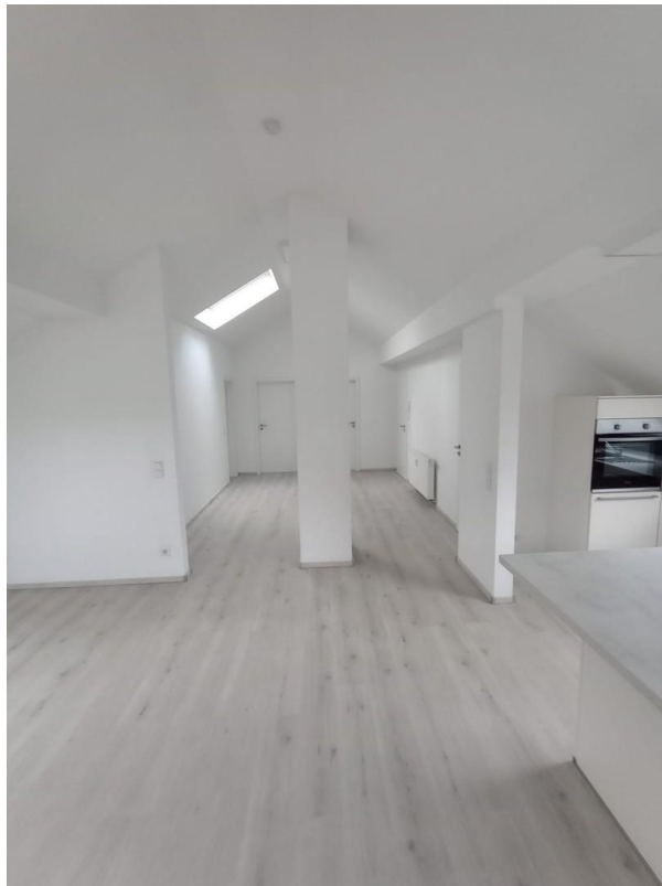
Eingangs-, Wohn- u. Essbereich