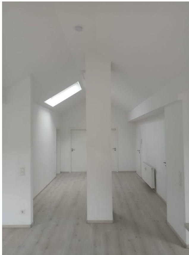
Eingangs- und Dielenbereich