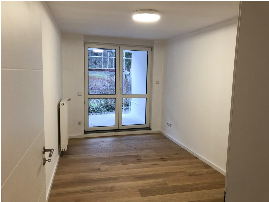
Zimmer mit Balkon