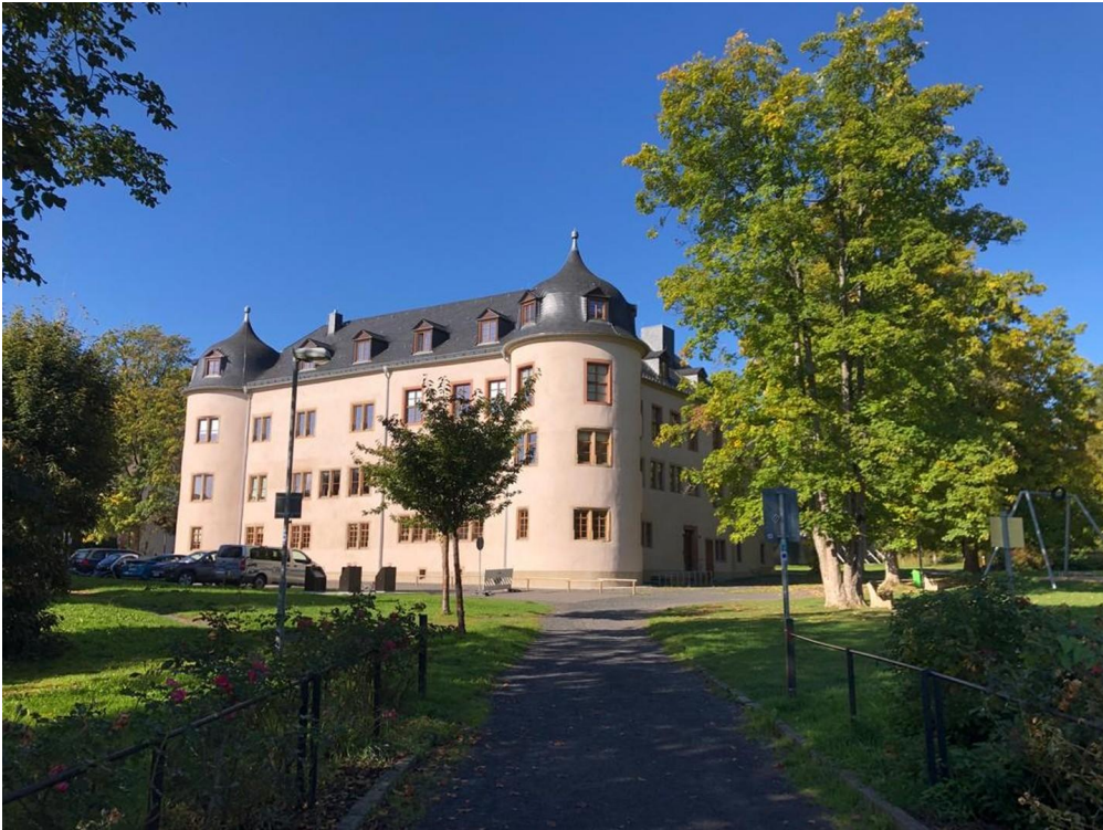
Wenige Meter zum Schloss