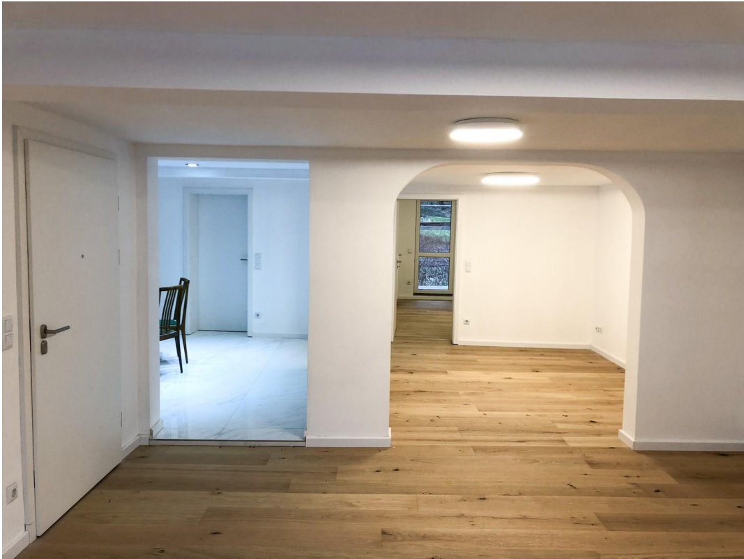
Essbereich & Küche