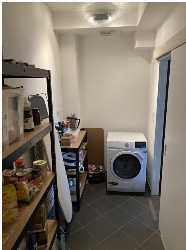
Abstellraum ( Neben Küche )