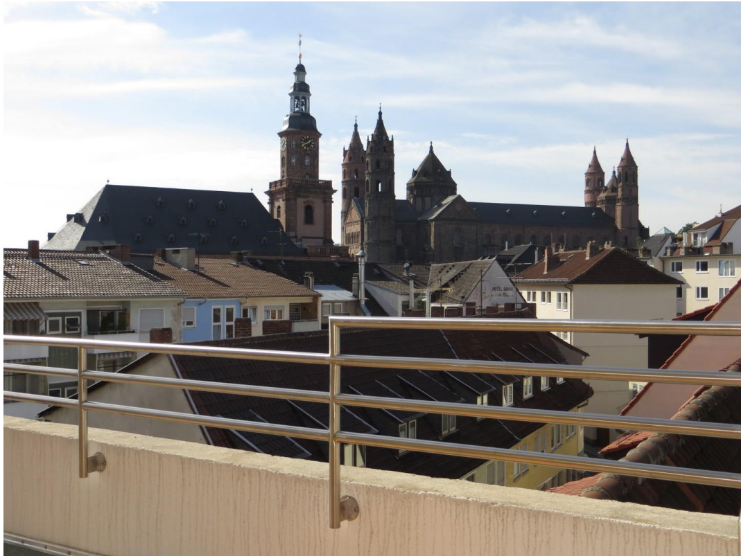
Blick von einer Dachterrasse