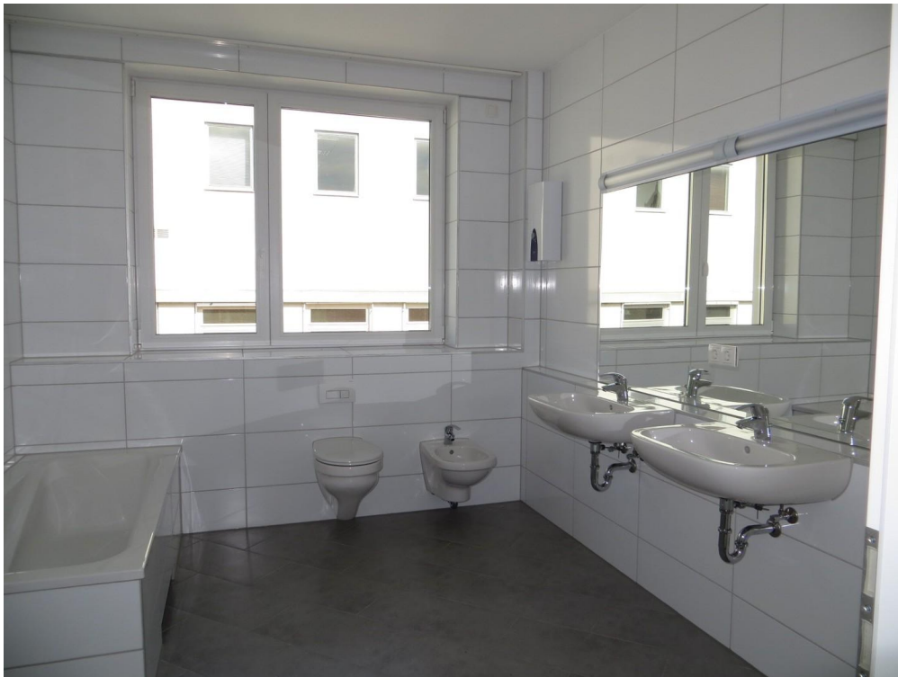
Bad mit WC