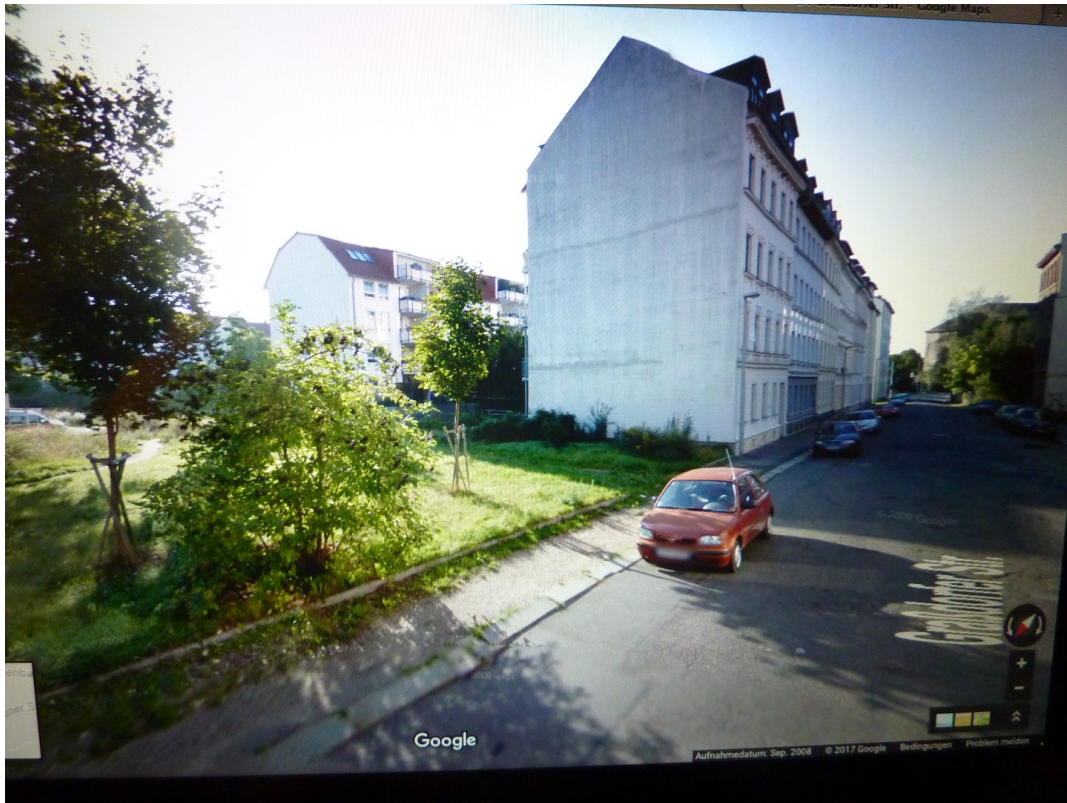
Blick Richtung Campus