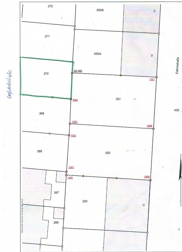
Flurkarte Graßdorfer Straße 24