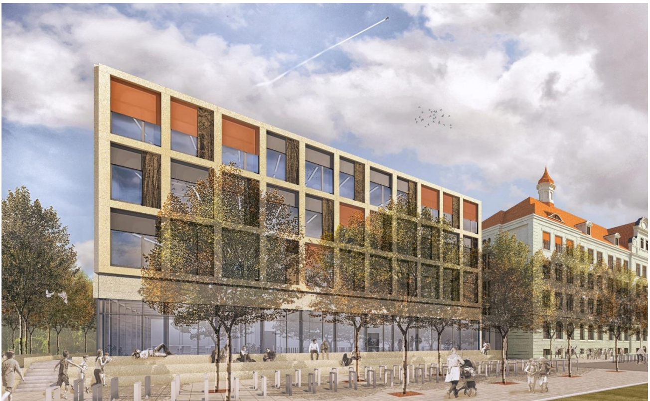
Planung Schulcampus Ihmelstr.