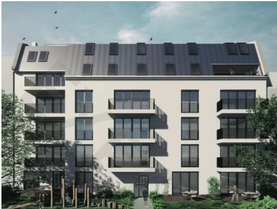
Blick vom Innenhof