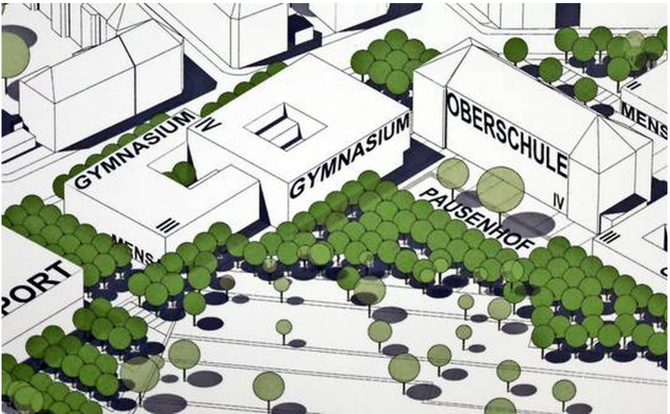
Campus ca. 200 m Entfernung